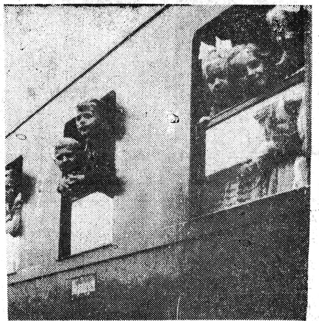
Na kolonię wyjeżdża wesoły pociąg.