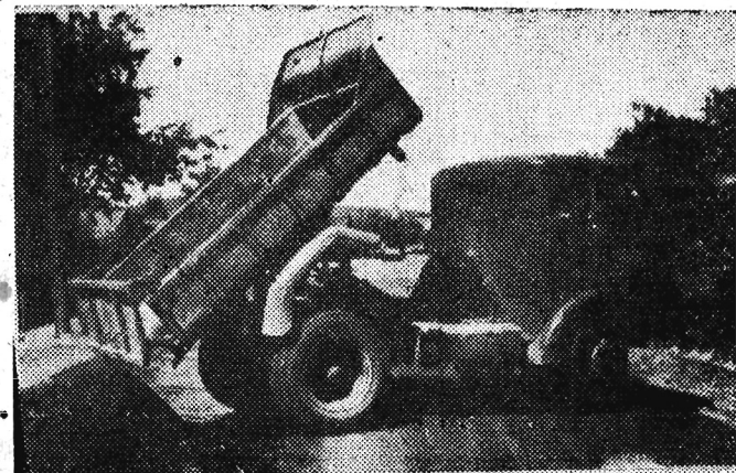
Taki oto samochód - wywrotkę bardzo ułatwia ludzom pracę przy dostarczaniu materiałów przy budowie i remontach dróg.