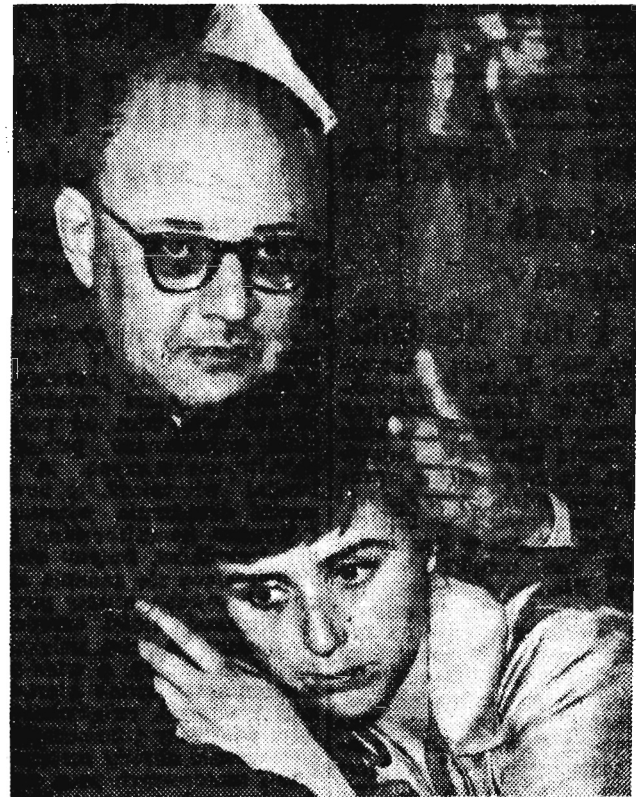
Dużym zainteresowaniem mieszkańców Szczecina cieszy się znana już w Polsce sztuka „Pamiętnik Anny Frank” grana w Teatrze Polskim.

Oto i cała tajemnica zwolnienia tempa wzrostu konsumpcji podstawowych artykułów. Nawet to, co zostało zaplanowane, będzie wcale nie łatwe do wykonania.