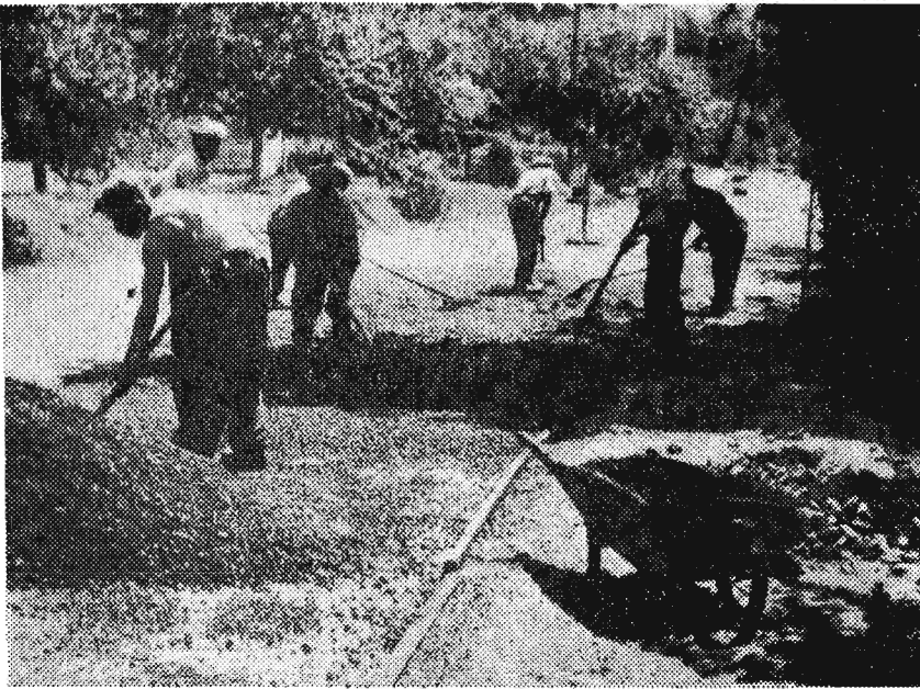
Robotnicy uwiązują się przy nakładaniu nawierzchni, która zalana asfaltem będzie trwale służyć.

Droga wiodąca z Rzeszowa do Strzyżowa nie należała do najlepszych stad remont jej ucieczył bardzo przede wszystkim kierowcom samochodowych a również i mieszkańcom wsi położonych po obu stronach szosy.