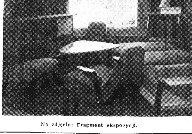
Na zdjęciu: Fragment ekspozycji.

W Kalwarii Zebrzydowskiej otwarte zostały XV Targi Kalwaryjskie - tradycyjne rzemieślnicze targi meblarskie. Meble z Kalwarii znane są w całym kraju.