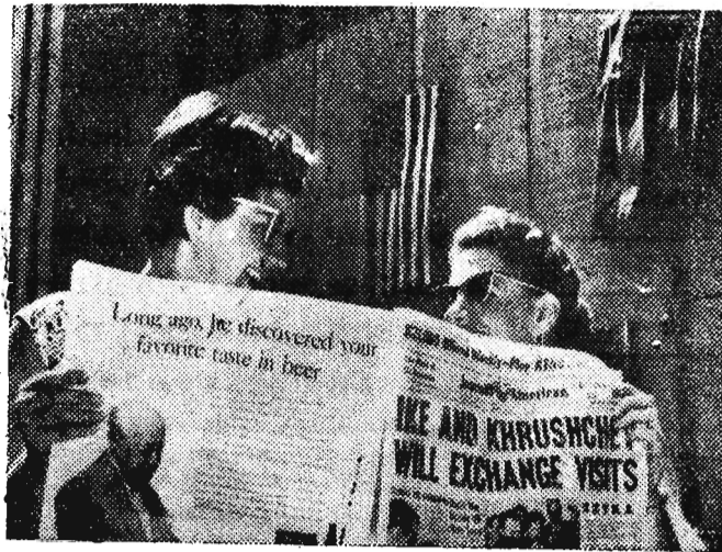
Na zdjęciu: Amerykańskie dziewczęta z gazetą zawiadamiającą o wymianie wizyt między premierem Chruszczowem a prezydentem Eisenhowerem. Za nimi na gmachu Coliseum, mieszczącym wystawę radziecką, powiewają flagi ZSRR i USA.