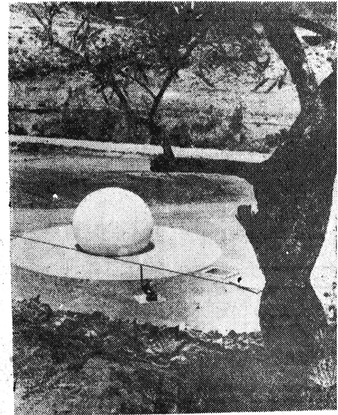
Dziwna biała kula to szczelny pokrowiec, wypełniony powietrzem, chroniący od kurzu i zmian atmosferycznych wielką antenę radarową w San Diego. Pokrowiec jest wykonany ze sztucznego tworzywa pokrytego warstwą syntetycznej gumy i ma 4 m średnicy.

Obowiązujące hasło na wsi brzmi więc: Tam, gdzie nie ma jeszcze kółek rolniczych, musi je zainicjować wespół z kółkiem ZSL partyjna organizacja podstawowa. Tam, gdzie członkowie partii do kółka nie należą — muszą do nich wstąpić, uważając to nie tylko za obywatelski, ale także partyjny obowiązek. J.