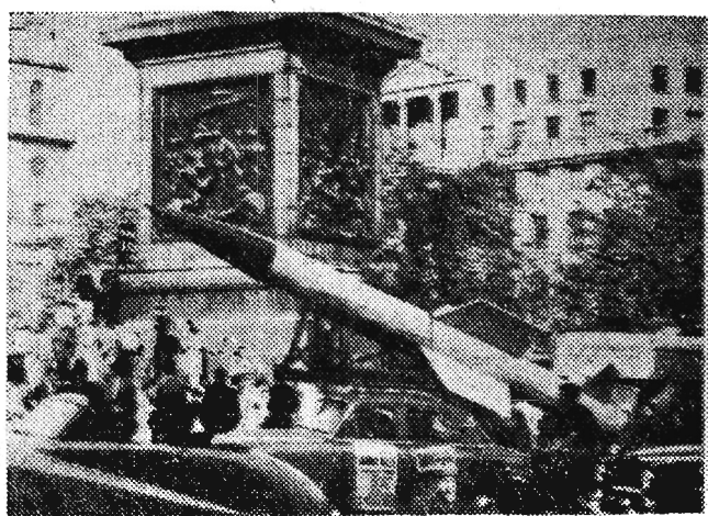
Fragment demonstracji o rozbrojenie atomowe, która odbyła się w ostatnich dniach na Trafalgar Square w Londynie.

b) Dotychczasowa działalność rad robotniczych w zakładach kopalnictwa naftowego jest jeszcze bardzo słaba.