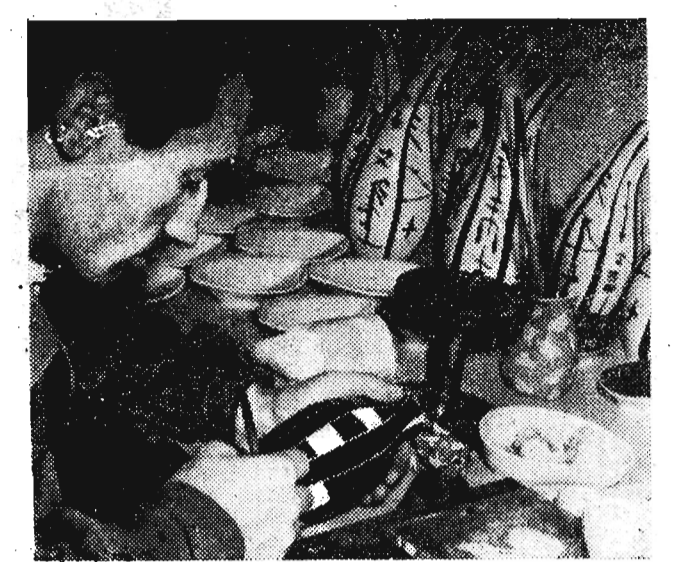
Na zdjęciu: W ośrodku wzornictwa przy Zakładach CAF