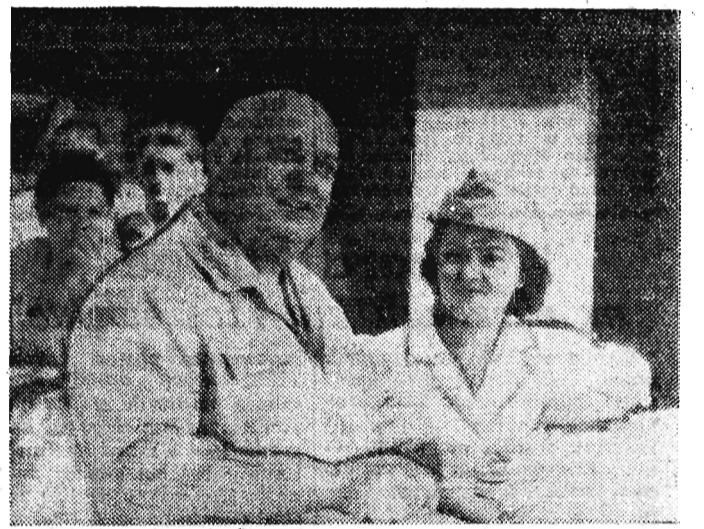
W jednym z ulicznych barów na Węgrzech turystę z Polski sfotografowano z sympatyczną Węgierką.