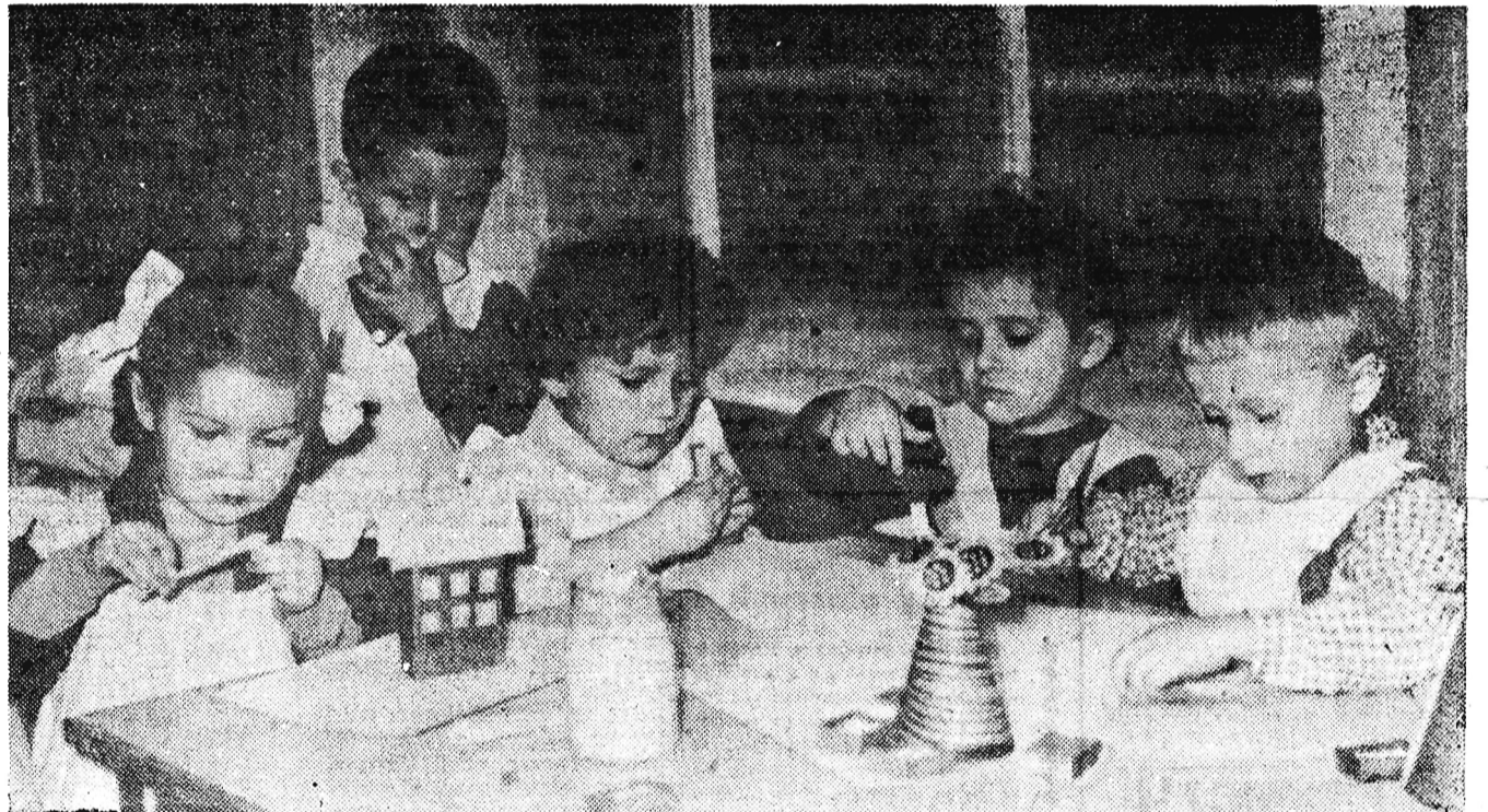
„Wiosenka” — to nowe przedszkole, w którym znalazło opiekę kilkadziesiąt dzieci matek pracujących — mieszkanek również nowo wybudowanego osiedla ZOR — Lipowa.