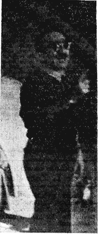
Na zdjęciu: Reżyser Aleksander Ford „na planie”.