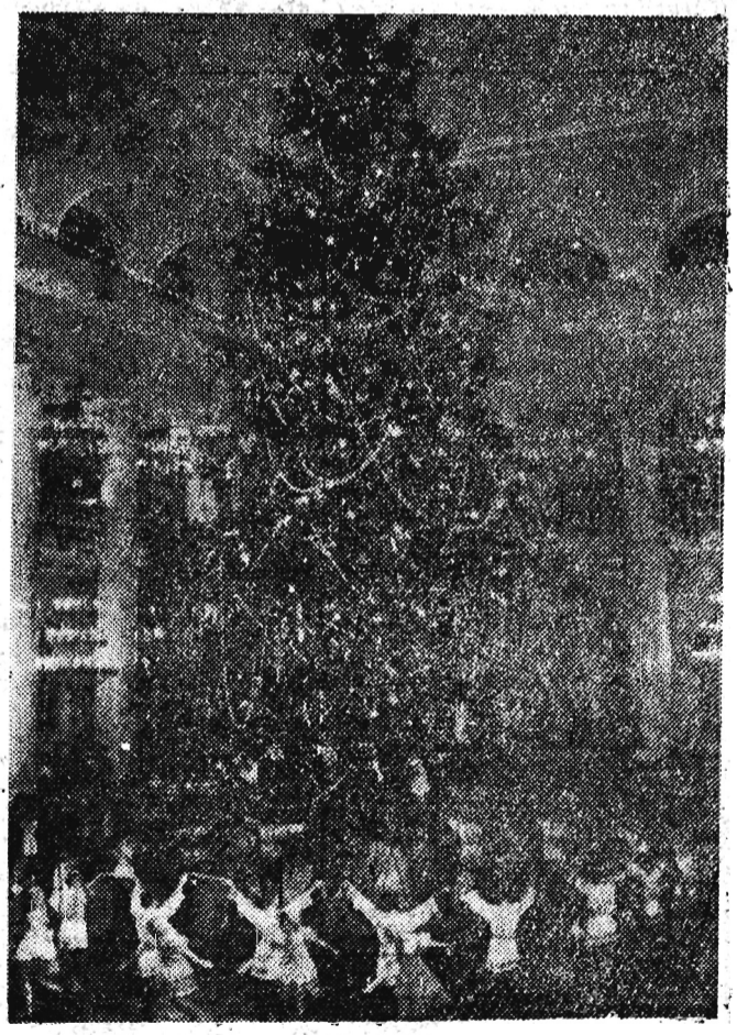
NOWOROCZNA CHOINKA W MOSKWIE Przy choince noworocznej w Sali Kolumnowej Domu Związków.

MOSKWA Podano tu w poniedziałek, że Międzynarodowa Federacja Lotnicza (FAI) zatwierdziła jako światowy absolutny rekord prędkości wynik lotnika radzieckiego Mosotowa, który osiągnął na jednomotorowym turbodrzutowcu „Jes-68” przeciętną prędkość 2.358 km na godzinę. Mosotow ustanowił ten rekord 31 października ub. roku. Dotychczasowy rekord prędkości wynosił 2.231 km na godzinę i należał do Amerykanina Waltera Irwina oraz odrzutowca „F-104”.