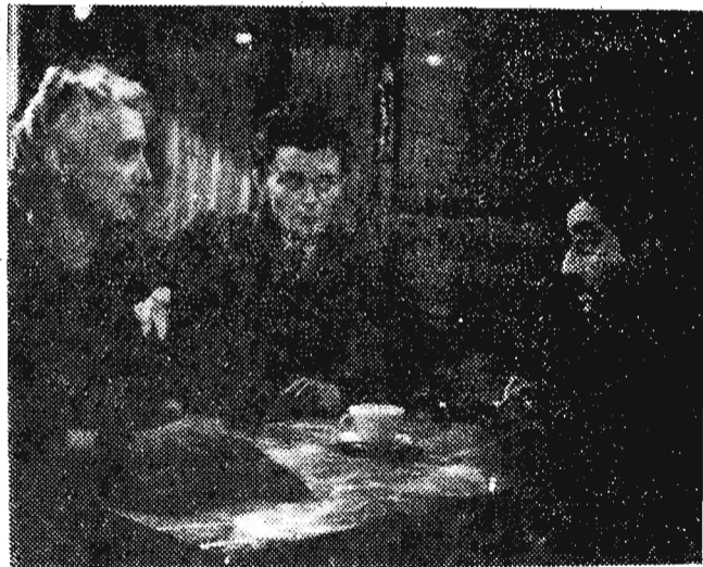
Na zdjęciu: Scena z filmu „Mała, uroczą plaża”.