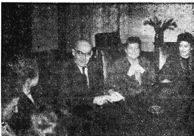
W dniu 4 marca 1960 r. I sekretarz KC PZPR Władysław Gomułka przyjął działaczki ruchu kobiecego.