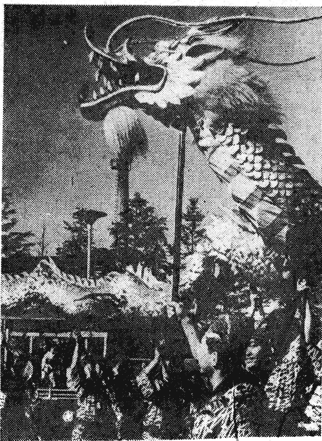
Taniec „Złotego Smoka” jest jednym z najbardziej malowniczych występów w dorocznym festiwalu Kanon w Tokio. Zalicza się on do najstarszych obrzędów w Japonii i poświęcony jest bogini miłosierdzia. Jak głosi legenda, w 628 roku w dniu 18 marca dwaj rybacy wyłowili z morza wizerunek bogini i oddał w tym właśnie dniu obchodzone jest corocznie jej święto.

Następne dwa dni posłowie poświęcą na zwiedzanie różnych ośrodków. 23 kwietnia odbędzie się specjalna narada, na której omówiony zostanie całokształt sytuacji, jaka w tej dziedzinie istnieje.