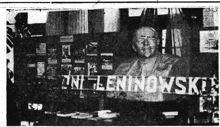
W gmachu Prezydium Wojewódzkiej Rady Narodowej w Rzeszowie z okazji „Dni Leninowskich” otwarta została wystawa. Gromadzi ona szereg ciekawych eksponatów, a m. in. dzieła Lenina, zdjęcia dokumentalne, itp. Bardzo ciekawie i bogato ilustrują one działalność wodza proletariatu w okresie Wielkiej Rewolucji Październikowej. Nie brak też zdjęć osobistych W. I. Lenina, które cieszą się dużym zainteresowaniem wśród zwiedzających. Wystawa czynna będzie do końca bieżącego miesiąca.