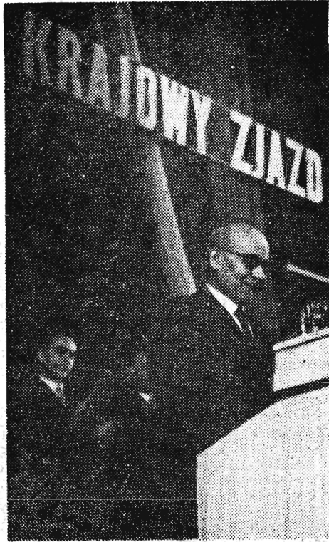
Na zdjęciu: W pierwszym dniu obrad — w imieniu Komitetu Centralnego PZPR wita Zjazd I sekretarz KC PZPR Władysław Gomułka.

wojewódzka z bogatą częścią artystyczną. Mamy jednak nadzieję, że pogoda będzie jak zwykle na 1 Maja — słoneczna i ciepła. 1 Maja, dorocznym zwyczajem ulicami Rzeszowa przejdzie — po wysłuchaniu przemówienia I sekretarza KC PZPR tow. Władysława Gomułki — manifestacyjny pochód. Do szczegółów związanych z uroczystościami 1 Maja wrócimy w najbliższym czasie.