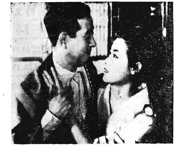
'ULICA HANBY'. Film produkcji japońskiej dozwolony od lat 18. Ukazuje tragedię dziewcząt japońskich, które los zmusił do uprawiania prostytucji.