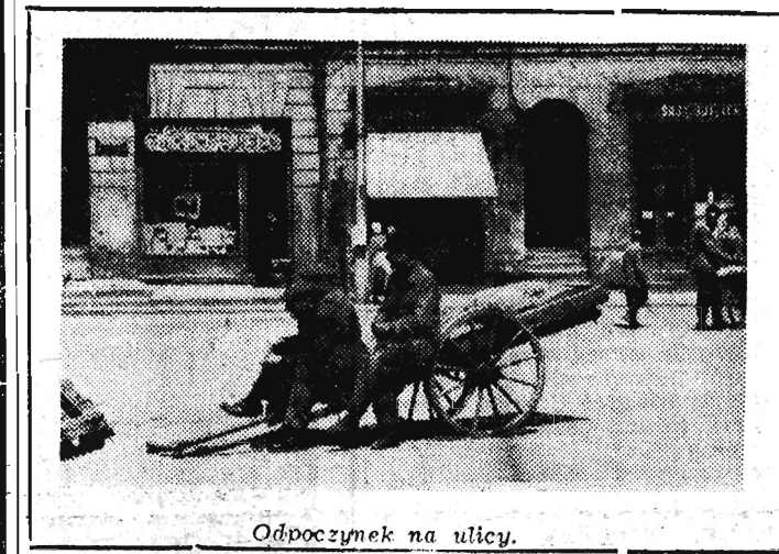
Odpočynek na ulicy.