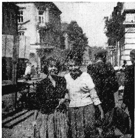
Ulice naszych miast „okupowane” są przez młodzież - wiadomo w kacie. Wróciła brać studiująca w Krakowie, Wrocławiu, Gdańsku...

Informujemy, że organizatorem wycieczek 6- i 14-dniowych do NRD oraz 14-dniowej do Jugosławii jest PTTK Rzeszów.