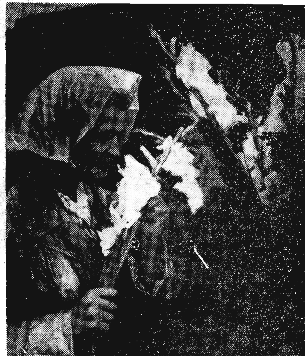
W dzień deszczowy, szczególnie piękne wydają się kwiaty.