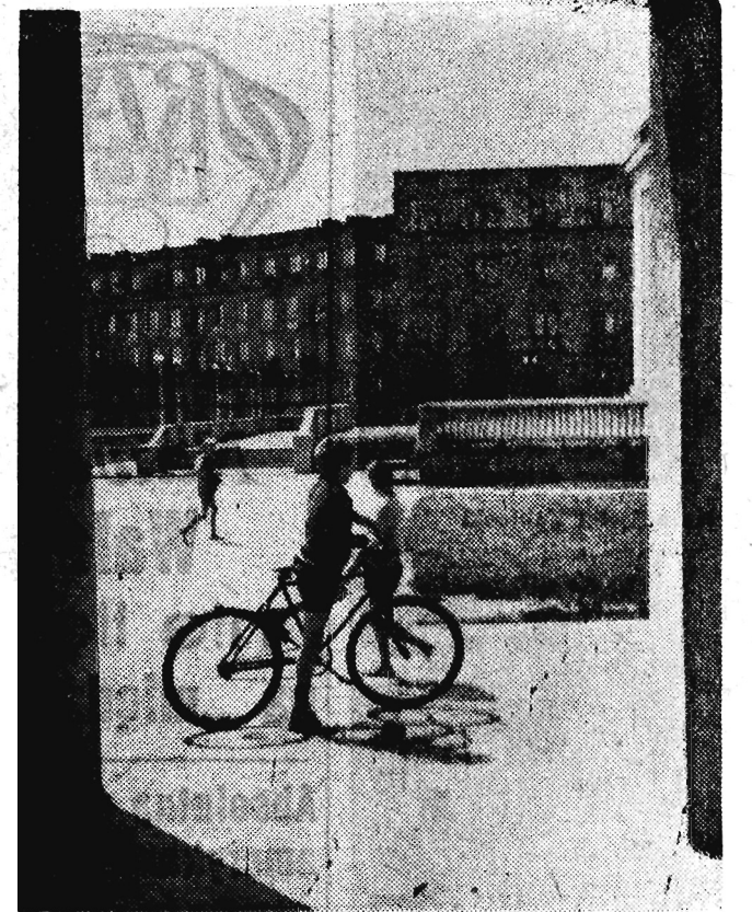
Fragment Osiedla WSK