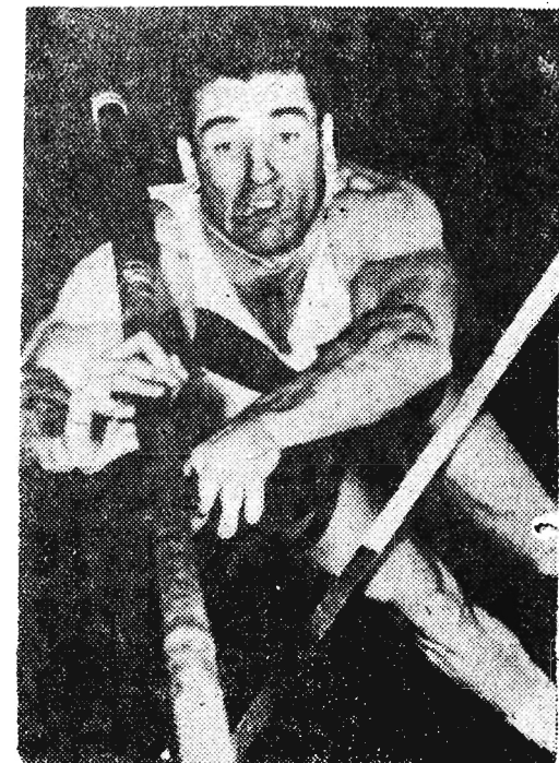
Na zdjęciu: D Bragg (USA) złoty medalista w skoku o tyczce.

Po tym spotkaniu Polska znajduje się na 18 miejscu, mając 1 pkt i stosunek koszy 156:183.