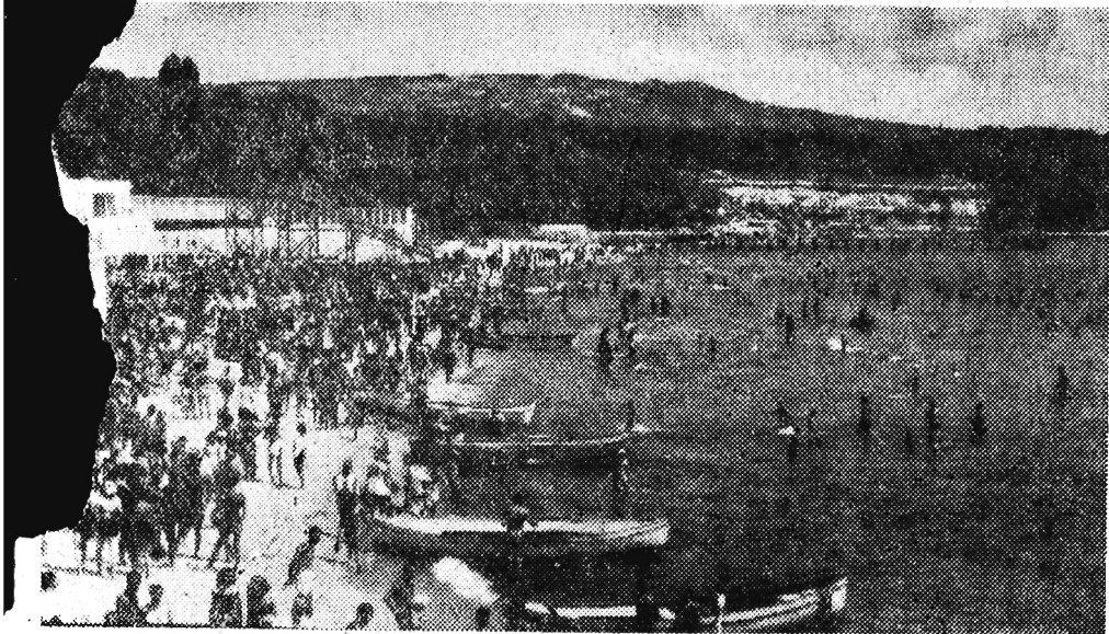
Bułgarska Riviera — wybrzeże Morza Czarnego ściągają corocznie rzesze turystów z całego świata. Nie brak wśród nich i naszych rodaków, którzy coraz chętniej spędzają tu swoje urlopy. Na zdjęciu: Plaża w Warnie.