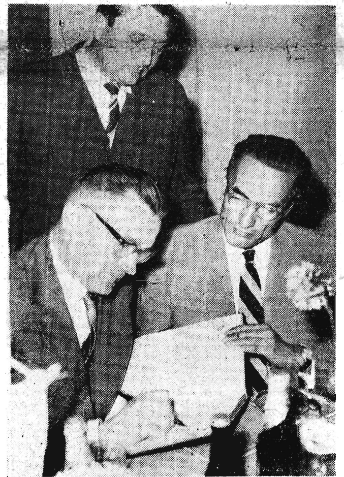
Towarzyszący delegacji CSRS wicepremier Piotr Jaroszewicz wpisuje się do książki pamiątkowej w kopalni siarki w Piasecznie.