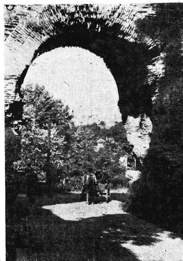
Stara architektura jest w Bułgarii przedmiotem żywego zainteresowania turystów zagranicznych. Niektóre z tych zabytków pamiętają jeszcze czasy rzymskie. Na zdjęciu: Brama w murach obronnych miasta Hissar.