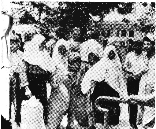
Najpopularnym blasku słońca białe chusty dosłownie chronią przed zabójczym działaniem promieni, stąd popularność nakrycia głow wśród kobiet wiejskich. Na zdjęciu: miesiąc w okolicach Kolarowgradu.