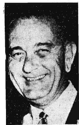
Demokratyczny kandydat na wiceprezydenta USA Lyndon B. Johnson.