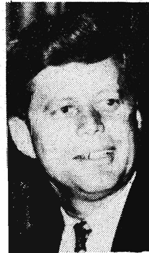
John F. Kennedy