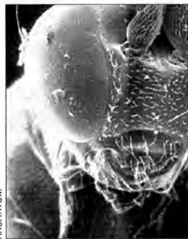
jest przywiązany do miejsca i łatwo mu się przemieszczać. Krótko mówiąc, może uciec. Najgorzej mają zwierzęta domowe, których na wspomnianych terenach już sporo padło. Meszki wślazą do nozdrzy, uszu, oczu, pysków i tną jadowicie.

Ulubioną siedzibą jadowitej zgrai są tereny nizinne i podmokłe. Ostatnie sygnały świadczą, że oparowały Lubelskie, Sandomierskie, Zamojskie. Ta inwazja meszki kaukaskiej na południe niesie zagrożenie i nam, zatem profilaktycznie zapytałem fachowców, jak się przed tą plagą bronić. Okazuje się, że człowiekowi najłatwiej, gdyż nie