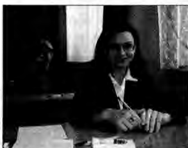
Uśmiechy na twarzach maturzystów skrywały emocje przed egzaminem.

Pierwszym testem dojrzałości i wyniesionej ze szkoły wiedzy był pisemny egzamin z języka polskiego. Przed otwarciem kopert z egzaminacyjnymi zadaniami maturzyści musieli potwierdzić przed komisją swoją decyzję uczestnictwa w egzaminie, zadeklarować dobre samopoczucie i zapoznać się z regulaminem matury. Ogólną wesołość na sali wzbudził punkt regulaminu stanowiący, że salę egzaminacyjną można opuścić „za potrzebą” tylko w asyście członka komisji. Przez pięć godzin maturzyści w lubaczowskim LO trudnili się nad następującymi tematami: „Maski i cienie – ich rola i znaczenie w życiu człowieka”, „Rozwiąż problem – życie ludzkie jest mieszanką szaleństwa i rozsądku. Sprawdź w jakim stopniu wpłynęły one na wybranych bohaterów literackich”, „Cywilizacja XX wieku jest kłeską czy triumfem – na podstawie lite-