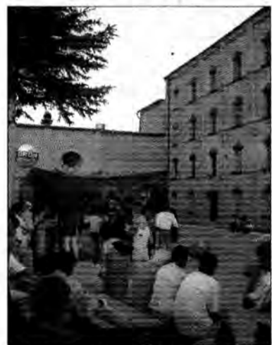
Urodziny w Szalonym Młynie.

Przez dwa pierwsze majowe dni przemyski Klub Muzyczny Crazy Mill obchodził swoje pierwsze urodziny. Z tej okazji właściciele Szalonego Młyna przygotowali dwudniowy piknik.