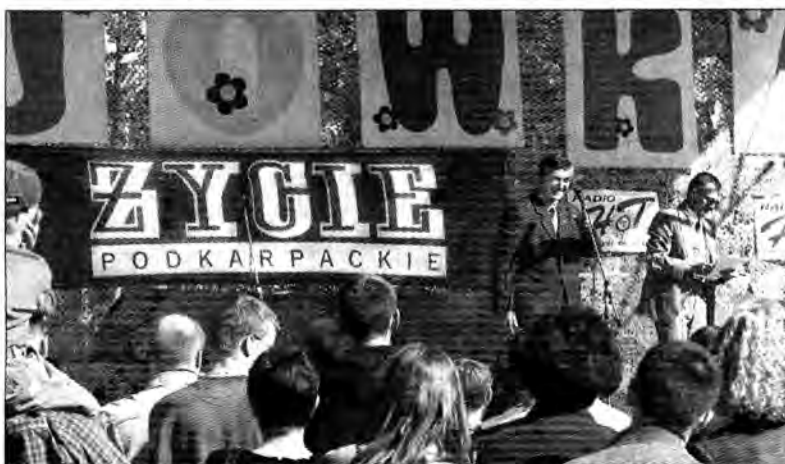
Wielką Majówkę już po raz trzeci zorganizowały: Urząd Miasta Jarosławia, Miejski Ośrodek Kultury i Miejski Ośrodek Sportu i Rekreacji. Sponsoring objęły Tyskie Browary Książęce, patronat medialny zaś Radio HOT i Życie Podkarpackie .