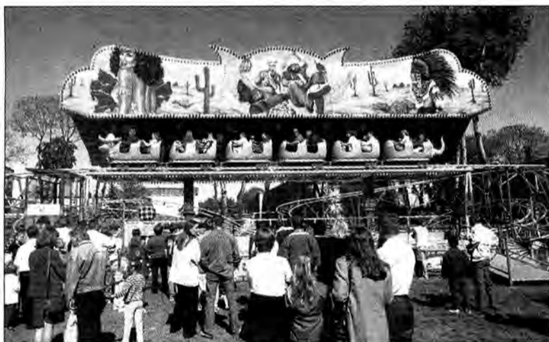
Dla bardziej odważnych była pędząca kolejka.