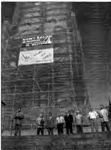
W Rzeszowie tradycyjnie lewicowi politycy wiecowali pod pomnikiem Czynu Rewolucyjnego.

Po złożeniu wiązanek kwiatów pod pomnikiem sympatycy SLD przenieśli się do Przybyszówki na piknik socjaldemokratów. DW