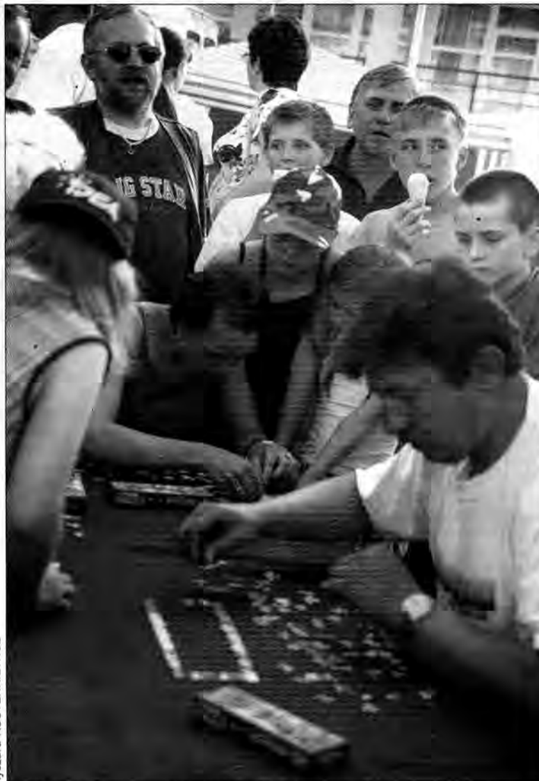
Układanie puzzli na czas cieszyło się dużym powodzeniem.

Program pikniku mógł zadowolić każdego. Dużym zainteresowaniem cieszyły się różnorodne konkursy, uwzględniające upodobania zarówno dzieci jak i dorosłych. Było więc układanie puzzli na czas, turniej wiedzy o Gromadzie, konkurs piosenkarski, podczas którego wokaliści śpiewali z kostką lodu