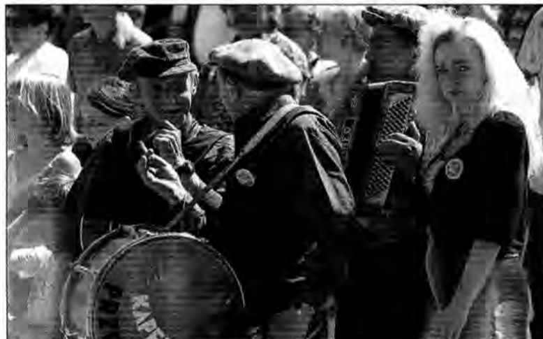
Przemyska Kapela Po Prostu tuż przed występem.

Przemyśl powoli staje się stolicą kapel podwórkowych. Działa tu Stowarzyszenie Ratowania Folkloru Miejskiego oraz aż sześć kapel. Tu również od lat odbywa się Ogólnopolski Festiwal Kapel Podwórkowych. W tym roku pierwsza nagroda w tej imprezie przypadła przemyskiej Kapeli Fidelis.