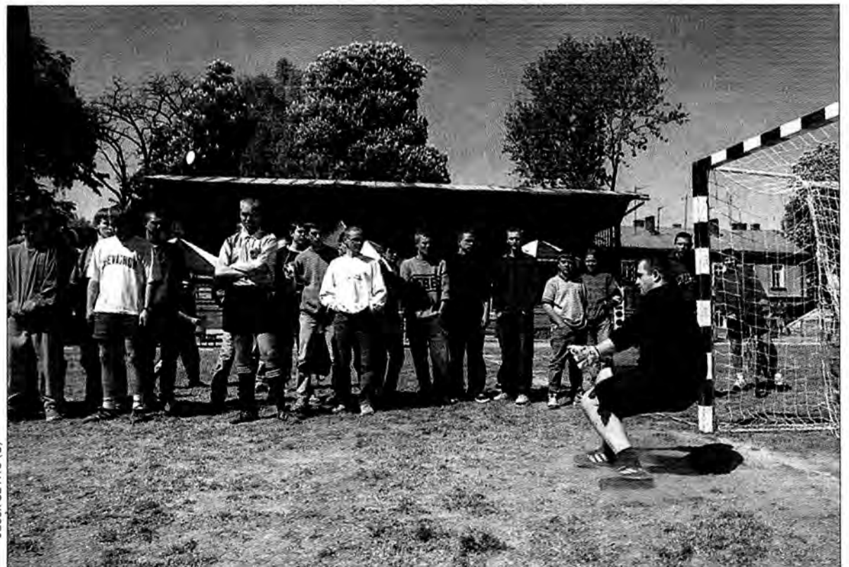
Przez trzy dni festynu, równocześnie z innymi imprezami, odbywały się rozgrywki sportowe.