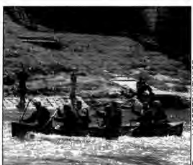
Wśród kajaków w spływie uczestniczyła też taka, kilkusobowa jednostka pływająca.

Od 28 kwietnia do 3 maja na 113-kilometrowym odcinku Sanu od Sanoka do Przemyśla odbywał się jubileuszowy XXX Ogólnopolski Spływ Kajakowy im. Mariana Plebańczyka.