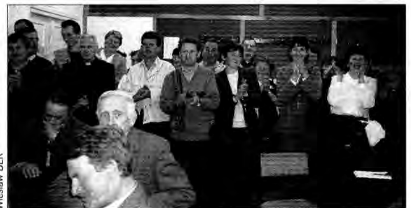
Rzesiste brawa na koniec sesji gminy Lubaczów.

Na zebraniu wiejskim 1 i 3 maja solidarnie zadeklarowali wolę zorganizowania gimnazjum i postanowili osobiście dopilnować radnych, aby podjęli zgodną z ich oczekiwaniami decyzję. Grupa kilkudziesięciu osób, głównie kobiet, cierpliwie