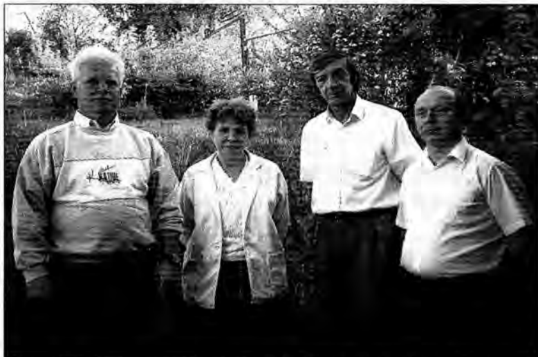
Czterech z siedmiu krasiczyńskich radnych, którym nie podobają się poczynania gospodarze władz gminy.

Według opozycyjnych radnych, remont obiektu o powierzchni ok.