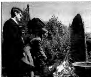
Przedstawiciele młodzieży przeworskiej przed obeliskiem upamiętniającym Konstytucję 3 maja