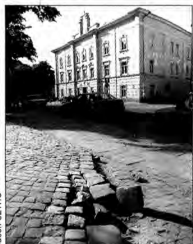
Tajemnicza dziura obok przemyskiego magistratu

Ponieważ Przemyśl nie jest położony w strefie wzmoczonych ruchów tektonicznych, trudno było wytłumaczyć to zjawisko w sposób racjonalny. Zresztą nie było komu zajmować się tym. Młodzież okupująca Rynek nie zauważa takich drobiazgów, zabiegani przechodnie również, a archeolodzy zajęci byli wtedy wykopkami koło katedry. Tymczasem szczelina powiększała się wolno ale systematycznie. Nagle któregoś dnia (albo nocy) zniknęły dwie granitowe kostki prawdopodobnie pochłonięte przez