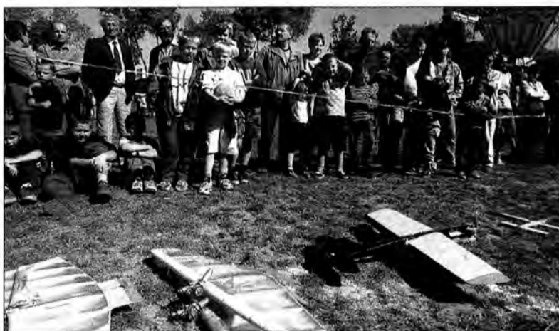
W tym roku wielką atrakcją był pokaz modeli latających.