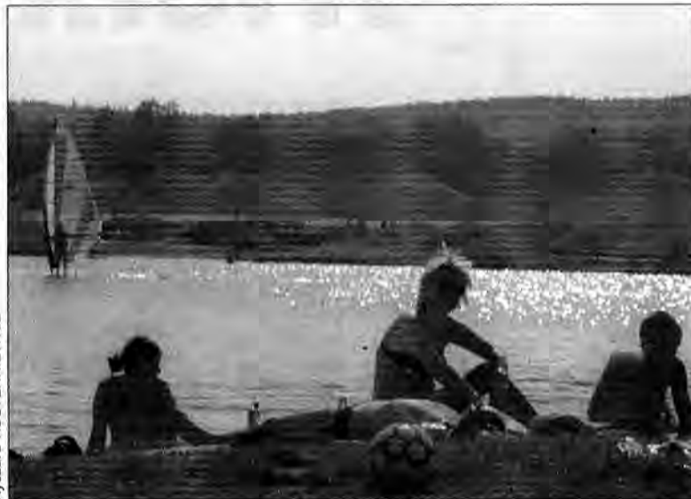
Upalna pogoda sprawiła, że już pod koniec kwietnia zapełniły się ulubione miejsca plażowiczów, takie jak to na żwirowisku w Ostrowie pod Przemyślem.

Na zgubne działanie promieni słonecznych najbardziej narażeni są ludzie o jasnej karnacji i jasnych bądź naturalnie rudych włosach, przebywający w miejscach o dużym nasłonecznieniu. Stąd najwięcej przypadków zachorowań na raka skóry notowanych jest w Australii, zasiedlonej przez przybyszów z Wysp Brytyjskich i północnej Europy. W naszym kraju co czwarty dorosły Polak ma zmiany skórne wywołane przez promienie słoneczne. Wiele z tych objawów uzewnętrznia się dopiero po latach, bowiem część widma słonecznego, tzw. promienie UVA, wnika głęboko w skórę i działają jak bomba z opóźnionym zapłonem. Promienie UVB zatrzymywane są w naskórku i to one są odpowiedzialne zarówno za „piękną” opaleniznę, jak i wiele powierzchniowych zmian na skórze: pojawiają-