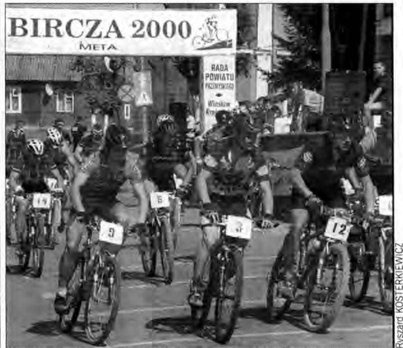
Start i meta wyścigu zlokalizowane zostały na birczańskim Rynku.