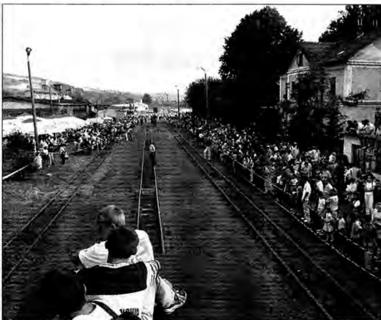
W tym roku do Dynowa znowu wyruszy kolejka.

Z tygodniowym opóźnieniem, dokładnie 13 maja, rusza kolejka wąskotorowa z Przeworska do Dynowa. Jak powiedział nam Władysław Żelazny, naczelnik sekcji kolei dojazdowej w Przeworsku jeszcze niedawno groziło jej zamknięcie. Obfite opady śniegu i deszczu spowodowały podmycie przepustu kolejowego. Stwarzało to zagrożenie dla kolejki, konieczny był remont, na który na szczęście znalazły się pieniądze. Dzięki temu kolejka w tym roku znowu wyruszy do Dynowa. Remont trwał miesiąc i to było powodem opóźnienia. Kolejka wyruszy w trasę 13 maja o 9.05. Będzie jeździła do Dynowa w każdą sobotę i niedzielę o tej samej porze. Od poniedziałku do piątku będzie kursowała na zamówienie zorganizowanych grup. DW