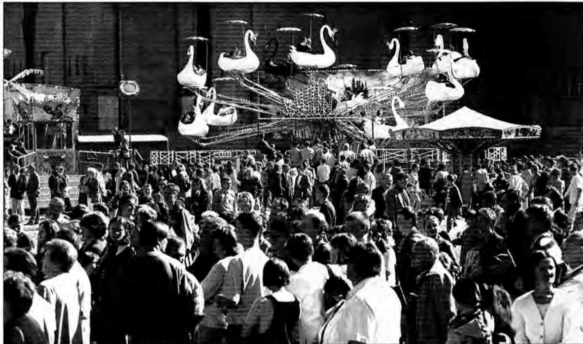
Największą atrakcją Wielkiej Majówki w Jarosławiu okazało się czeskie wesołe miasteczko.

Przez pierwsze trzy dni maja stadion szkolny przy ulicy Piekarskiej w Jarosławiu tętnił życiem. Festyn „Wielka Majówka” zgromadził tłumy. Rodzice ze swoimi maluchami obiegali wesołe miasteczko i dmuchany zamek – zjeżdżalnię. Dzieci spacerowały po stadionie z prażoną kukurydzą, cukrową watą i kolorowymi balonikami. Młodzież gromadziła się przy scenie, na której rozbrzmiewała muzyka zespołów muzycznych, a fani sportu, zarówno chłopcy jak i dziewczyny, toczyli zaciekle boje na boiskach sportowych do koszykówki, piłki nożnej, siatkówki plażowej i tenisa. Piwosze zasiadali pod parasolami i opijali się piwem, do którego mogli zamówić tradycyjnie – kiełbasę z grilla. Największe tłu-