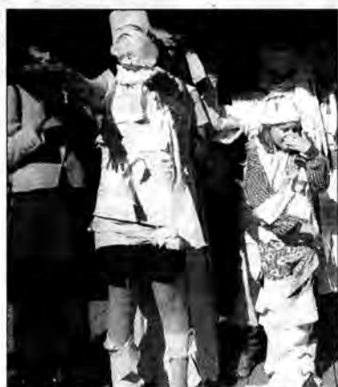
Kreację z papieru toaletowego też da się wyczarować.