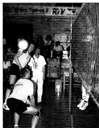
Mimo ambitnej postawy ataki (zdjęcie z lewej) siatkarki Iwopolu Team nie były tak skuteczne jak bloki zawodników Nomadu Panmar.