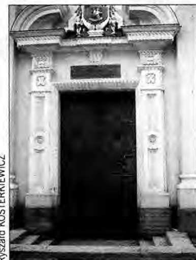
Stare, po konserwacji, staną się obiektem muzealnym.

Z inicjatywy ks. arcybiskupa Józefa Michalika, w głównym wejściu do przemyskiej archikatedry zamontowane zostaną nowe, wykonane z brązu drzwi. Zdobić je będą wizerunki przedstawiające historię zbawienia oraz dzieje przemyskiej katedry, od romańskiej rotundy, aż do dnia dzisiejszego.