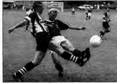
Ostrych spięć nie brakowało.