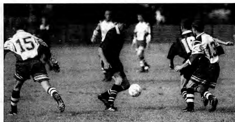
Tuż przed inauguracją rozgrywek piłkarze Bizona (koszulki w pasy) zaprezentowali się korzystnie.

Przed meczem odbyła się miła uroczystość, podczas której dru-