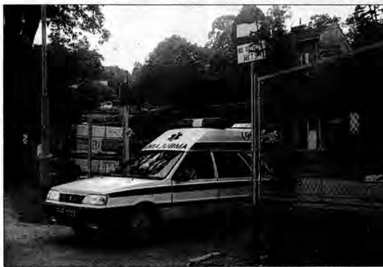
Wojewódzka Stacja Pogotowia Ratunkowego w Przemyślu przestanie istnieć.

Pracownicy Zarządu Wojewódzkiej Stacji Pogotowia Ratunkowego w Przemyślu nie zgadzają się z przyjętą przez Urząd Marszałkowski w Rzeszowie formą restrukturyzacji ich zakładu, która de facto prowadzi do jego likwidacji. Nie ukrywają, że boją się utraty miejsc pracy, ale podkreślają też, że ich zdaniem organ prowadzący WSPR, czyli Urząd Marszałkowski, działa niezgodnie ze statutem podległej sobie jednostki.