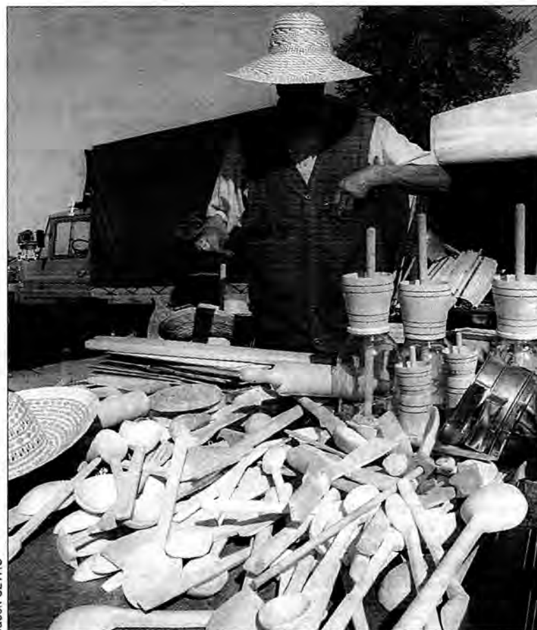
Może zjawi się tu kiedyś jakiś Niemiec lub Francuz, to z nami pohandluje.