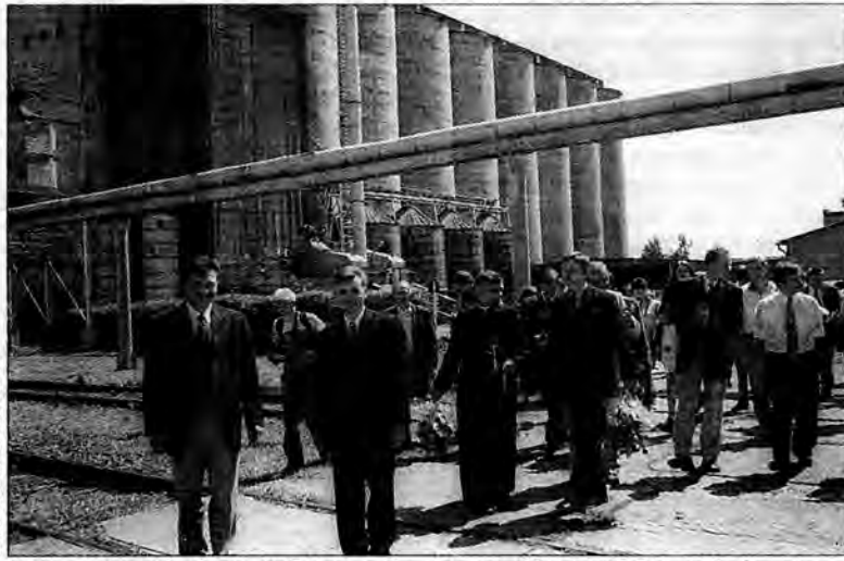
Podczas otwarcia Centrum Rolniczo-Handlowego „Wschodni Rynek Hurtowy”.

Centrum Rolniczo-Handlowe powstało przy współdziałaniu lokalnych samorządów. Do grona akcjonariuszy spółki przystąpiło 16 gmin z terenu powiatu jarosławskiego i lubaczowskiego oraz gmina Stubno z powiatu przemyskiego. W czerwcu bieżącego roku spółka stała się właścicielem postawionych w czerwcu ubiegłego roku w stan upadłości jarosławskich zakładów zbożowych. Spółka „Wschodni Rynek Hurtowy” nabyła od syndyka masy upadłościowej dwa elewatory o pojemności 10 i 20 tys. ton, młyn, kaszarnię, dwie suszarnie, czyszczarnię, bocznicę i wagę. Warunkiem nabycia tych obiektów było wpłacenie 3 milionów złotych. Na ten cel spółka zaciągnęła kredyt skupowy w wysokości 1 mln złotych z PKO SA w Jarosławiu, kre-