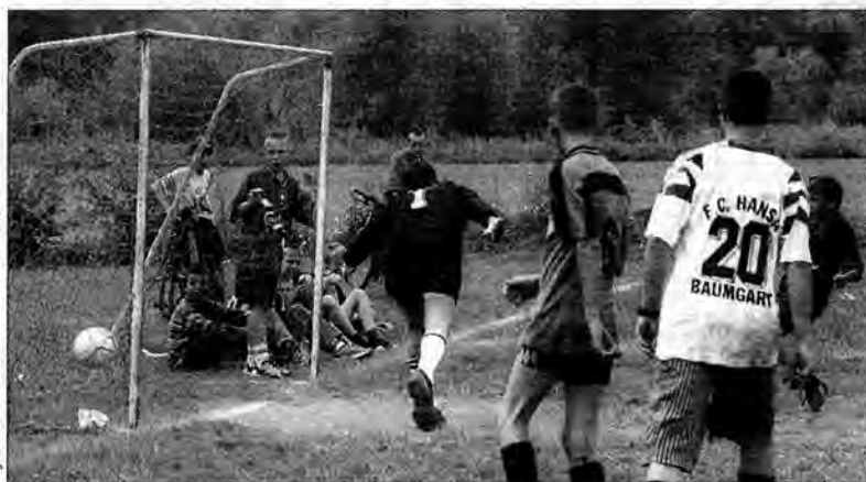
Takich sytuacji podczas wakacyjnego turnieju nie brakowało.