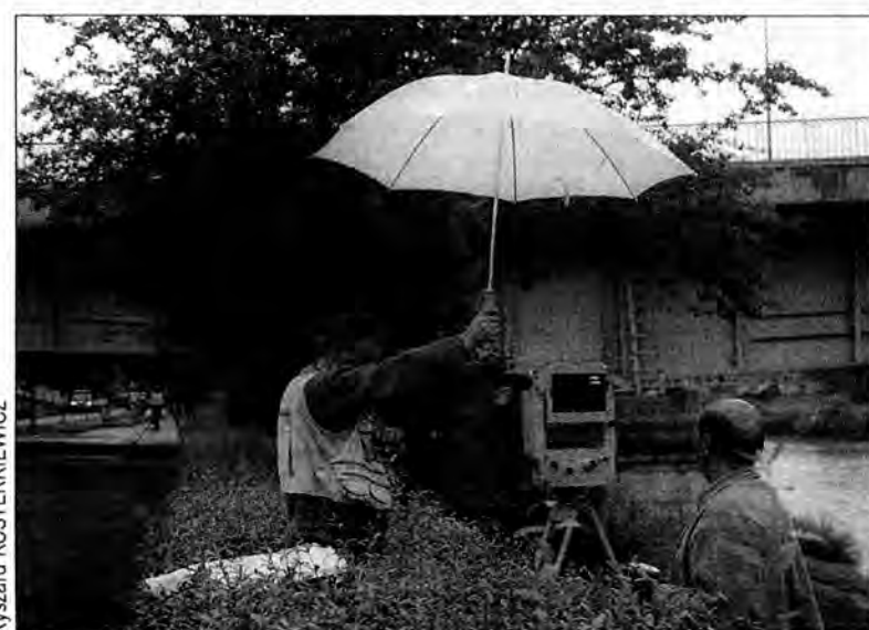
W trakcie badań odkształceń termicznych mostu wykonuje się też zdjęcia specjalnym aparatem, wrażliwym na deszcz.

– Oczywiście przemysłowi mostowi nic nie zagraża. Do badań