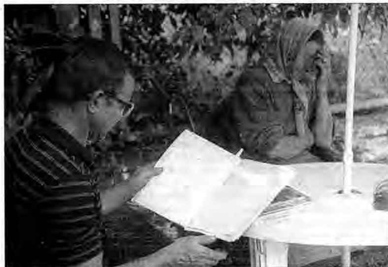
Mimo pory urlopow, chętnych do dyżurowania pod bramą nie brakuje. Wpisują się do specjalnego zeszytu.

Wicewojewoda podkarpacki zwrócił się do władz Przemysła o wznowienie postępowania w sprawie decyzji Prezydenta Przemysła pominął również obowiązujące przepisy o ochronie i kształtowaniu środowiska oraz zapisy planu zagospodarowania przestrzennego.