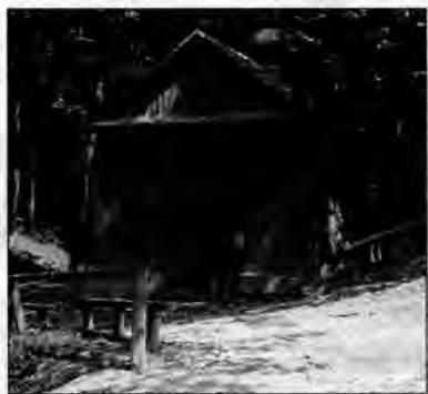
Na polanie przed drewnianą kapliczką 12 czerwca zbierają się tysiące pielgrzymów.

Po minięciu malowniczo położonej wsi Nowiny Horynieckie piaszczysta, polna droga doprowadzi do miejsca, gdzie każdego roku 12 czerwca w wigilię dnia, gdy kościół czci św. Antoniego Padewskiego, zbierają się tysięczne tłumy na odpustowe uroczystości. Zwykle położona w głębokim jarze polanka z drewnianą kapliczką Matki Bożej Niepokalanie Poczętej. To tu – według wierzeń – tak jak kilka wieków