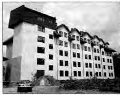
Nowy szpital w Lubaczowie.

Nie ma dotychczas jasności, czy wypłacenie wynagrodzeń kilku pracownikom administracyjnym lubaczowskiego ZOZ za obsługę inwestycji w szpitalu odbyło się zgodnie z prawem. Zespół kontrolny wysłany do podległej powiatowi placówki nie uzyskał dostępu do wszystkich dokumentów niezbędnych do sporządzenia wniosków pokontrolnych. 11 sierpnia zbiera się Społeczna Rada ZOZ, która ma ocenić wszystkie okoliczności sprawy i sformułować opinię dla starosty lubaczowskiego.