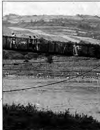
Jacek SZWIC (3)

Tuż koło Dubiecka znajduje się miejscowość Wybrzeże, gdzie są wspaniałe tereny do wypoczynku na świeżym powietrzu. I z tej atrakcji postanowili skorzystać nie tylko mieszkańcy Dubiecka i okolic. Słonecznowodną kąpielą raczyli się również mieszkańcy Rzeszowa, Łańcuta i Sanoka. Nie inaczej było w bardziej znanym Słonnem. Tu też co kilka metrów można było zauważyć namioty, przyczepy kempingowe i grupy rozentuzjuszowanych wycieczkowiczów.