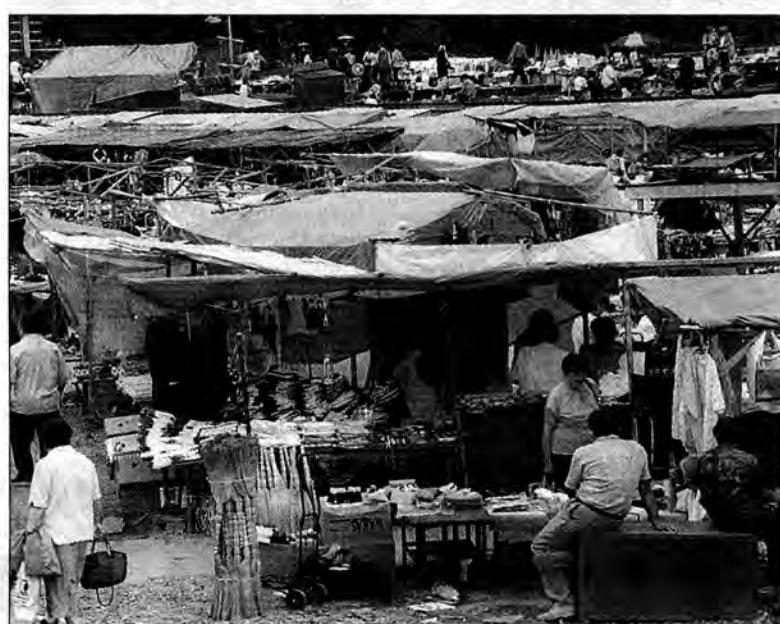
Na osiemset punktów handlowych, znajdujących się na „starym” bazarze, akces do przenosin na „nowy” zgłosiło ponad sześćdziesiąt trzydziestu właścicieli.

Ponad dwa tygodnie temu ruszyły prace remontowo-budowlane na części przemyskiego bazaru przy ul. Sportowej, należącego do MKS „Polonia”.