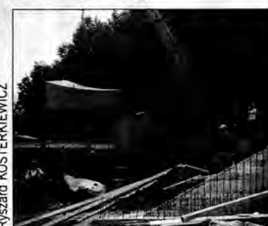
Pierwsza część krzyża dotarła na Zniesienie.

W piątek, 4 sierpnia, z Teczowa k. Gliwic przywiezione zostały pierwsze elementy 25-metrowego krzyża, który wkrótce stanie na przemyskim Zniesieniu. Wielotonowy ładunek podróżował nocą, gdy ruch na drogach jest mniejszy, ale największy problem – ze względu na wymiary – będzie z dostarczeniem podstawy krzyża.