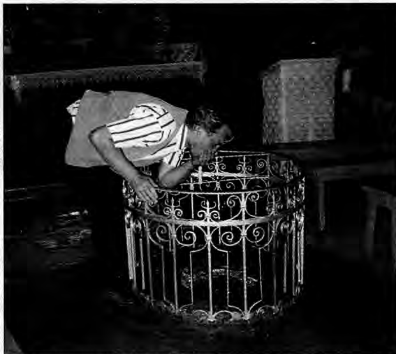
Woda z cudownego źródła przed ołtarzem przywraca jasność widzenia.

Z książką Pawła Włada i Marka Wiśniewskiego Roztocze Wschodnie pod pachą, zamiast wynajętego