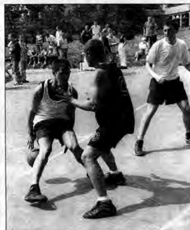
Streetball to okazja do pofantazjowania z piłką.

W grupie I triumfowała ekipa WSP AWF, w II - Jabole, w III - Royal, w IV - Biały Orzeł, w V - A Team,