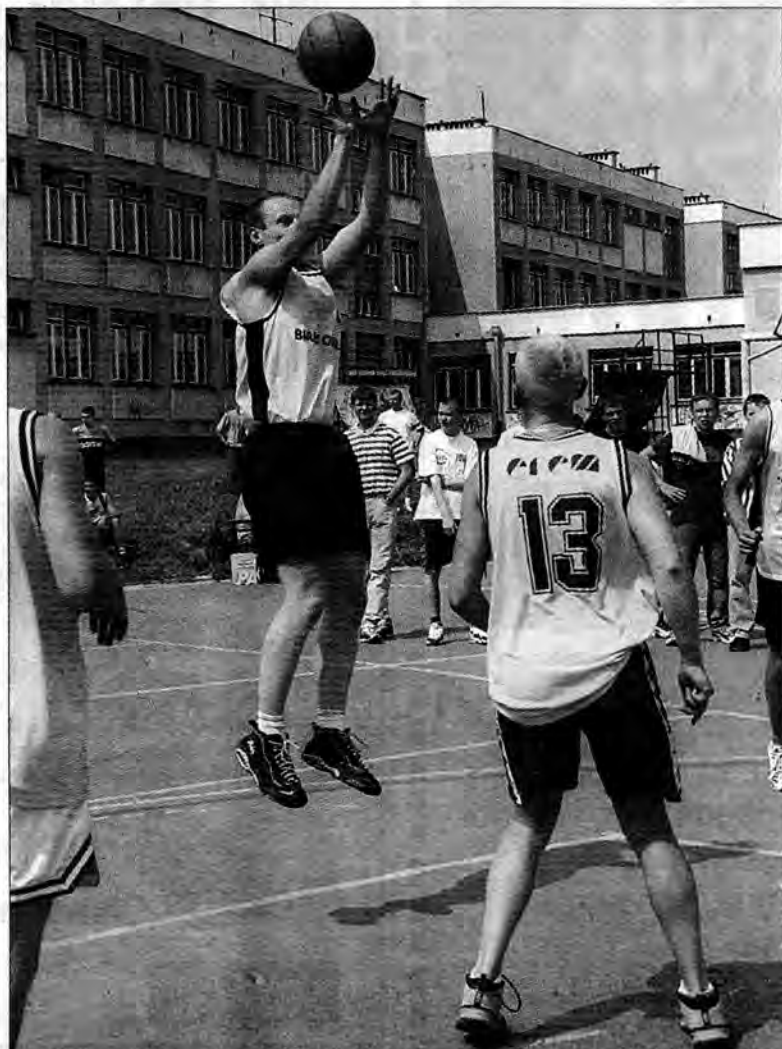
Jednym z ciekawszych pojedynków całych mistrzostw był eliminacyjny mecz Białego Orła z Eremem.

dzielonych zostało na 7 grup 4-zespołowych i 1 grupę 3-zespołową. W rundzie eliminacyjnej rozegrano 46 spotkań grupowych systemem „każdy z każdym”. Awans do ćwierćfinałów uzyskali tylko zwycięzcy poszczegól-