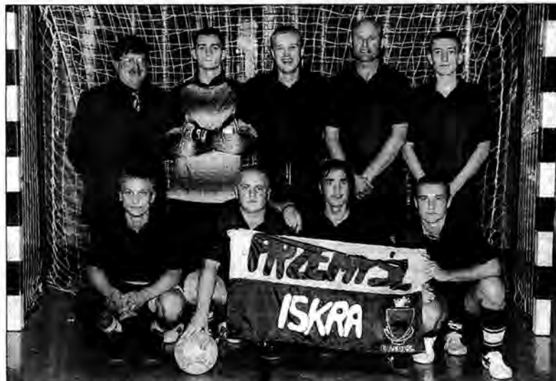
Zwycięska ekipa przemyskiej Iskry w pełnej krasie.

Poszczególne miejsca w turnieju ustalono w bezpośrednich pojedynkach. 7. miejsce zajął Olsztyn po zwycięstwie nad Paderborn 2:0,