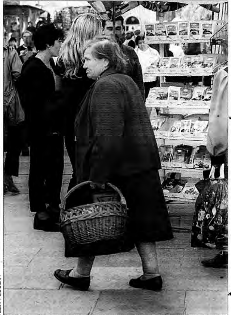
Co włożyć do podkarpackiego koszyka.

Ceny wykupu mieszkań komunalnych najwyższe są w Rzeszowie, gdzie za metr kwadratowy powierzchni płaci się około 1450 zł. W Przemysłu ceny te sięgają 600-1000 zł, ale na uwagę zasługuje fakt, że górna granica i tak jest o 100 zł niższa niż w Przeworsku. Za to w Lubaczowie średnia cena 1m kwadratowego mieszkania sprzedawanego dotychczasowemu najemcy wynosi 350 zł.