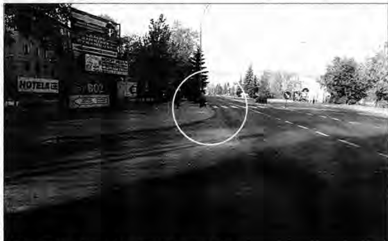
W tym miejscu doszło do potrącenia rowerzystki.