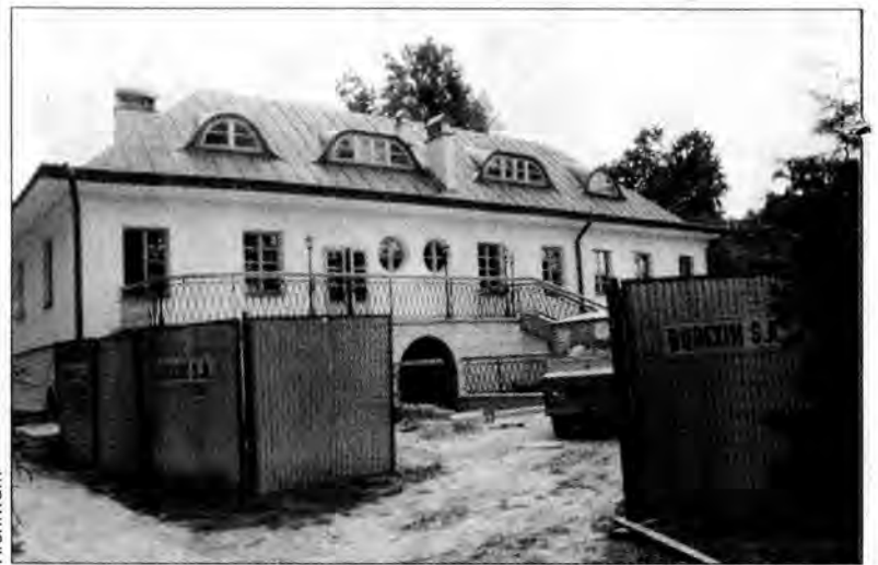
Trwa kolejny etap przywracania świetności zabytkowemu zespołowi pałacowemu w Sieniawie.