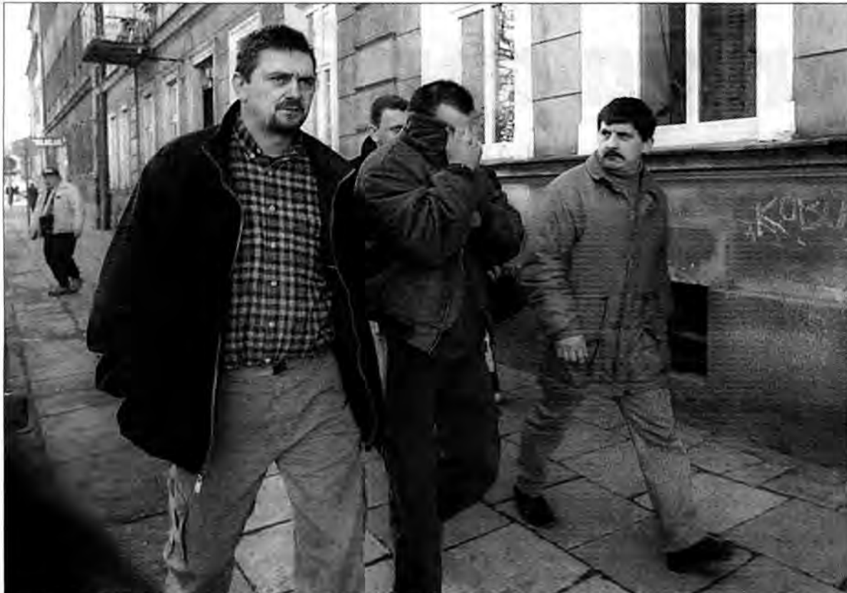
Sprawca kradzieży (z zasłoniętą twarzą) w drodze do prokuratury.

Sto tysięcy złotych to sporo pieniędzy. Taką sumę odnaleźli policjanci z Komendy Powiatowej Policji w Jarosławiu ukrytą pod siedzeniem starego żuka, zaparkowanego na terenie pewnego gospodarstwa w Rokietnicy. Były to pieniądze pochodzące z utargu jednego z jarosławskich domów handlowych, które znikły w tajemniczych okolicznościach w ostatnich dniach stycznia.