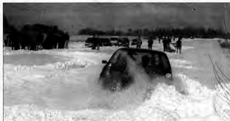
Niejedna załoga miała problemy z utrzymaniem właściwego toru jazdy.