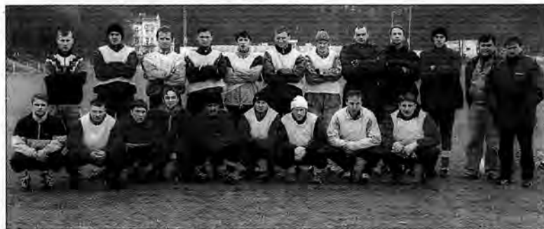
„Przemyska Barcelonka” niemal w komplecie.

W sobotę i niedzielę, 10 i 11 marca, zainaugurują rozgrywki w rundzie wiosennej piłkarze III ligi małopolskiej. Nasz „jedynak” w tej klasie rozgrywkowej – przemyska Polonia – sobotnim, 3 marca, meczem z własnymi rezerwami zakończyła przygotowania do sezonu. W sobotę, 10 marca, o godzinie 14, meczem na własnym boisku z Cracovią rozpoczną rundę wiosenną.