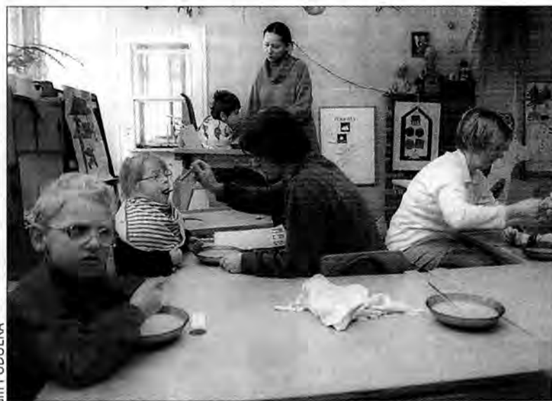
Czy rzeczywiście Przychodnia Rehabilitacyjna dla Dzieci Niepełnosprawnych Psychoruchowo w Przemyślu grozi likwidacją?