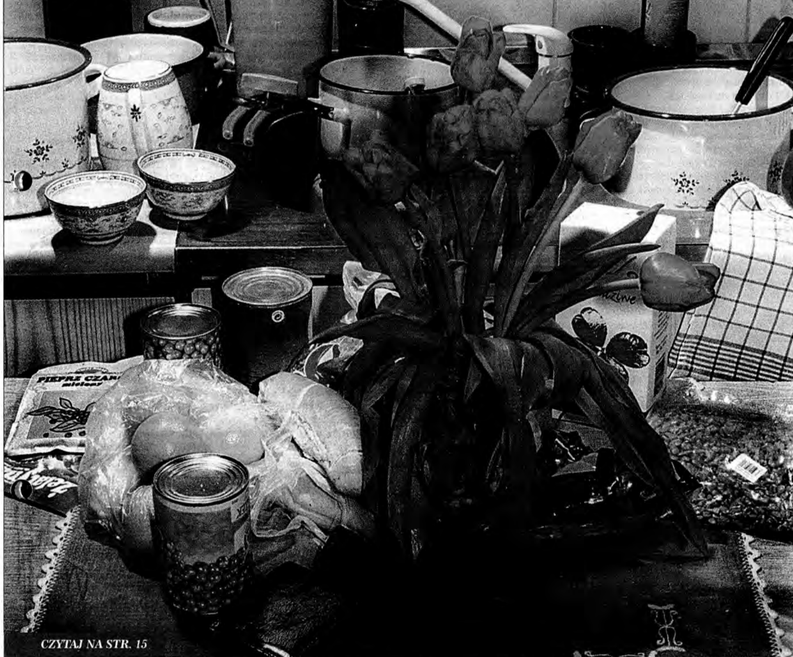
CZYTAJ NA STR. 15