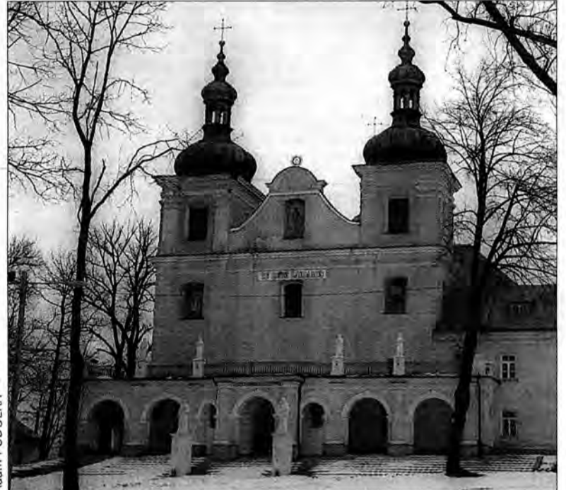
Najpoważniejsze uszkodzenia dotyczą galerii i podcieni wokół kościoła.

Od kilku tygodni w zespole kościelno-klasztornym oo. Franciszkanów w Kalwarii Paćlańskiej trwają prace związane z modernizacją centralnego ogrzewania. Podczas wstępnego planowania prac zauważono – na razie niewielkie – pęknięcia na murach kościoła i klasztoru, które mogą grozić katastrofą budowlaną.