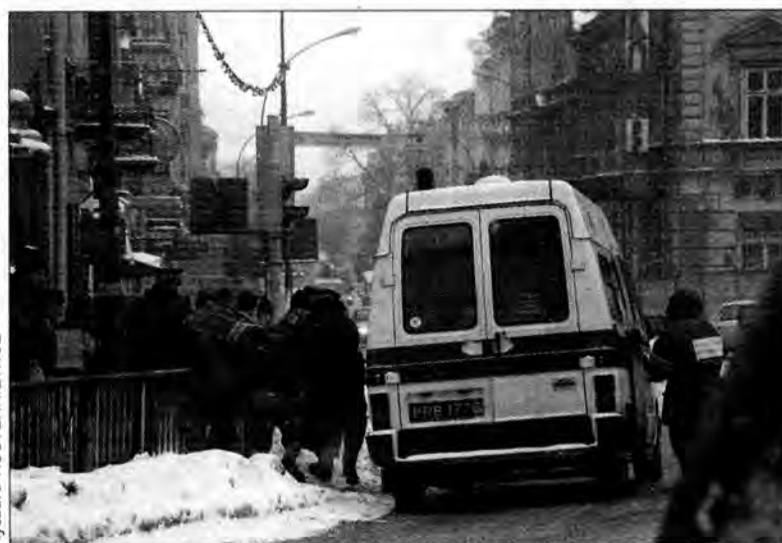
Funkcjonariusze SM nie tylko nakładają mandaty i blokady na koła.

W 2000 roku funkcjonariusze SM w Przemysłu interweniowali ponad 23 tys. 500 razy. Zdecydowana większość tych interwencji kończyła się pouczeniem, ale prawie 8 tys. pociągnięto za sobą konieczność nałożenia mandatów, a blisko 1400 przyniosło wnioski do kolegium do spraw wykroczeń. W ogólnej liczbie mandatów największą część (39 proc.) spowodowały wykroczenia przeciwko przepisom o ruchu drogowym. Natomiast największą liczbę wniosków do kolegium (28 proc.) jako podstawę miało naruszenie ustawy o wychowaniu w trzeźwości. W ciągu całego ubiegłego roku funkcjonariusze prze-