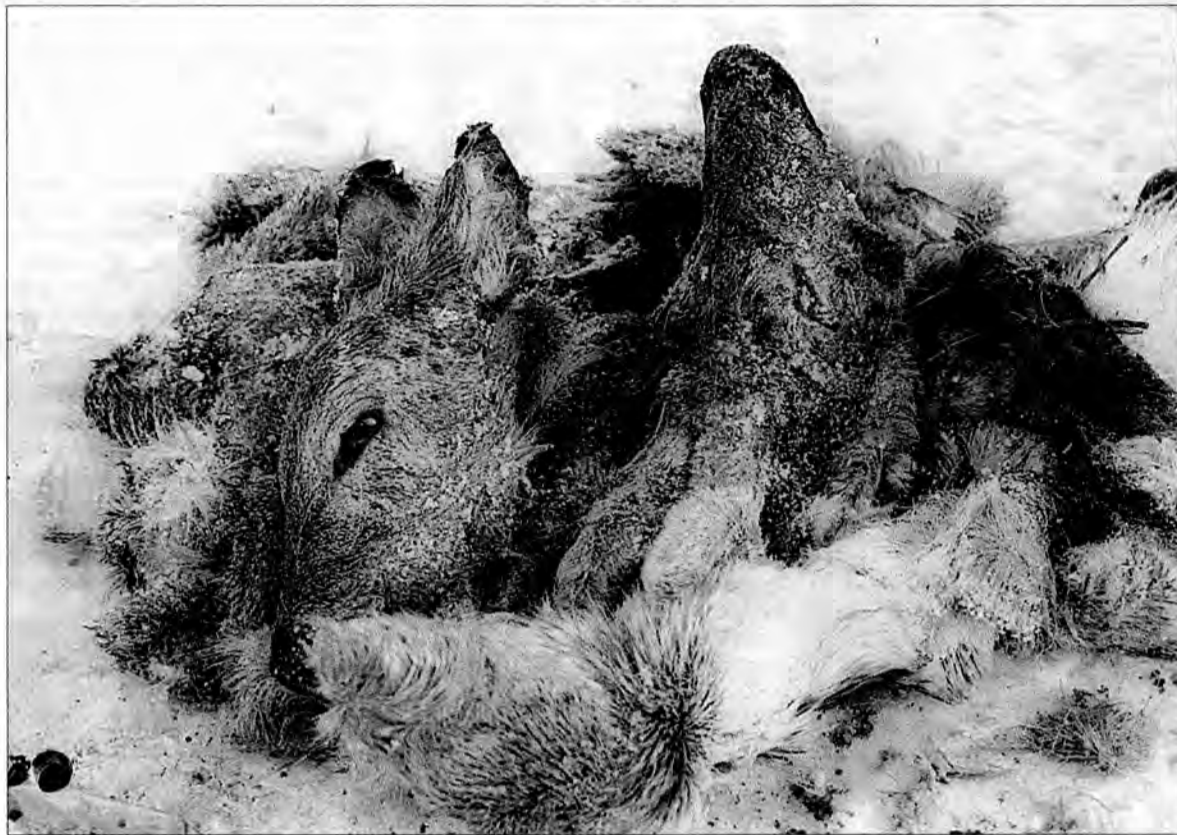
Dowody kłusowniczego okrucieństwa.