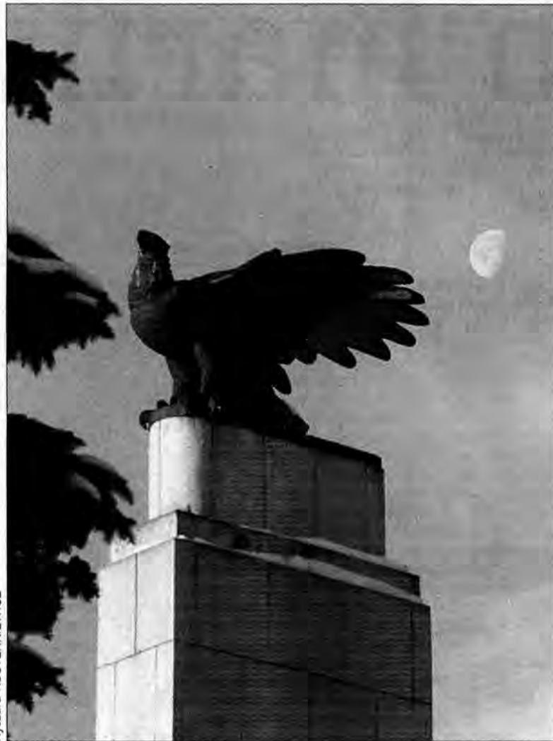
Czyj jest ten kawałek pomnika?

Prezydent rozumie tak: skoro budowanie pomników to zadanie własne gminy, to gmina powinna to zadanie finansować. Jeśli ktoś sfinansował zadanie za gminę, to chcąc nie chcąc trzeba mu pieniądze zwrócić: – Bo inaczej stowarzyszenie nas zaskarży z powodu bezpodstawnego wzbogacenia się! – tłumaczy. – Sprawę komplikuje fakt, że sytuacja nie jest uregulowana pod względem prawnym. Do dziś nie wiadomo, jaką rolę odgrywało stowarzyszenie. Czy było inwestorem zastępczym? Czy było całkowitym wykonawcą robót? Kto ma prawo dysponować pomnikiem: miasto czy stowarzyszenie? Ja nie wiem i z dokumentów to wcale jednoznacznie nie wynika. W tej chwili wiem jedno: formalnie jest to