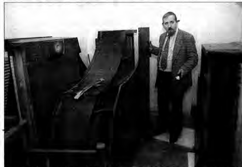
Ekspонат liczy sobie blisko 100 lat i pochodzi z dubieckiego dworku,

26 lutego Muzeum Narodowe Ziemi Przemyskiej wzbogaciło się o niecodzienny zabytek. W tym dniu trafił tu stylowy fortepian z końca XIX wieku, który przez ponad pół wieku przechowywany był w... piwnicach Urzędu Gminy w Dubiecku.