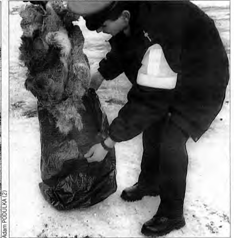
Z kilku saren zostały tylko skóry.