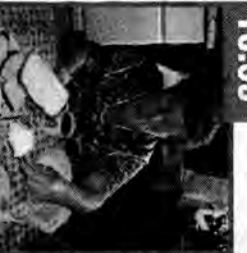
Złote lany: dok.