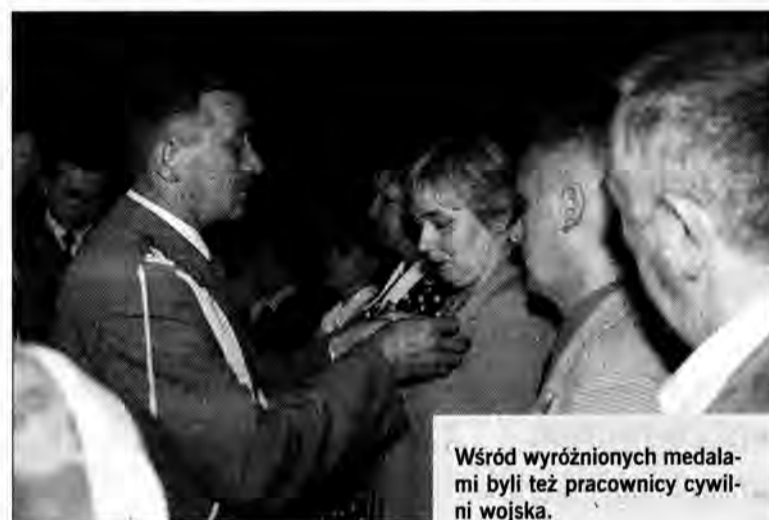
Wśród wyróżnionych medalami byli też pracownicy cywilni wojska.

Odnaczenia, awanse i nagrody są nieodłącznym elementem uroczystości Dnia Wojska Polskiego, obchodzonego 15 sierpnia w rocznicę pamiętnego „cudu nad Wisłą”, czyli zwycięskiej dla polskiego oręża bitwy warszawskiej z roku 1920.