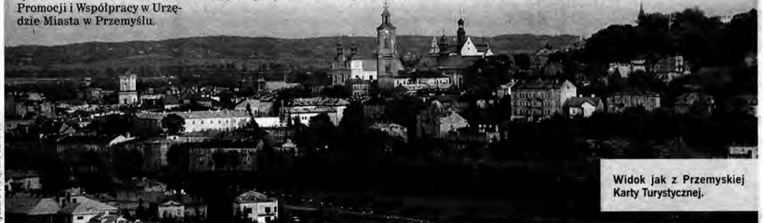
Widok jak z Przemyskiej Karty Turystycznej.

Przemyska Karta Turystyczna ważna jest przez 1 lub 2 dni i kosztuje odpowiednio 12 lub 16 zł. Wystawiana jest na jedną osobę i nie wolno jej odstąpić innym. Nie ma natomiast limitu wiekowego dla posiadacza karty. Kartę kupić można w Centrum Informacji Turystycznej, Wieży Zegarowej, Domu Wycieczkowym PTTK oraz kilku punktach sprzedaży biletów MZK. W tym roku projekt kontynuowany będzie do końca października. (R)