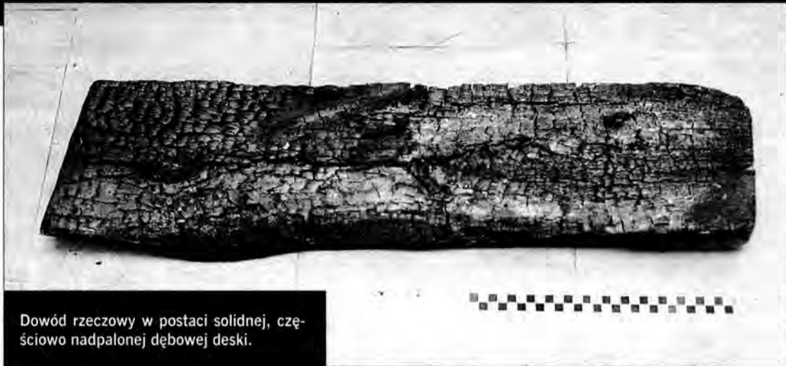
Dowód rzeczowy w postaci solidnej, częściowo nadpalonej dębowej deski.

Gorący lipcowy wieczór; ognisko, kielbaski, jakiś alkohol, grono znajomych. Miało być przyjemnie i rekreacyjnie. Skończyło się tragedią.