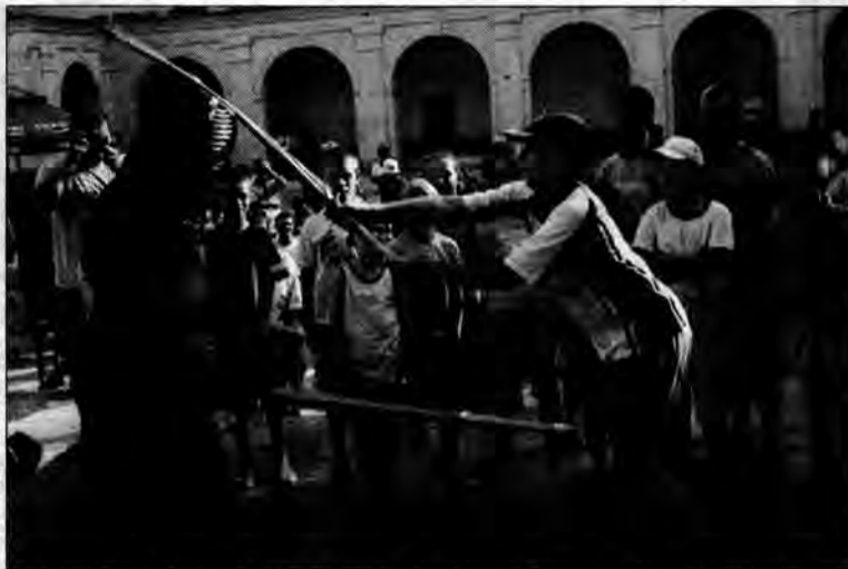
Na dziedzińcu krasicyńskiego zamku chętni mogli sami spróbować szkoły walki - kendo.