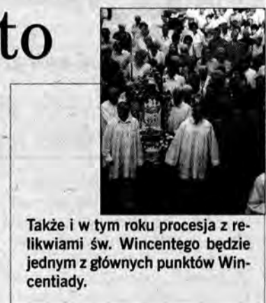
Także i w tym roku procesja z relikwiami św. Wincentego będzie jednym z głównych punktów Wincentiady.