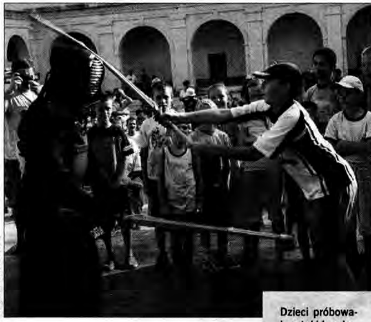
Dzieci próbowały sztuki kendo.

Dyrektor szpitala powiatowego w Lubaczowie pozwał do sądu starostę