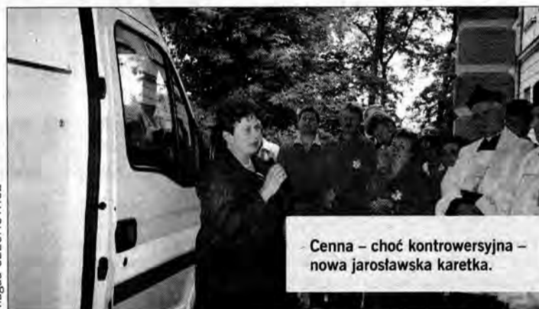
Cenna – choć kontrowersyjna – nowa jarosławska karetka.