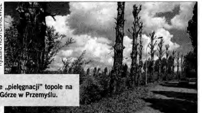
Poddane „pielęgnacji” topole na Winnej Górze w Przemyślu.