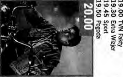
Bezlistony IV: sensacja, USA, 1994