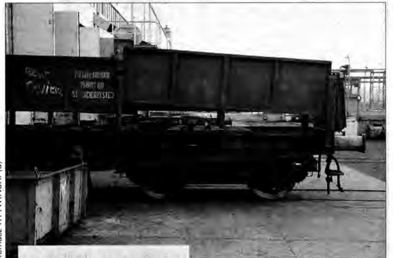
Już niedługo, bo 8 września przypada 20-lecie zakładu. Zarówno pracownicy jak i zarząd spółki mają nadzieję, że będzie co świętować.