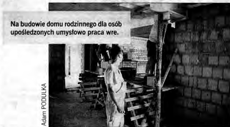
Na budowie domu rodzinnego dla osób upośledzonych umysłowo praca wre.

Pierwsze pieniądze – 350 tys. zł – które pozwoliły na zamknięcie stanu surowego budynku, jarosław-