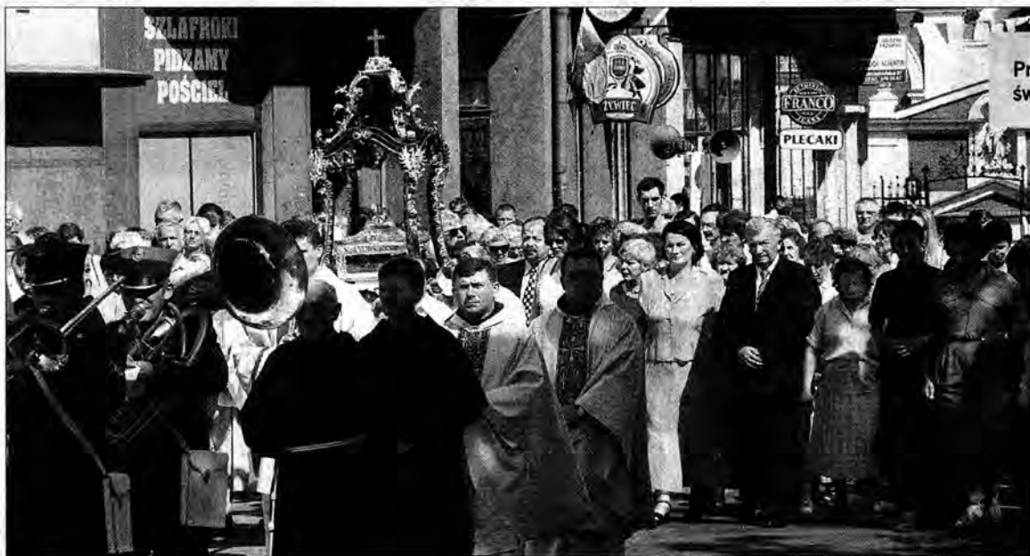
Procesja ulicami miasta z relikwiami św. Wincentego.

W latach 1655 – 1660 Polska przeżywała tragiczny okres „potopu”, czyli najazdu obcych wojsk. W lutym od południa w granice Polski wkroczył sojusznik Szwedów, książę siedmiogrodzki Grzegorz II Rakoczy. Jego wojska podeszły pod Przemyśl, ale po otrzymaniu znacznego okupu pozostawiły gród w spokoju. W tym czasie wojska Rakoczego zostały odcięte od zaopatrzenia. Dowódca, upatrując w tym udział przemyslan, wydał rozkaz generałowi Janowi Kemeny, by ten udał się do Przemyśla, zajął miasto, wyciął w pień wszystkich mężczyzn i zabrał tyle dobra, ile zdo-