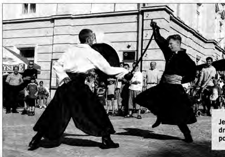
Jedną z atrakcji obchodów dni patrona Przemyśla były pokazy walk rycerskich.