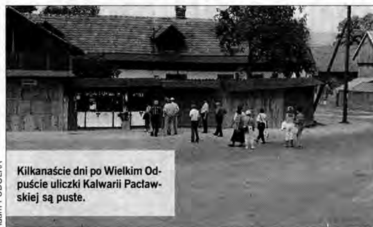
Kilkanaście dni po Wielkim Odpuszcie uliczki Kalwarii Pałacowskiej są puste.

szpilkę, panuje cisza. Czynne są dwa kramy z dewocjonaliami i dwa sklepy spożywczo-przemysłowe. Miejscowi nie chcą za bardzo opowiadać o drugiej stronie Wielkiego Odpustu. O domniemanych kokosowych interesach, które można zrobić na rzeszach pątników. To mit. Sprzedawczyni w jednym ze sklepów mówi, że największy interes można zrobić wówczas na napażach, pieczywie i nabiale. Na niczym więcej. Jest małomówna, dając do zrozumienia, że najlepiej byłoby, gdybyśmy już sobie poszli. Właścicielka drugiego sklepu zapewnia, że z pielgrzymów można utrzymać się najwyżej przez dwa, trzy miesiące: - O tym, jaki to jest kokosowy interes, najlepiej świadczy fakt, że bardzo rzadko się spotyka handlujących, którzy dwa razy pod rząd odwiedzają Kalwarię podczas odpustu. Przyjadą w jednym roku i na drugi już nie przyjeżdżają. Kilka lat temu jeden gość wynajął kilkanaście straganów, chcąc zrobić interes na sprzedaży wędlin i mięsa. Taki zrobił, że potem miał wielomiesięczne kłopoty z wypłaceniem pieniędzy zatrudnionym ludziom.