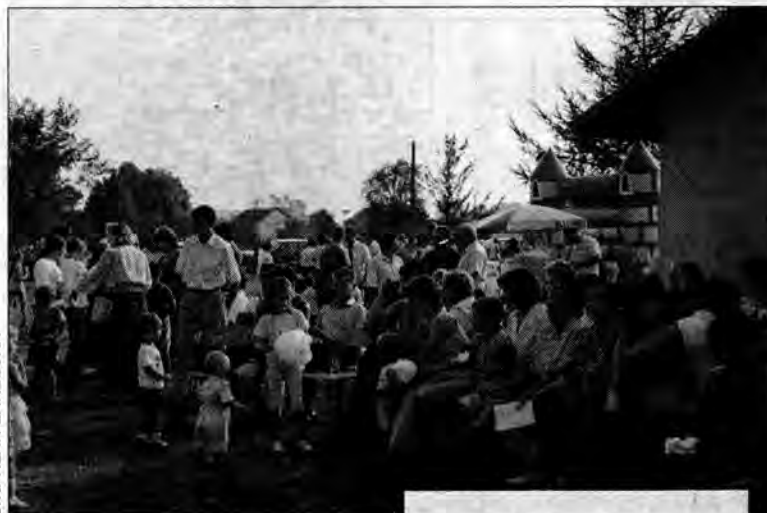
Mieszkańcy i czasowicze bawili się do późnego wieczora.

Z tej okazji w parafialnym kościele pw. Matki Bożej Pocieszenia odbyła się uroczysta Msza św. pod przewodnictwem abp. Józefa Michalika. Po Mszy św. przez miejscowość przeszła parada mieszkańców wioski i zaproszonych gości, której towarzyszyła orkiestra dęta OSP w Sieniawie oraz Straż Grobowa. Na miejscu byłej plebanii nad Lubaczówką odbył się festyn dla mieszkańców. Organizatorzy tego festynu (właściciele firmy Kipczak & Paszko) przygotowali dla jego uczestników wiele atrakcji, m.in.: występy artystyczne dzieci i młodzieży, orkiestry dętej, Kapeli Ludowej Siko-