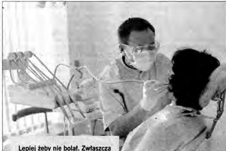
Lepiej żeby nie bolał. Zwłaszcza w niedzielę w Przemyśle.

- Kiedyś gabinet stomatologiczny w przemyskim pogotowiu był. Ludzie zgłaszali się do nas w ostateczności, więc dentysta, pełniący dyżury, zajmował się głównie usuwaniem zębów.