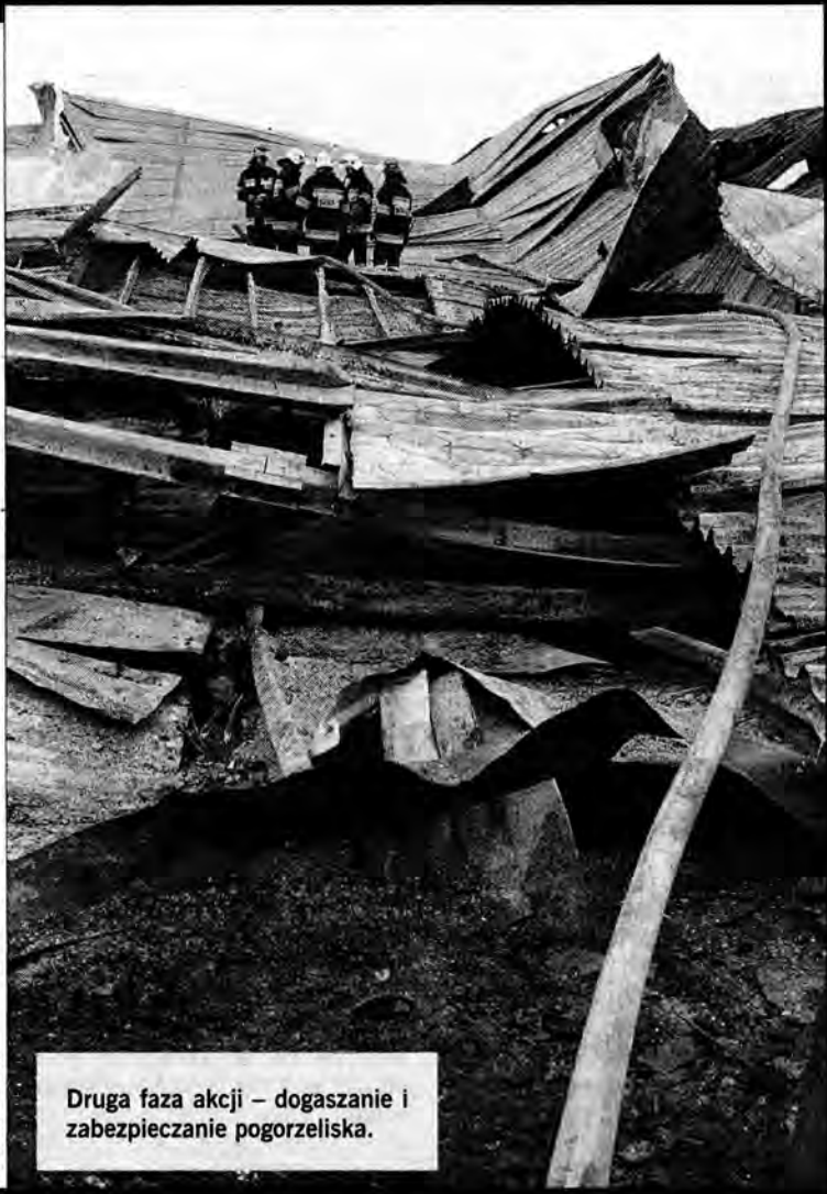
Druga faza akcji – dogaszanie i zabezpieczanie pogorzeliiska.

Wiadomo już, że obiekt był dozorowany i miał zainstalowaną instalację antywłamaniową, natomiast nie posiadał instalacji przeciwpożarowej. Wewnątrz znajdowały się meble włoskie i hiszpańskie oraz wyposażenie kuchni sprowadzane na zamówienie ze Stanów Zjednoczonych. Wszystko doszczętnie spłonęło. Przedstawiciel warszawskiej firmy „Felix”, do której należał skład celny, straty oszacował wstępnie na 5 – 7 milionów złotych.