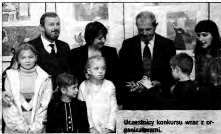
Uczestnicy konkursu wraz z organizatorami.

Ponad sto prac plastycznych trafiło na konkurs zorganizowany przez Młodzieżowy Dom Kultury w Przemyślu oraz Polski Związek Hodowców Gołębi Pocztowych Zarząd Okręgu w Rzeszowie.