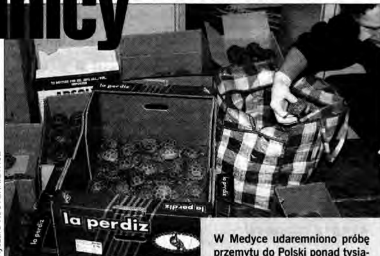
W Medyce udaremniło próbę przemytu do Polski ponad tysiąca żółwi.

wanych w plastikowe pojemniki oraz płócienne woreczki, węży. Zdaniem celnika, który natrafił na osobliwy zwierzyniec, niektóre z węży należą do gatunków jadowitych.