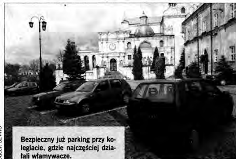
Bezpieczny już parking przy kościele, gdzie najczęściej działali włamywacze.

Po dwóch i pół miesiącach działalności w ręce (dosłownie) jarosławskich policjantów wpadli dwaj młodzi mieszkańcy tego miasta, którzy w każdą niedzielę włamywali się do samochodów, stojących na przykościelnych parkingach.