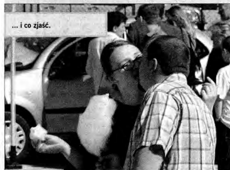
... i co zjeść.