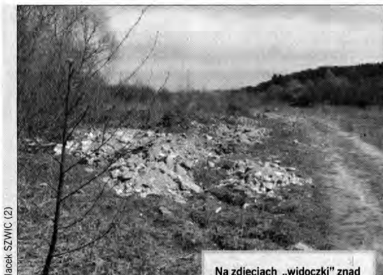
Na zdjęciach „widoczki” znad Wiaru.