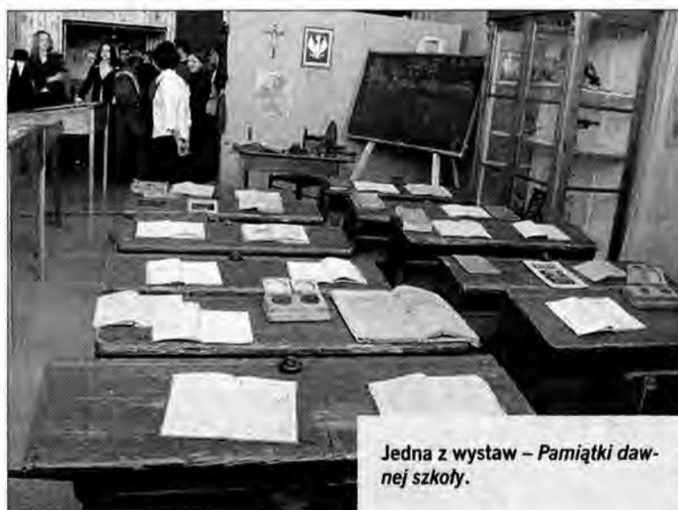
Jedna z wystaw – Pamiątki dawnej szkoły.