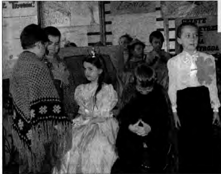
O tym, jak zła macocha chciała zniszczyć środowisko, mówiła scenka przygotowana przez uczniów kl. IIc.

Dzień Ziemi, przypadający na 22 kwietnia, jest okazją, by podzielić się swoim dorobkiem z innymi. Tak naprawdę, dzieci ze Szkoły Podstawowej nr 11 w Jarosławiu dbają o swoje środowisko przez cały rok.