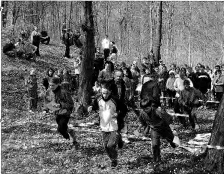
Start do biegu na Lipowicy.

III PUCHAR PODKARPACIA W BIEGACH NA ORIENTACJĘ