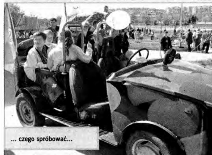
... czego spróbować...

Organizatorami „Jarmarku” byli: hotel i OST „Gromada” oraz Urząd Miasta Przemyśla. (R)