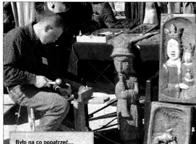
Było na co popatrzeć...