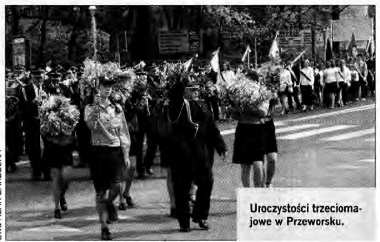
Uroczystości trzecimajowe w Przeworsku.