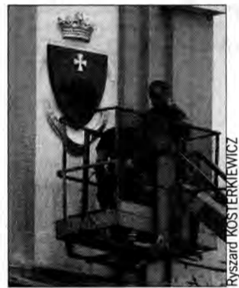
Nowy miś na urządzie.

Wprowadzanie nowego miś ma taki sam kształt jak poprzedni i idzie w tym samym co poprzedni kierunku, czyli na zachód, to jednak wygląda zupełnie inaczej. Nowym złotem lśni też herbowa korona. Jak dowiedzieliśmy się w Biurze Prezydenta Miasta, zmiana herbu podyktowana była jego kiepskim stanem i mało godnym wyglądem. (R)