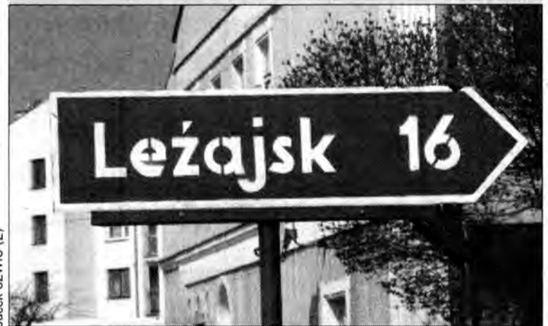
Jacek SZWIC (2)