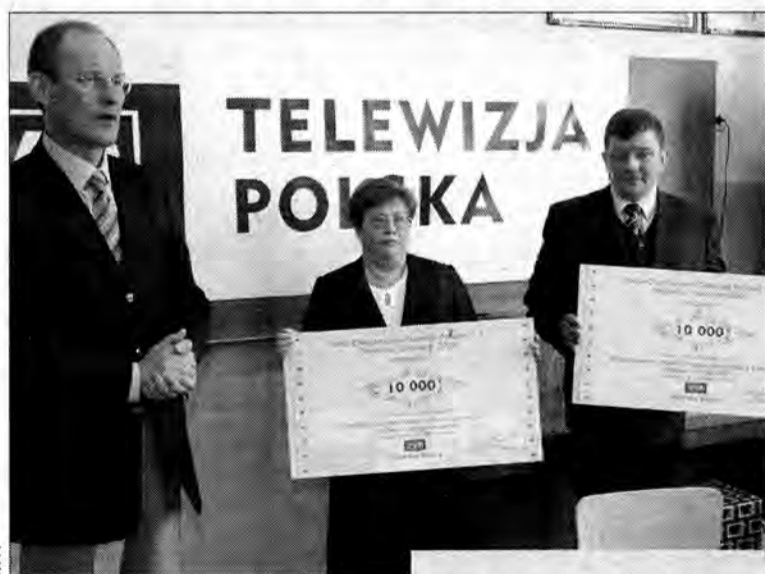
Symboliczne czeki na 10 tys. zł szefostwu przemyskich placówek wręczył prezes TVP S.A. Robert Kwiatkowski.

Ze wspomnianej kwoty województwo podkarpackie otrzyma łącznie ponad 130 tys. zł. Z tej puli po 10 tys. zł darowizny przypadło m.in.: Specjalnemu Ośrodkowi Szkolno-Wychowawczemu nr 1 w Przemyślu i przemyskiemu oddziałowi Polskiego Towarzystwa Walki z Kalectwem. 29 kwietnia do