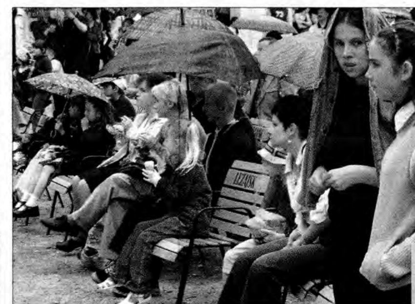
Widzowie starali się towarzyszyć wykonawcom do ostatniej kropli deszczu.

O samym festynie można by jeszcze wiele napisać, bo różnego rodzaju atrakcji nie brakowało. Szkoda tylko, że pogoda spłatała organizatorom przykrego psikus. (R)