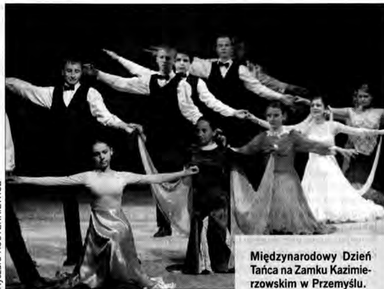
Międzynarodowy Dzień Tańca na Zamku Kazimierzowskim w Przemyślu.