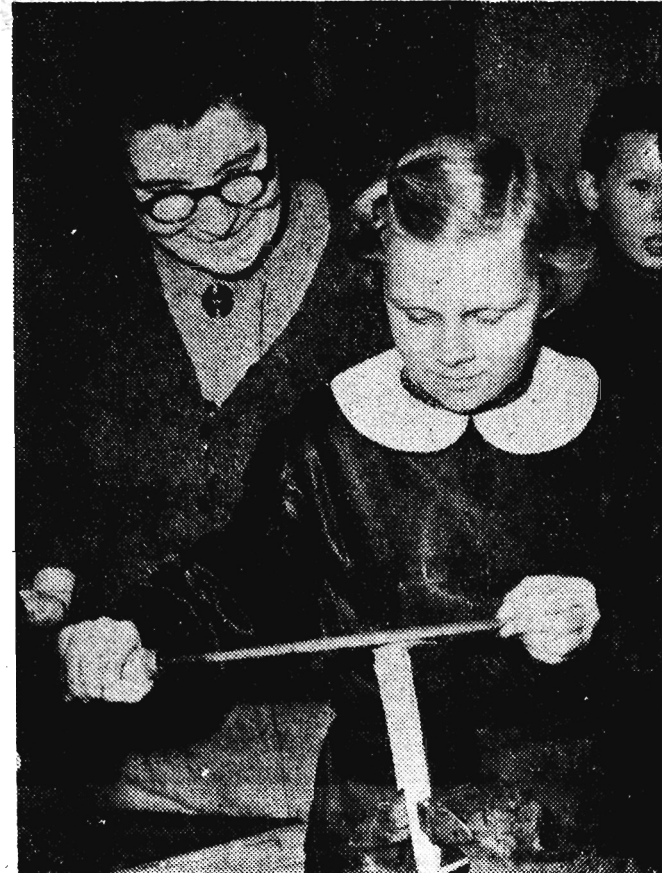
Może pilnik to nietypowe narzędzie dla dziewczynki, ale jak wykazuje życie umiejętność postugiwania się nim, często się przydaje. Naukę trzeba jednak rozpocząć już w szkole podstawowej.