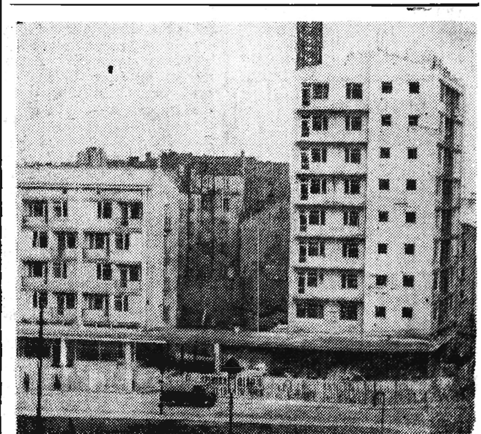
W Warszawie na Powiślu, w rejonie ulicy Radnej budowane jest niewielkie osiedle mieszkaniowe. Oddano tu w gotowych już budynkach 400 izb mieszkalnych, a w budowie są domy, które dadzą około 360 izb.

podniósł ręce do góry i pozwolił się aresztować. Huk, który złodziej wziął za odgłos wystrzału, został spowodowany przez odrzutowiec, który na zbyt małej wysokości przekroczył barierę dźwięku. Policjant, który aresztował bandytę, należał do kompanii ruchu i nawet nie wiedział o dokonanej rabunku.