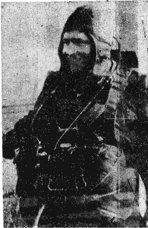
Na zdjęciu: Major Herman Titow w kombinie z nieznane pilota.

Korespondent „Izwestii” pisze, że uśmiech jest chyba obowiązkową cechą radzieckich kosmonautów.