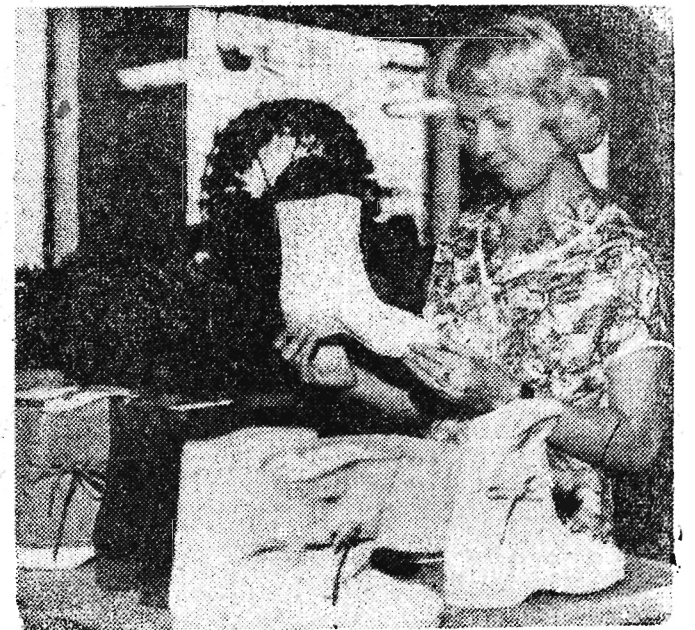
Radomskie Zakłady Obuwnicze wykonały już partię obuwia na eksport.

Podczas audiencji obecny był minister spraw zagranicznych Adam Rapacki.