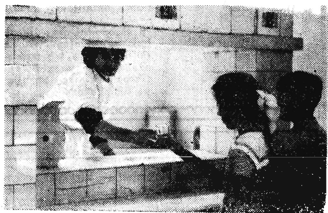
Proszę szklaneczkę wody zdrojowej! Po chwili mali pacjenci pili syczący krystaliczną wodę, wsak do dla poprawy zdrowia. Rymanów - Zdrój jest uzdrowiskiem dla dzieci. W sezonie pełno tu małych kuracjuszy.