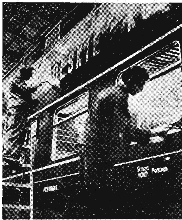
Fabryka Wagonów w Goerlitz (NRD) wykonuje obecnie duże zamówienie eksportowe, dostarczając piętrowe wagony dla Polski i CSRS. Stalowe blachy na wewnętrzne wyposażenie wagonów oraz na dachy dostarcza Związek Radziecki. Zaloga fabryki podjęła zobowiązanie produkowania 10 wagonów piętrowych tygodniowo. Na zdjęciu: Malowanie napisów na piętrowych wagonach przeznaczonych dla Polski.