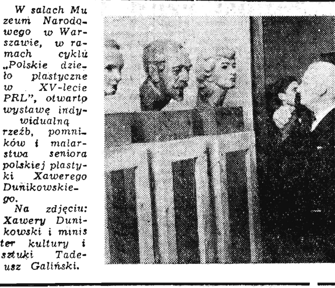
W salach Muzeum Narodowego w Warszawie, w ramach cyklu „Polskie dzieło plastyczne w XV-lecie PRL”, otwarto wystawę indywidualną rzeźb, pomników i malarstwa seniora polskiej plastyki Xawerego Dunikowskiego. Na zdjęciu: Xawery Dunikowski i minister kultury i sztuki Tadeusz Galiński.

Zarząd Wojewódzki ZMW w Rzeszowie wydaje z okazji zbliżającej się XX rocznicy powstania Polskiej Partii Robotniczej materiały literacko-artystyczne, przeznaczone dla organizatorów wieczorów świetlicowych w kołach ZMW. Wydawnictwo to — pt. „Pieśń o partii” — zawiera zbiór wierszy, pieśni i wyjątków prozy autorów polskich, m. in. Władysława Broniewskiego, Wandy Wasilewskiej i Leona Pasternaka. Wydawnictwo składa się z trzech oddzielnych montażów świetlicowych i zaopatrzone jest w wyczerpujące wskazówki metodyczne, podane w przystępnej formie. Z materiałów tych niewątpliwie skorzysta wiele kół ZMW przy organizowaniu uroczystości związanych z obchodem XX rocznicy powstania PPR. Całość opracował Władysław Chłodziński. (j.w.)