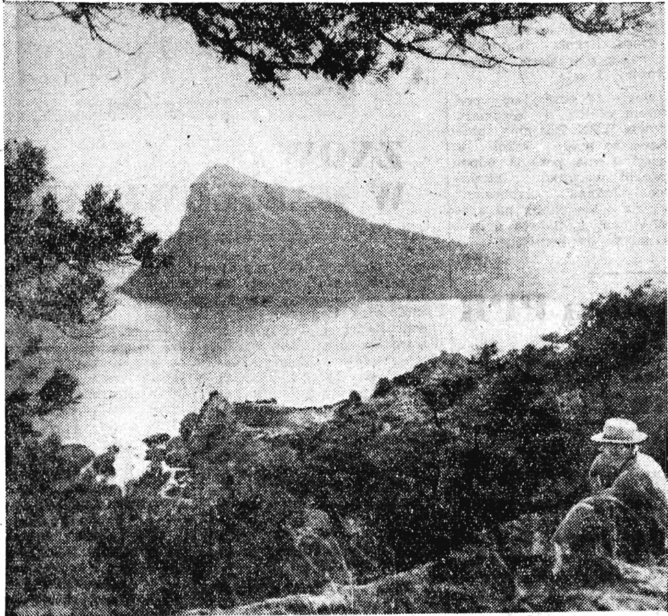
Typowy krajobraz południowego Krymu.