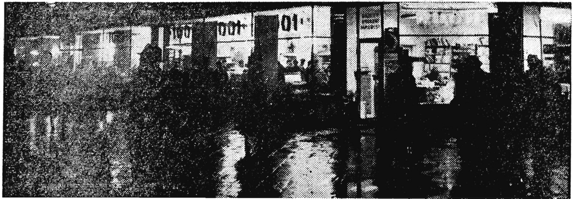
W deszczowy, listopadowy wieczór.

W Nienadówce w pow. kolbuszowskim, z nieustalonych bliżej przyczyn spłonęła stodoła, należąca do ob. Franciszka Nowaka. Straty wyniosły około 10 tys. zł.