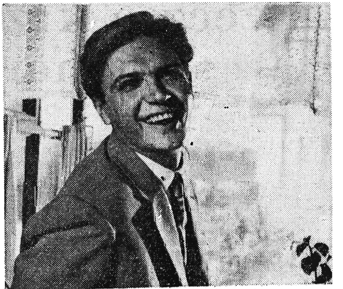
„SAMOLOT ODLATUJE O 9.00” Na ekrany naszych kin wszedł nowy film panoramiczny produkcji ZSRR pt. „Samolot odlatuje o 9.00”.

nastąpi również przekazanie do użytku całkowicie przebudowanego dworca.