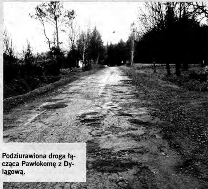
Podziurawiona droga łącząca Pawłokomę z Dylągową.