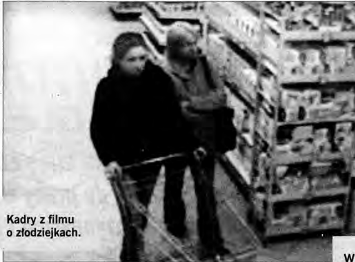
Kadry z filmu o złodziejkach.

Film, o którym mowa, został zarejestrowany przez trzy kamery, pomiędzy godziną dziesiątą a jedenastą we wtorek dziewiątego listopada. Ujęcie pierwsze pokazuje wolną przestrzeń pomiędzy regałami z towarami w jakimś marketcie. W tej przestrzeni pojawia się dziewczyna z plecakiem i wózkem na towary. Po kilku sekundach, za nią zjawiają się dwie dziewczyny. Są jednakowego wzrostu i tak na oko mogą mieć po dziewiętnaście, dwadzieścia lat. Jedna to blondynka ubrana w ciemne spodnie i popielatą kurtkę z kapiszonem. Na ramieniu ma torbę, chyba ciemnowisniową. Druga – szatynka w ciemnej kurtce, pcha pustą wózek na towary. Obie idą wolno i w naturalny sposób rozglądają się. Ta z plecakiem