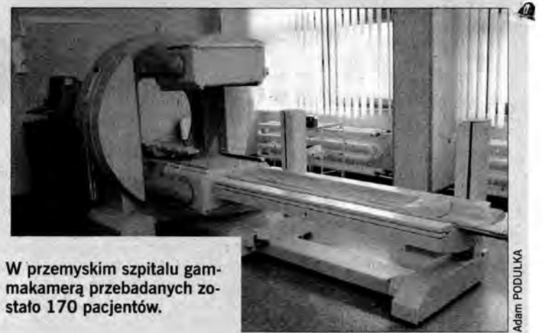
W przemyskim szpitalu gammakamerą przebadanych zostało 170 pacjentów.

– Doszło do jakiegoś koszmarnego nieporozumienia, prawdopodobnie NFZ przeanalizował tylko jedną z bardzo wąskich dzie-