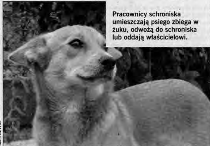
Pracownicy schroniska umieszczają psiego zbiega w żuku, odwożą do schroniska lub oddają właścicielowi.

Jak często zdarza nam się bać groźnego psa, w dodatku bez kagańca, bezkarnie biegającego po ulicy, osiedlu czy nawet placu zabaw. Mamy zabierając przerażone dzieci do domu, nie zawsze wiedząc o tym, że można zawiadomić straż miejską lub schronisko w Orzechowcach.