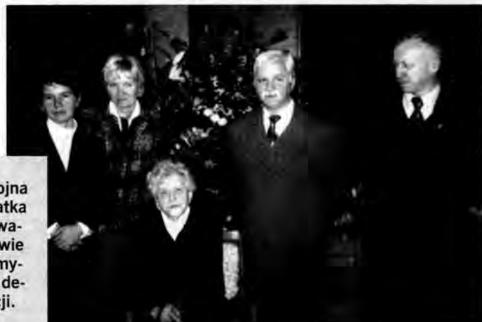
Dostojna jubilatka w towarzystwie przemyskiej delegacji.