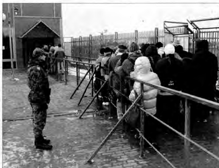
Przed pawilonem odpraw nie ma wielkiego tłumu.

Pieszce przejście graniczne w Medyce. W osławionym „lejk” prowadzącym do pawilonu odpraw prawie pusto. Nikt się nie tłoczy, nikogo nie tratuja, nie musi interweniować pluton specjalny SG.