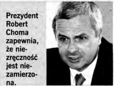
Prezydent Robert Choma zapewnia, że niezręczność jest niezamierzona.

– Myślę, że nie należy wysyłać takich pism do ludzi czy instytucji zależnych w jakikolwiek sposób od władz – mówi najemca miejskiego lokalu. – Zamiast doszukiwać się podtekstów, należałoby się zastanowić, czy zebrana kwota wystarczy, żeby temu dziecku sensownie pomóc? – tłumaczy prezydent.