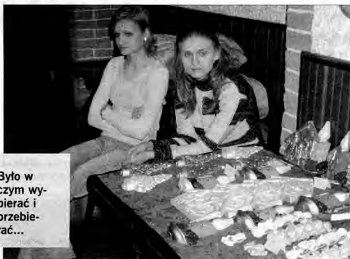
Było w czym wybierać i przebierać...

Jarmarki w Klubie „Piwnice” mają swój specyficzny klimat. Tym razem swoje wyroby zaprezentowało szesnastu wystawców z terenu Podkarpacia. Byli twórcy m.in. z: Przemysła, Bachórcza, Nielepkowic, Ruszelczyc, a nawet z Rzeszowa. Podczas Jarmarku można było nabyć różnego rodzaju ozdoby świąteczne, stroiki, figurki, serwetki itp. Atrakcją był też występ zespołu ludowego „Wiktoriańki” z Ruszelczyc, który za-