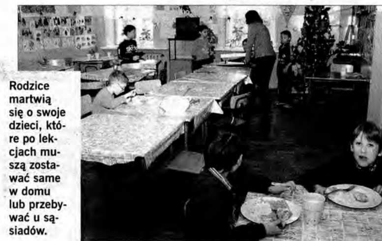
Rodzice martwią się o swoje dzieci, które po lekcjach muszą zostać same w domu lub przebywać u sąsiadów.

W szkołach wiejskich w gminie Przemyśl nie ma świetlic, w których dzieci mogłyby po lekcjach poczekać na rodziców. Te, co były, zostały zlikwidowane decyzją rady gminy poprzedniej kadencji.