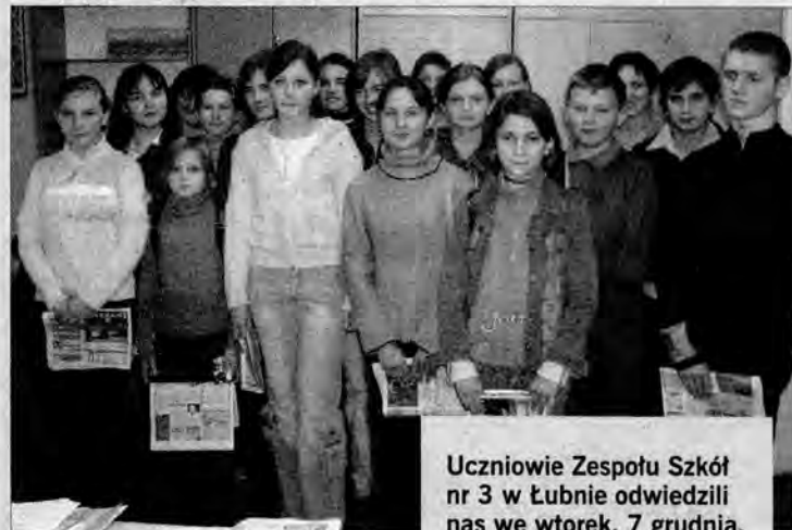
Uczniowie Zespołu Szkół nr 3 w Lubnie odwiedzili nas we wtorek, 7 grudnia.

Liczna reprezentacja z Zespołu Szkół w Lubnie przyjechała do redakcji, bo uczniowie tej placówki sami także wydają gazetkę Szkołnik i chcieli zobaczyć, jak wygląda praca nad prawdziwą gazetą. A że wizyta miała miejsce dzień przed ukazaniem się naszego tygodnika w kioskach, dzieciaki miały okazję przyjrzeć się pośpiesznie zabiegom, jakim poddawane są redakcyjne teksty tuż przed wysłaniem ostatnich stron ŻP do drukarni. Gorączkowa wtorkowa atmosfera panująca w redakcji chyba spodobała się młodym adeptom sztuki dzien-