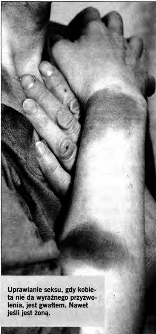
Uprawianie seksu, gdy kobieta nie da wyraźnego przyzwolenia, jest gwałtem. Nawet jeśli jest żoną.