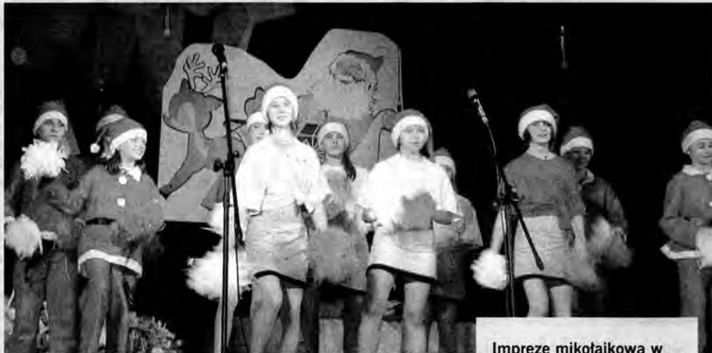
Imprezę mikołajkową w jarosławskim MOK rozpoczęła część artystyczna.

W Hali Sportowej w Żurawicy już drugi rok z rzędu organizo-