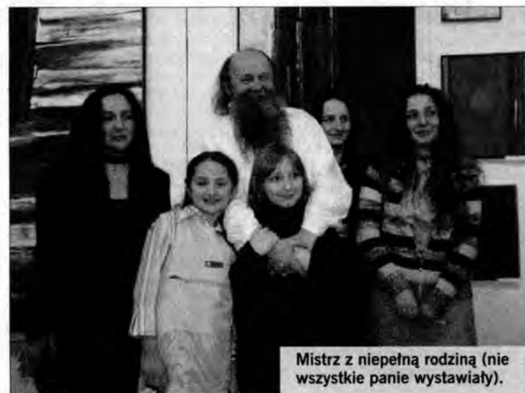
Mistrz z niepełną rodziną (nie wszystkie panie wystawiały).