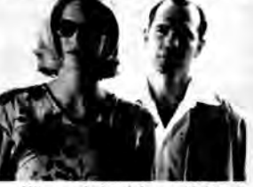
Hit na sobotę: Jak ugryźć 10 milionów - komedia kryminalna, USA 2000, reż. Jonathan Lynn.