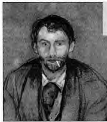
Stanisław Przybyszewski wg obrazu Edwarda Muncha.

nice kart do gry . O dziwo, sala była pełna, co nie było zjawiskiem dość powszechnym, zwłaszcza że miejscowe gazety nie zadbały o nadanie rozgłosu tej niecodziennej wizycie. Nie wiadomo, co przyciągnęło publiczność do sali: czy nietypowy temat, czy osoba mówcy, który tym razem zachowywał się jak przystało na „chodzący zabYTEK” minionej epoki. Był kulturalny, miły, czarował swoim urokiem i wiedzą na nie tak rzadki wśród poetów temat. Przybyszewski zresztą przybył do Przemysłu w konkretnym celu. Zebrał datki na utworzenie wzorcowego gimnazjum państwowego w Brzuchowicach pod Lwowem. W realizację pomysłu zaangażowali się czołowi przedstawiciele ówczesnego świata kultury, nauki, sztuki i polityki. Idea powstała rok wcześniej, z okazji 250-lecia powołania Komisji Edukacji Narodowej, miała na celu wybudowanie szkoły kształcącej według