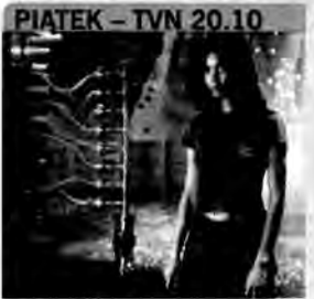
PIATEK - TVN 20.10 Superkino: Mission: Impossible II - film sensacyjny, USA 2000, reż. John Woo. Agent rządowy Ethan Hunt otrzymuje zadanie zneutralizacji tajemniczej substancji skradzionej przez zaleźnia. Po skompletowaniu załogi wyrusza do akcji, której pierwszym etapem jest Hiszpania.