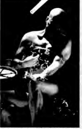
Dwanaście małp - film SF, USA 1995, reż. Terry Gilliam. Rok 2035. Ziemię opanował śmiertelny wirus, który doprowadził do zagłady ludzkości. Więzień James Cole, w zamian za obietnicę skrócenia kary, powraca do roku 1996, by zapobiec tragedii.