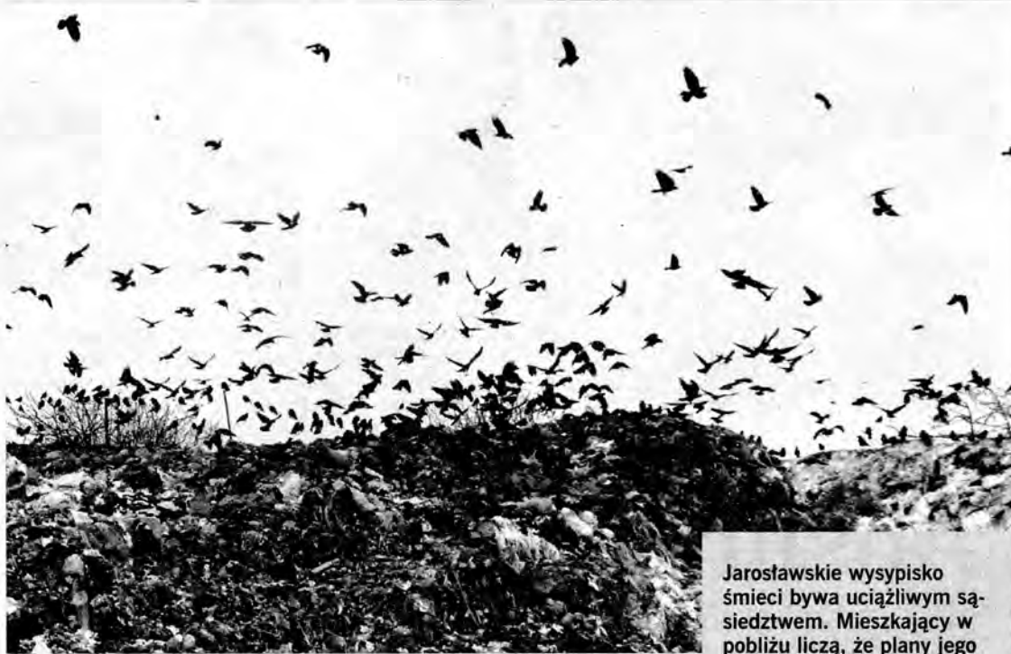
Jarosławskie wysypisko śmieci bywa uciążliwym sąsiedztwem. Mieszkający w pobliżu liczą, że plany jego rozbudowy nie dojdą do skutku.

Radni naciskają na burmistrza, by jak najszybciej rozwiązać kwestię wysypiska, starosta proponuje interesy z Chińczykami, a mieszkańcy protestują, bo nie chcą ani jednego, ani drugiego.