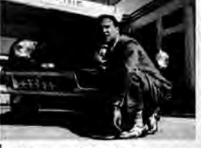
Tucker - konstruktor marzeń - film obyczajowy, USA 1988, reż. Francis Ford Coppola. Znany konstruktor samochodów, Preston Tucker, zaprojektował po wojnie „samochód przyszłości”. Jego nowatorskie pomysły wywołały falę sprzeciwu w koncernach samochodowych.