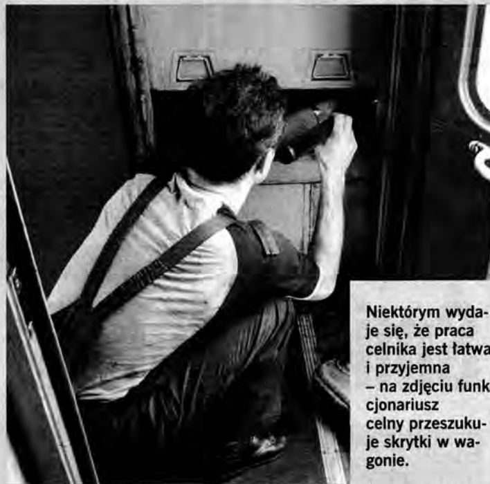
Niektórym wydaje się, że praca celnika jest łatwa i przyjemna – na zdjęciu funkcjonariusz celny przeszukuje skrytki w wagonie.

Nowością w tej procedurze będzie fakt, że obserwatorem rozmów kwalifikacyjnych w przemyskiej Izbie Celnej będzie przedstawiciel oddelegowany przez Fundację Batorego, która od 2000 roku we współpracy z Helsińską Fundacją Praw Człowieka realizuje „Program przeciw Korupcji”. Program ten składa się z szeregu przedsięwzięć (kampanie edukacyjne, badanie opinii publicznej,