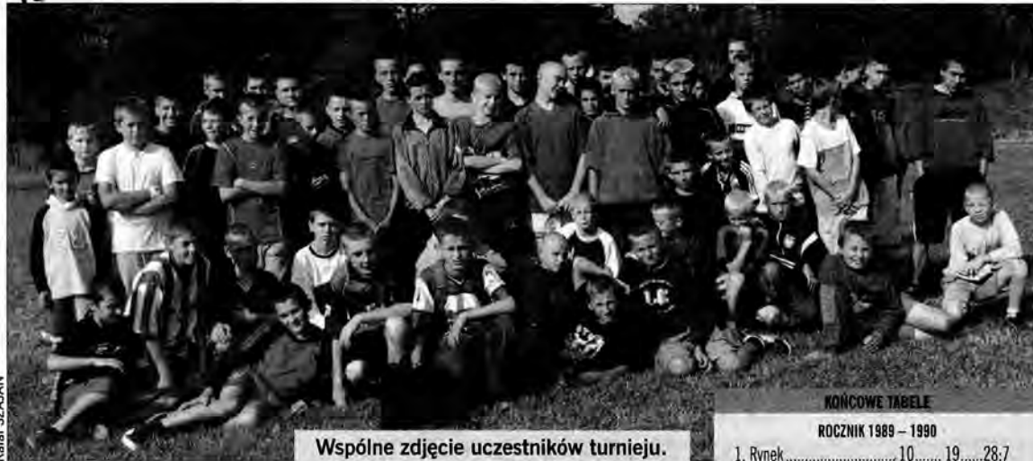
Wspólne zdjęcie uczestników turnieju.