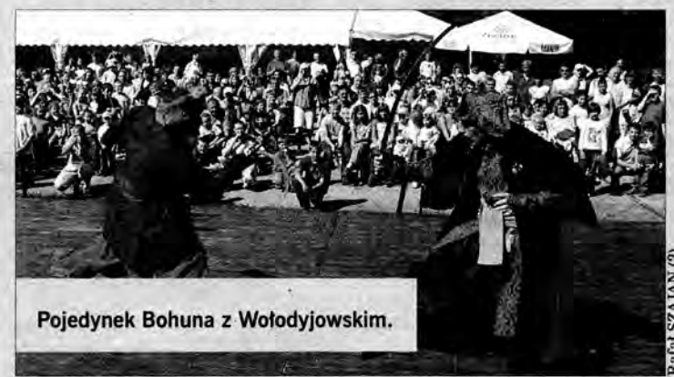
Pojedynek Bohuna z Wołodyjowskim.