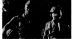
Żelazny orzeł – film sensacyjny, USA 1986, reż. Sidney J. Furie.

Podczas jednego z rutynowych lotów zwiadowczych nad Morzem Śródziemnym dwa amerykańskie samoloty bojowe zostają zaatakowane przez sity powietrzne niewielkiego państwa arabskiego.