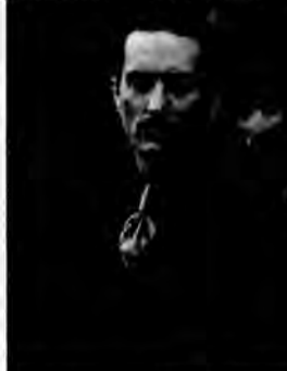
Ojciec chrzestny II - film kryminalny, USA 1974, reż. Francis Ford Coppola.

Michael Corleone pragnie być godnym następcą ojca. Tak jak on jest bezwzględny dla wrogów i zdradców. Ma jednak wiele problemów rodzinnych, które sprawiają, że ostatecznie zostaje sam.