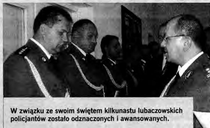
W związku ze swoim świętem kilkunastu lubaczowskich policjantów zostało odznaczonych i awansowanych.

Przypadające 24 lipca Święto Policji w lubaczowskiej komendzie powiatowej obchodzone było dwa dni wcześniej.