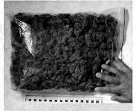
Worek z 630 gramami hollenderskiego skuna znalezione w volkswagenie.

W ubiegłym tygodniu policjanci z Komendy Powiatowej Policji w Jarosławiu odnieśli kolejny sukces w walce z narkomanią.