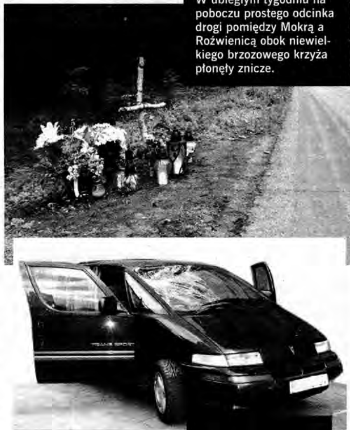
W ubiegłym tygodniu na poboczu prostego odcinka drogi pomiędzy Mokrą a Roźwienicą obok niewielkiego brzozonego krzyża płonęły znicze.

Dwa dni później policjanci z sekcji kryminalnej ustalili, że w Szówsku w zabudowaniach gospodarczych na jednej z posesji znajduje się auto, które nie należy do właściciela posesji i które mogło mieć związek z tym wypadkiem. Był to zielony pontiak. Uszkodzenia na zderzaku i wgniecioną prawą przednią szybą uwiarygodniły podejrzenia. Wtedy już łatwo poszło ustalenie właściciela, którym okazał się 54-letni znany jarosławski biznesmen