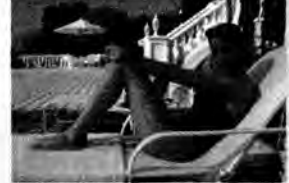
Życie mniej zwyczajne – komediodramat, Wielka Brytania 1997, reż. Danny Boyle

Robert Lewis zostaje wyrzucony z pracy przez zniechęconego szefa. W odwecie porwuje jego córkę Celine. Uprawdzenie zakładniczki powoduje interwencję dwóch aniołów.