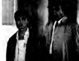
Przestępczość zdeorganizowana - komedia kryminalna, USA 1989, reż. Jim Kouf.