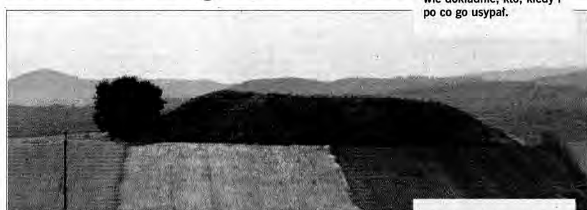
Kopiec w Sólcy nie wygląda na naturalny pagórek, ale nikt z miejscowych nie wie dokładnie, kto, kiedy i po co go usypał.