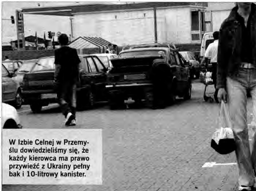
W Izbie Celnej w Przemyśle dowiedzieliśmy się, że każdy kierowca ma prawo przywieźć z Ukrainy pełny bak i 10-litrowy kanister.

Dostawcy i sprzedawcy paliw potrafią wymienić całą lita-