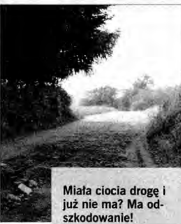
Miała ciotka drogę i już nie ma? Ma odszkodowanie!