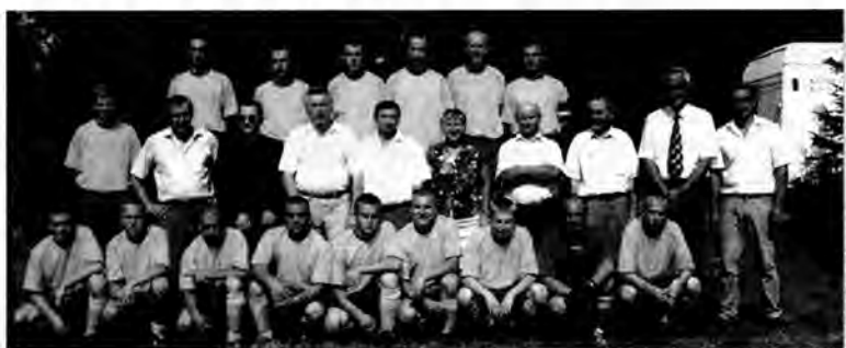
Drużyna KSK Koniaków w tym sezonie jeszcze nie zagra w klasie B.

31 lipca na stadionie Czarnych w Bolestraszcach odbędzie się piłkarski turniej oldbojów o Puchar Wójta Gminy Żurawica. W imprezie zagrają cztery zespoły: Żurawianka Żurawica, Grom Wyszatyce, Rada Orzechowce i gospodarze – Czarni Bolestraszyce. Początek zmagania o g. 14.30. MG