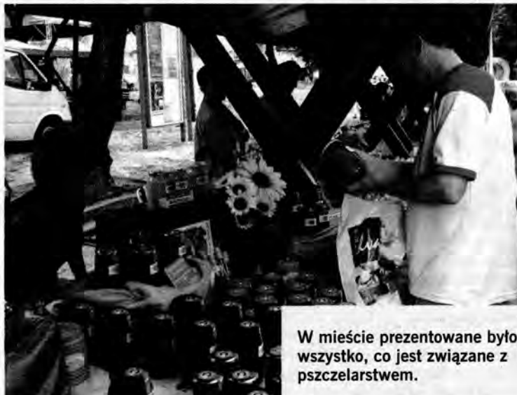
W mieście prezentowane było wszystko, co jest związane z pszczelarstwem.

Weekendowe święto miało charakter rodzinny, połączony z edukacją pszczelarską. Na ustawionych stoiskach producenci wyrobów pszczelarskich, którzy przyjechali z całego kraju, wystawiali produkty z miodu, pyłku pszczelego i wosku. Dużym zainteresowaniem cieszyły się kosmetyki i miód pitny. Czas umilały zespoły folklorystyczne. Dla dzieci i młodzieży przygotowano różnego rodzaju konkursy, gry i zabawy na dmuchanym placu zabaw. Uroczystość zbiegła się z obchodami 30-lecia Centrum Kultural-