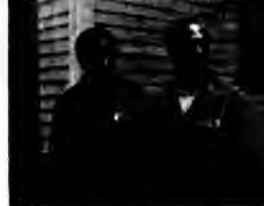
Życie - komediodramat, USA 1999, reż. Ted Demme.