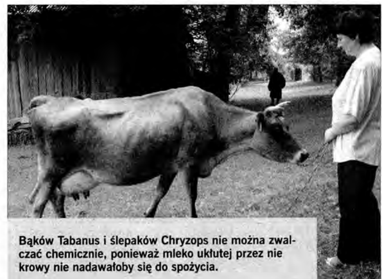
Bąków Tabanus i ślepaków Chryzops nie można zwalczać chemicznie, ponieważ mleko ukłutej przez nie krowy nie nadawałoby się do spożycia.