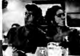
Hot Shots II - komedia sensacyjna, USA 1993, reż. Jim Abrahams

Pilot Topper Harley ukrywa się przed koszmarnymi wspomnieniami w buddyjskim klasztorze. Spokój jednak nie trwa długo. CIA składa mu propozycję poprowadzenia specjalnej misji w Iraku.