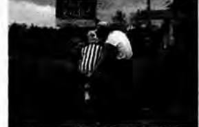
Bar pod młynkiem – tragikomedie, Polska 2004, reż. Andrzej Kondratiuk

Pani Celina – kobieta po przejściach, wdowa, bezrobotna prządka, za pożyczone pieniądze otwiera barek szybkiej obsługi. W gastronomicznym przedsięwzięciu pomaga jej pan Roman – kawaler z odzysku.