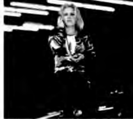
Hit na sobotę: Nadbagaż - komedia romantyczna, USA 1997, reż. Marco Brambilla.

Nastoletnia Emily Hope, chcąc zwrócić na siebie uwagę ojca, pozoruje własne porwanie. Nim jednak przerażony tata ją odnajdzie, samochód, w którym ukryła się Emily, zostaje skradziony.