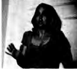
Jak wykończyć panią T.? - thriller, USA 1999, reż. Kevin Williamson.

W liceum Grandsboro High rządzi zniechodzona Eve Tingle. Faworyzuje ulubieńców, gnebi i poniża pozostałych uczniów. Nielubianej przez nauczycielkę Leigh Ann wysoka nota może zapewnić stypendium.