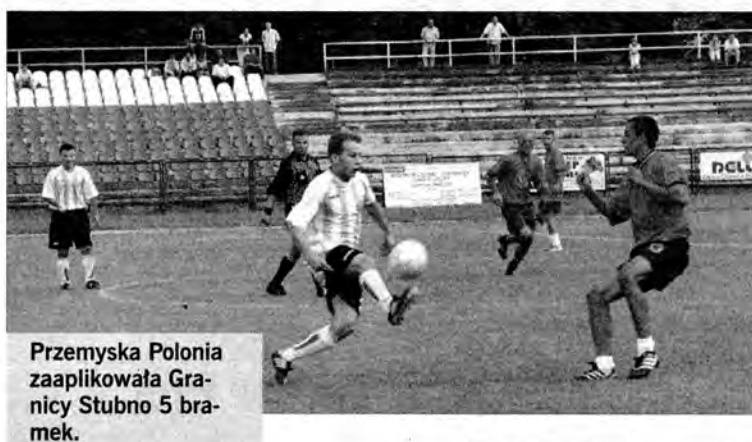
Przemyska Polonia zaaplikowała Granicy Stubno 5 bramek.