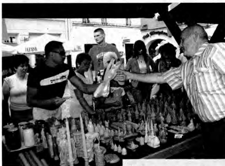
W miniony weekend Przemyśl stał się stolicą miodu.

nego w Przemyślu. Na estradzie w rynku wystąpiły zespoły: Koralik, Ostrowiaci oraz DREWUTNIA z Lublina. Wieczorem mieszkańcy wsluchiwali się w muzykę szkocką i kanadyjską. Impreza zorganizowana została przez: Krakowską Kongregację Kupiecką