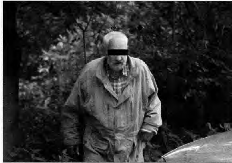
Porusza się z wielkim trudem. Droga od parkingu przed seminarium duchownym do Rynku zajęła mu ponad dwadzieścia minut.