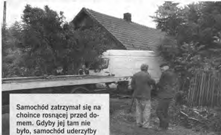
Samochód zatrzymał się na choince rosnącej przed domem. Gdyby jej tam nie było, samochód uderzyłby w dom.

Wyciąganie mercedesa sprintera, który wypadł z drogi i wpadł na jedną z posesji w Zadąbrowiu, trwało ponad trzy godziny. Prawdopodobną przyczyną kolizji była zbyt szybka jazda kierowcy oraz śliska nawierzchnia. Samochód, który wypadł z drogi, zatrzymał się na choince, tuż przed domem. Drzewo uratowało nie tylko dom, ale i śpiącego tuż za ścianą mężczyznę. – To nie pierwszy wypadek w tym miejscu. Zawsze jest tak, że akurat w tym miejscu kierowcy wypadają z drogi i zatrzymują się na naszych płotach, podwórkach. Aż