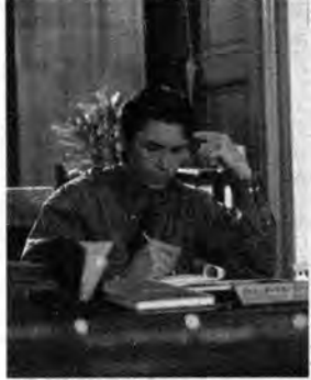
W krainie dreszczowców: Nie zapomnisz mnie (1/2) – film kryminalny, USA 2004, reż. Armand Mastroianni.