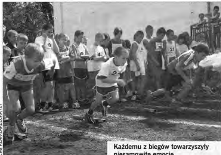
Każdemu z biegów towarzyszyły niesamowite emocje.