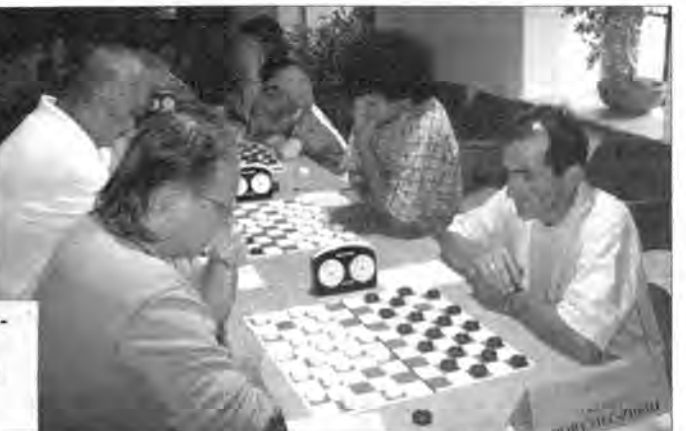
Ze zborów własnych