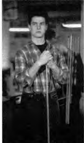
Wieczór filmowy Kocham kino: Kolor pieniędzy – dramat obyczajowy, USA 1986, reż. Martin Scorsese.