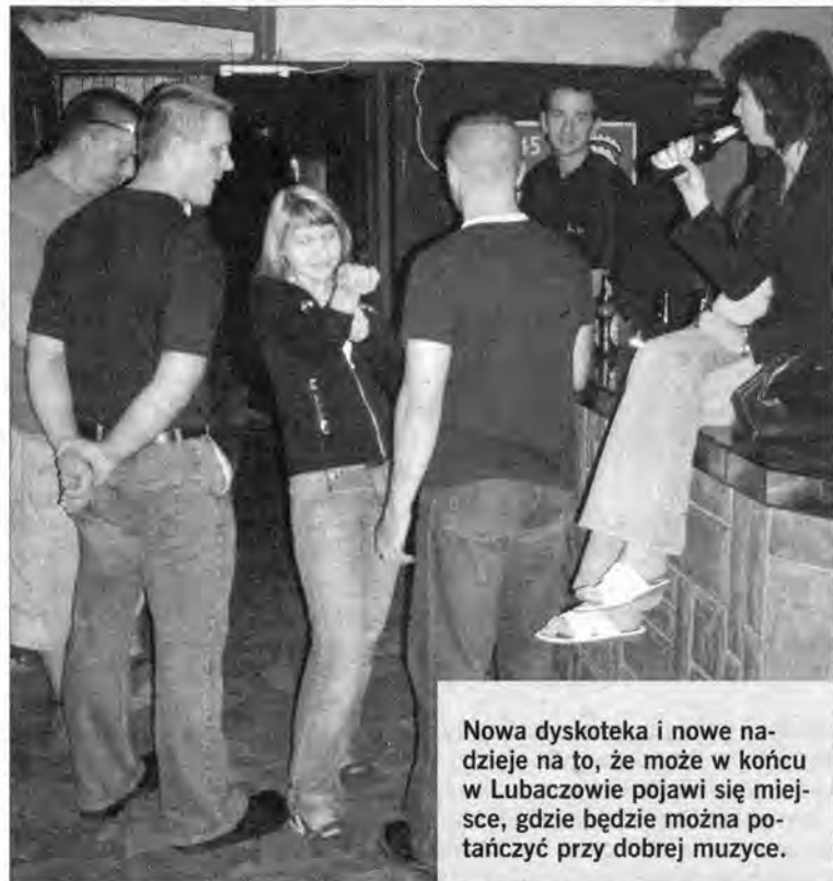
Nowa dyskoteka i nowe nadzieje na to, że może w końcu w Lubaczowie pojawi się miejsce, gdzie będzie można potańczyć przy dobrej muzyce.

Lubaczowianie od dawna narzekali na miejscową dyskotekę, zwłaszcza że było to jedyne miejsce w mieście, gdzie można było potańczyć. Tyle że średnia wieku tańczących zatrzymywała się gdzieś na granicy uczniów gimnazjum.