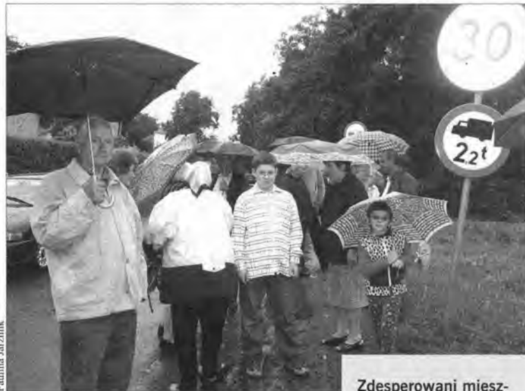
Zdesperowani mieszkańcy ul. Gottfrieda pytają, kiedy skończy się ich koszmar.

– Zwracaliśmy się o pomoc w tej sprawie do starosty jarosław-