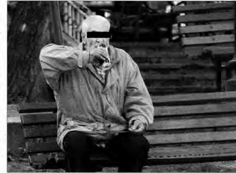
Nie odrywając puszki od ust, pochłoniął jej zawartość.