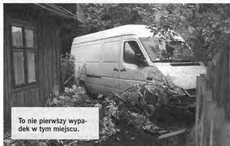
To nie pierwszy wypadek w tym miejscu.