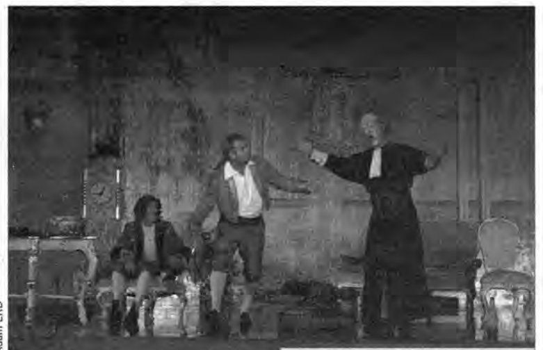
Cyrulik sewilski w Krasiczynie, w wykonaniu Lwowskiego Państwowego Akademickiego Teatru Opery i Baletu.

W foliowych płaszczach Cyrulik sewilski jest najczęściej wykonywaną operą Rossiniego.