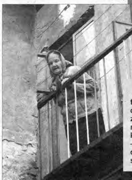
– A ja, jak słyszę te dzwony, to się cieszę – dorzuca z balkonu chyba najstarsza mieszkanka kamienicy. – Cieszę się, że w ogóle jeszcze coś słyszę!...

ULANICA (gm. Dynów): 60-lecie straży pożarnej Zagrała orkiestra, przypięto medale