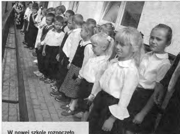
W nowej szkole rozpoczęło naukę 77 uczniów.

O tym, że tradycja w Ujeznej jest równie ważna jak nowoczesność świadczy początek uroczystości. Po Mszy św. odprawionej pod