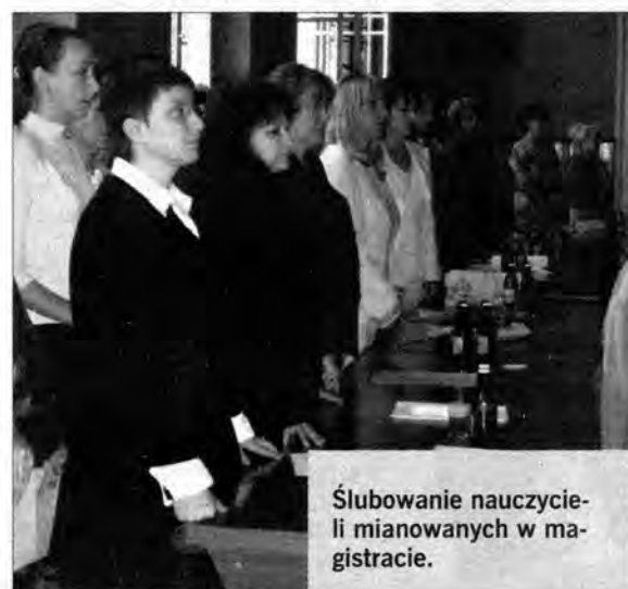
Ślubowanie nauczycieli mianowanych w magistracie.