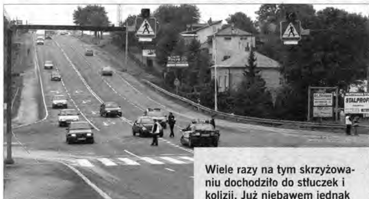
Wiele razy na tym skrzyżowaniu dochodziło do stłuczek i kolizji. Już niebawem jednak stanie tu sygnalizacja świetlna.

Generalna Dyrekcja Dróg Krajowych i Autostrad w Rzeszowie wreszcie pozytywnie odpowiedziała na wieloletnie monity władz gminy i mieszkańców Żurawicy. Jeszcze w tym roku na bardzo niebezpiecznym skrzyżowaniu drogi krajowej nr 77 Lipnik – Przemyśl z drogą wojewódzką nr 881 Łańcut – Żurawica stanie sygnalizacja świetlna!