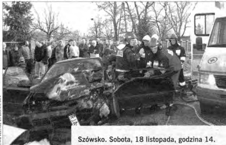
Szówsko. Sobota, 18 listopada, godzina 14.

Trzy osoby zostały poszkodowane, w tym jedna ciężko, w wypadku, do jakiego doszło w sobotę po godzinie czternastej w Szówsku.