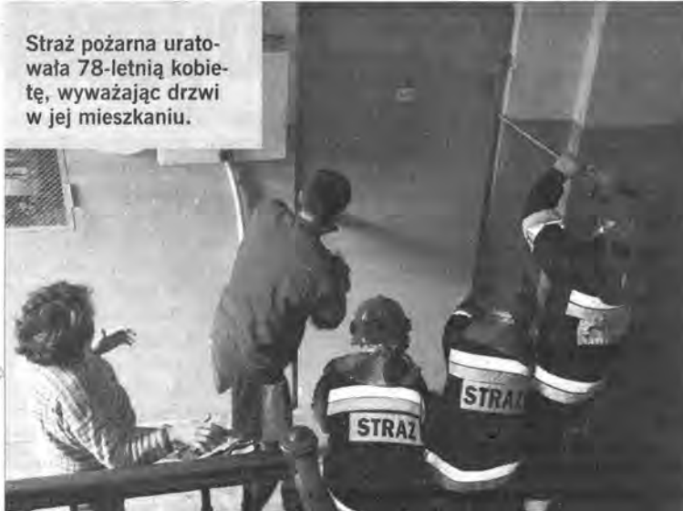
Straż pożarna uratowała 78-letnią kobietę, wyważając drzwi w jej mieszkaniu.