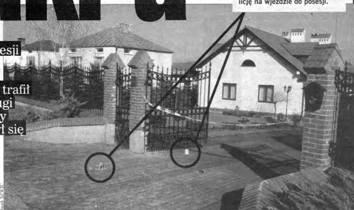
Ślady zabezpieczone przez policję na wjeździe do posesji.