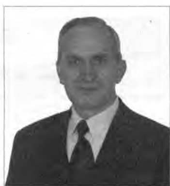
Stanisław BAJDA Starosta Przemyski

Serdecznie dziękuję Państwu za to, że obdarzyliście moją osobę zaufaniem, oddając na mnie swój głos w wyborach samorządowych 12 listopada 2006 roku. Słowa podziękowania kieruję także do tych wszystkich, którzy swoją aktywnością przyczynili się do uzyskania przeze mnie mandatu radnego Sejmiku Województwa Podkarpackiego. Zrobię wszystko, aby nie zawieść Waszego zaufania.