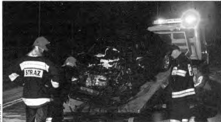
Przemyśl. Wypadek na ul. Krakowskiej spowodował, że droga krajowa E-4 była zablokowana przez prawie 2 godziny.

W niedzielne popołudnie, około godz. 16, na ulicy Krakowskiej doszło do zderzenia samochodu osobowego marki Audi 80 z autobusem marki Jelcz. W wyniku wypadku przez prawie 2 godziny krajowa „czwórka” była zablokowana.