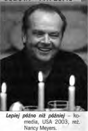
Lepiej późno niż później - komedia, USA 2003, reż. Nancy Meyers.