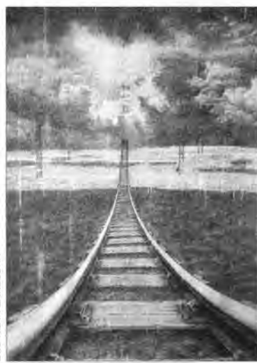
Historia o poriomaniu.