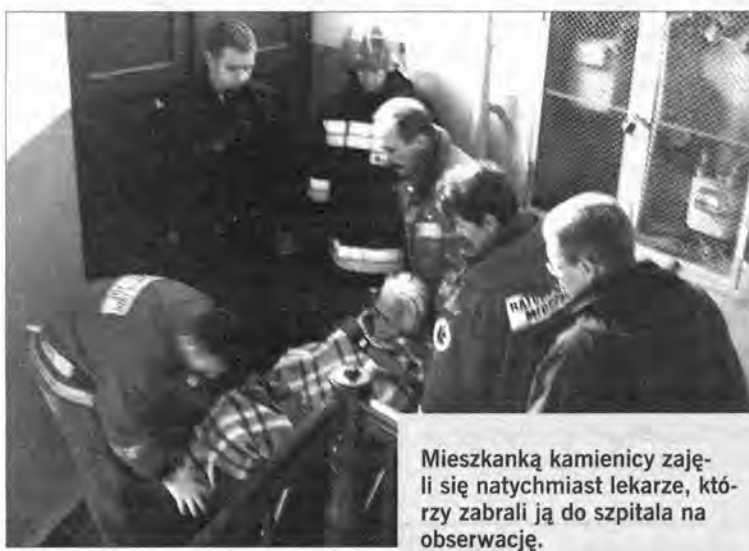
Mieszkankę kamienicy zajęli się natychmiast lekarze, którzy zabrali ją do szpitala na obserwację.