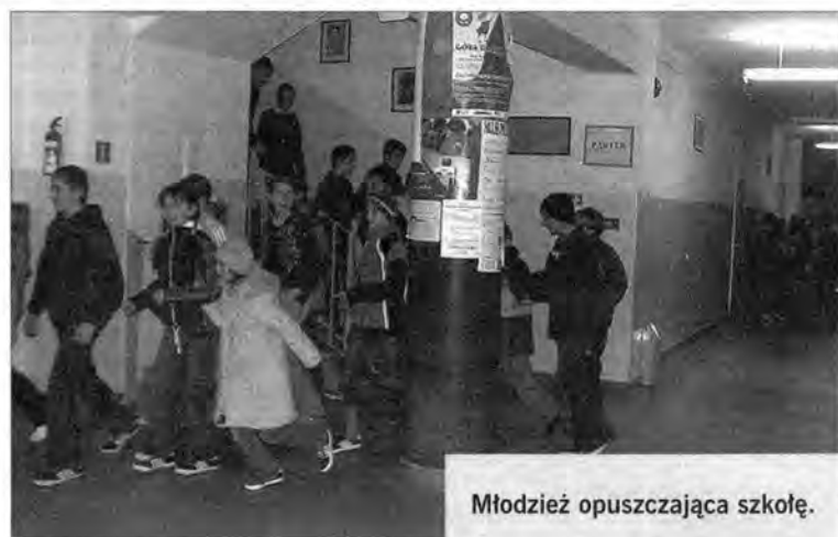
Młodzież opuszczająca szkołę.

Była dziewiąta rano, kiedy zabrzmiał jeden po drugim trzy dzwonek, a w szkolnej radioli zabrzmiał głos dyrektora o ewakuacji w związku z pożarem.