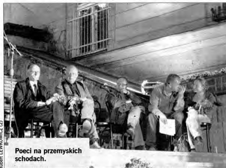
Poeci na przemyskich schodach.

W tegorocznej Wiosnie Poetyckiej uczestniczyło niewielu poetów. Jednak tradycyjnie, na schodach, odbyło się nocne czytanie wierszy.