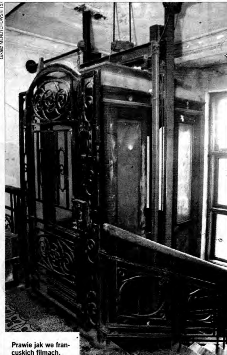
Pracuje jak we francuskich filmach.