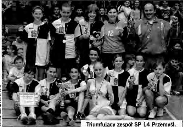
Triumfujący zespół SP 14 Przemysł.