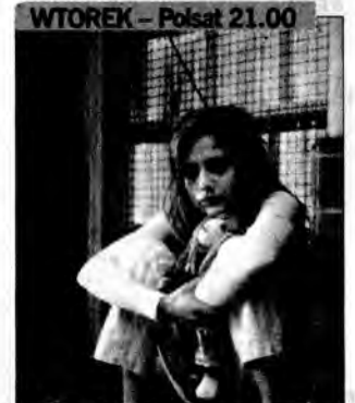
Nikomu ani słowa – thriller, USA/Australia 2001, reż. Gary Fleder. Nieznani sprawcy porwują córkę cenionego nowojorskiego psychiatry. W zamian za jej uwolnienie żądają, by wydobyl on bezcenne dla nich informacje od jednej ze swoich pacjentek.

Materiał informacyjny, internetowy oraz zdjęcia zostały dostarczone przez A plus C. Oprac. MZ.