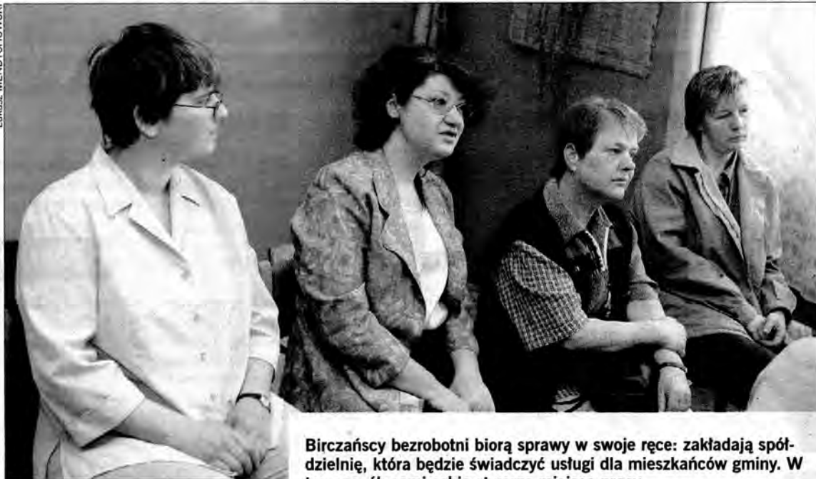
Birczańscy bezrobotni biorą sprawy w swoje ręce: zakładają spółdzielnię, która będzie świadczyć usługi dla mieszkańców gminy. W ten sposób sami sobie stworzą miejsca pracy.

Zaczął się od szkolenia, na którym kobiety z Birczy dowiedziały się, co to jest spółdzielnia socjalna i jak ją organizować. Twór taki z definicji jest adresowany do tzw. wykluczonych – bezrobotnych, bezdomnych, uzależnionych, niepełnosprawnych itd. Poprzez prowadzenie wspólnego miniprzedsiębiorstwa grupy tego rodzaju nie tylko zapewniają sobie miejsca pracy, ale i walczą z samym wykluczeniem: – W Krakowie jest hotel prowadzony przez spółdzielnię założoną przez osoby chore psychicznie. U nas największy problem to bezrobocie. Pomyślałyśmy: dlaczego nie?