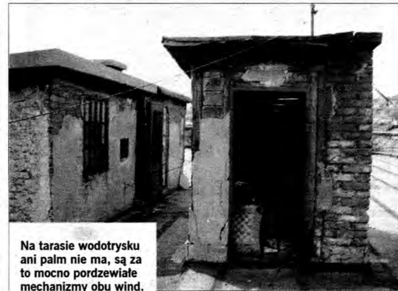
Na tarasie wodotrysku ani palm nie ma, są za to mocno porzewiałe mechanizmy obu wind.

Tak dużych pieniędzy z budżetu państwa na zabytki Podkarpacie jeszcze nie miało