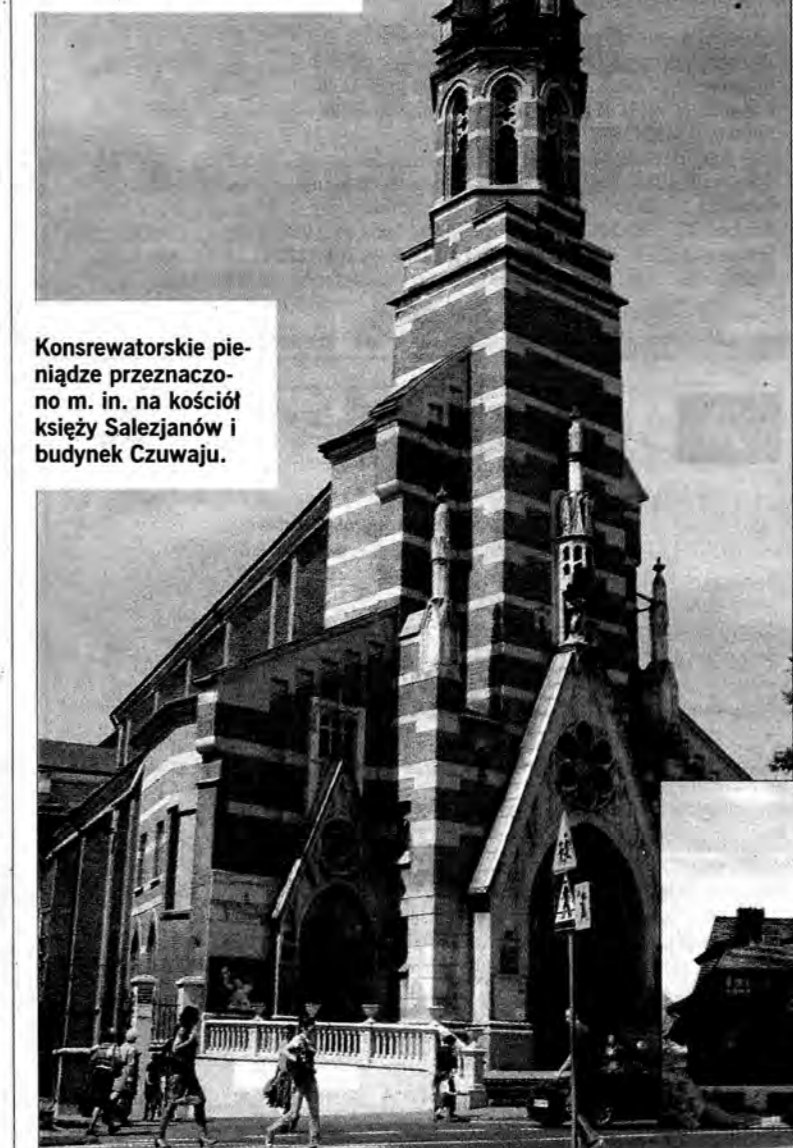
Konserwatorskie pieniądze przeznaczone m.in. na kościół księży Salezjanów i budynek Czuwaju.

Na liście dotowanych obiektów jest dużo kamienic, w tym i prywatnych. Ponadto: zamki, pałacyki, kościoły, cerkwie, kaplice, cmentarze itp.