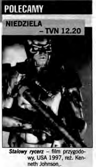
Stalowy rycerz - film przygodowy, USA 1997, reż. Kenneth Johnson.