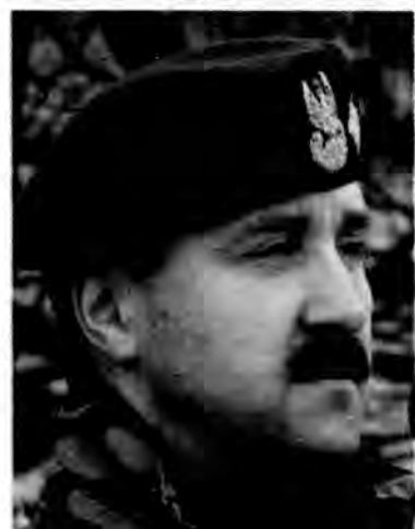
General brygady JANUSZ BRONOWICZ

Prokuratury Okręgowej, ale ta umorzyła postępowanie, bo nie doszukała się znamion czynu zabronionego.