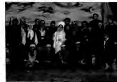
Aktorzy po przedstawieniu Gwiazda Syberii .