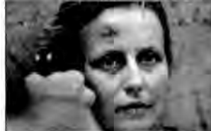
Przesłuchanie – dramat psychologiczny, Polska 1982, reż. Ryszard Bugajski.

Antonina, piosenkarka kabaretowa, upita pewnego wieczoru w restauracji przez dwóch mężczyzn, zostaje przewieziona do więzienia. Przesłuchujący ją żądają, by złożyła zeznania obciążające majora Olchę.