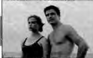
Krag wtajemniczonych – film sensacyjny, USA 2000, reż. Mary Lambert.

Po wyjściu ze szpitala psychiatrycznego młoda dziewczyna Adrien Williams podejmuje pracę w ekskluzywnym klubie na wschodnim wybrzeżu. Poznaje tam grupę studentów.