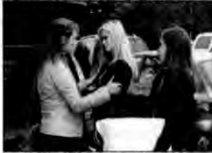
Urwany film – film obyczajowy, USA/Kanada 2007, reż. David Wu.

Jesse rozpoczyna studia. Mieszka w akademiku z Shanną, która wciąga ją w wir rozrywkowego życia. Jesse zaniedbuje naukę, rujnuje sobie zdrowie i nie kontaktuje się z rodzicami.