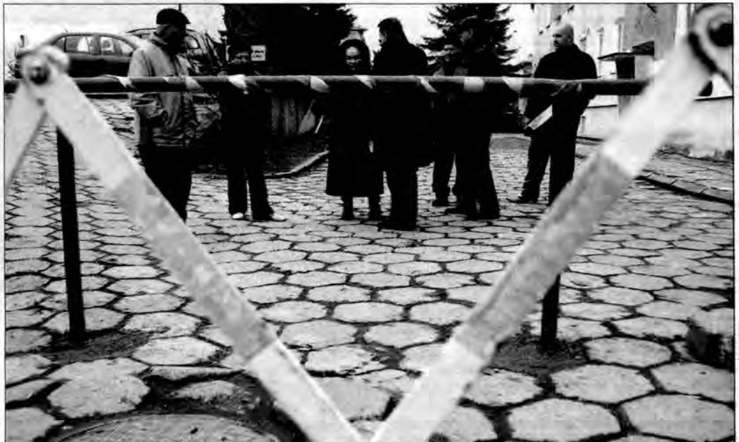
3 grudnia na drodze dojazdowej do bloku nr 40 stanęła metalowa zapora.