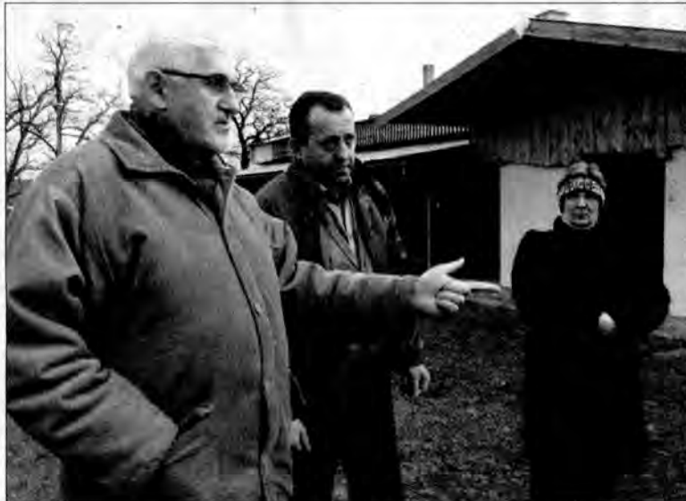
– To jest skandal! – mówią mieszkańcy wsi. – Takiego miejsca sprzedawać po prostu nie można!