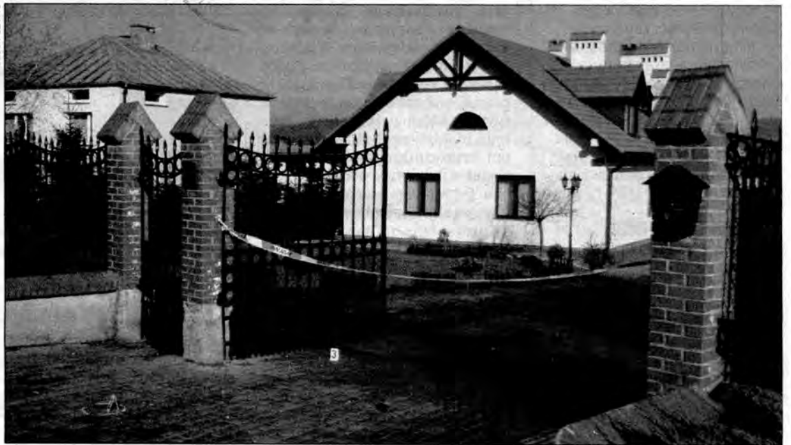
Teren posesji, na której rozegrała się tragedia (zdjęcie wykonano kilka godzin po napadzie).