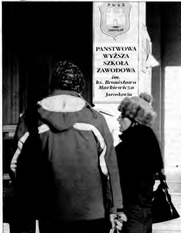
Konflikt w jarosławskiej PWSZ został w porę ugaszony.

Władze uczelni powiedziały, że podejmując taki krok, chcą szukać oszczędności. – W porządku. Ale dlaczego naszym kosztem? A może by tak przestali zwalniać magistrów, w miejsce których zatrudniają doktorów z Krakowa do prowadzenia ćwiczeń. Pan myśli, że taki doktor przyjedzie do Jarosławia za dwa tysiące? Chyba za dwa razy tyle – twierdzi inny pra-