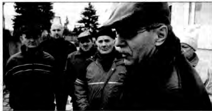
Mieszkańcy bloku nr 40 są zbulwersowani.

nikach i pobliskiej skarpie. – Nawet jeśli to jest czyjaś własność, to ten ktoś musi udostępnić przejazd w momencie, gdy jest to jedyna droga dojazdowa – tłumaczy, a wie, co mówi, bo jest emerytowanym inżynierem.