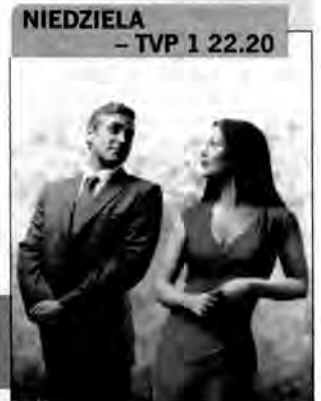
Uczta kinomana: Okrucieństwo nie do przyjęcia - komedia romantyczna, USA 2003, reż. Joel Coen, Ethan Coen. Kolekcjonerka bogatych mężów postanawia pogryźć słynnego adwokata - przyczynę jej porażki podczas sprawy rozwodowej. Oboje zastawiają na siebie pułapki, nie wiedząc, że u podłoża intrygi leży miłość.