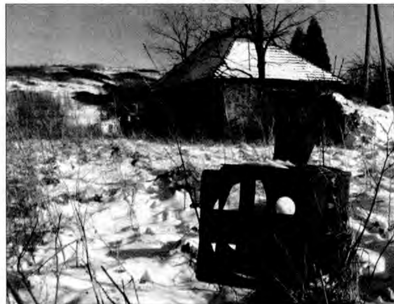
Stacja Hadle Szklarskie znajduje się w gorzej niż oplakanym stanie.