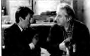
Plotka – komedia, Francja 2001, reż. Francis Veber.

Pignon jest księgowym, zagrożonym zwolnieniem z pracy. Aby tego uniknąć, rozpoczyna plotkę, że jest gejem. Wówczas zwolnienie będzie można przedstawić jako prześladowanie mniejszości seksualnej.