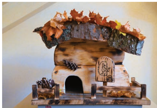
III miejsce – Miłosz Szmyd (SP w Targowiskach)