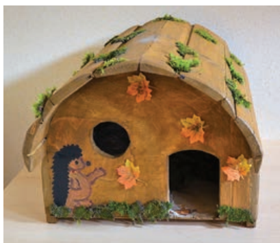
Wyróżnienie – Emilia Koziół (SP w Targowiskach)