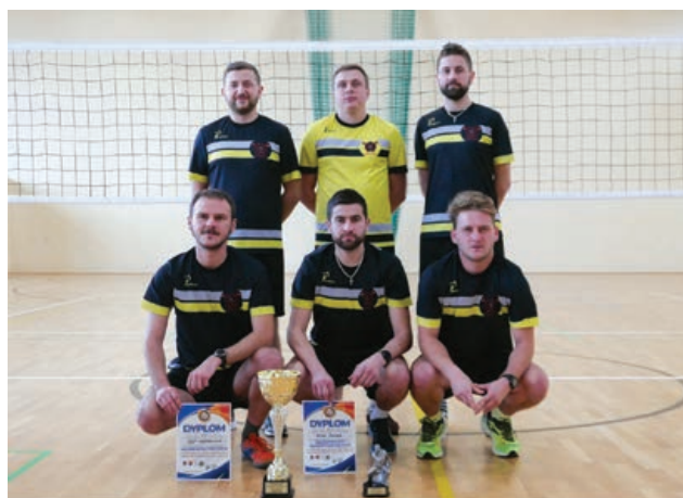
OSP Targowiska – I miejsce