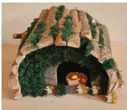
Wyróżnienie – Radosław Brachun (SP w Łężanach)