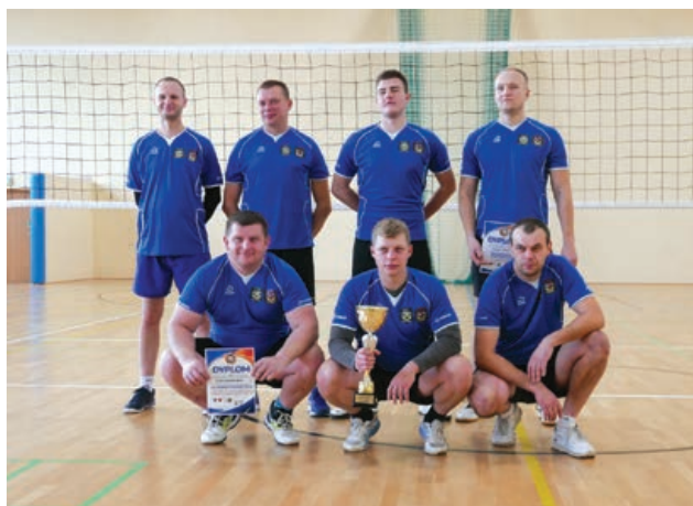
OSP Głowienka – III miejsce