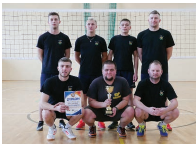
OSP Iskrzynia – II miejsce