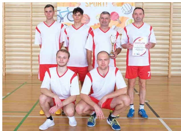
4. miejsce – OSP Korczyzna