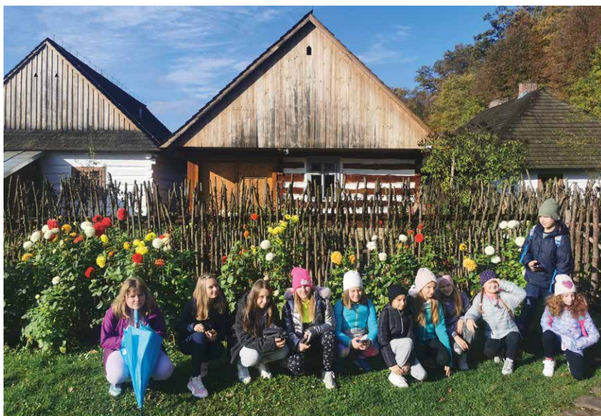
Uczniowie kl. 4–6 szkoły w Targowiskach w Muzeum Budownictwa Ludowego w Sanoku

Wycieczki urozmaicają zajęcia lekcyjne, dzięki czemu nauka nabiera praktycznego wymiaru. Uczenie się oparte na praktycznym odkrywaniu śladów