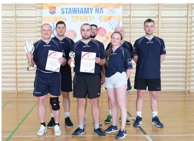
1. miejsce – OSP Moderówka

Tekst: Leszek Zajdel