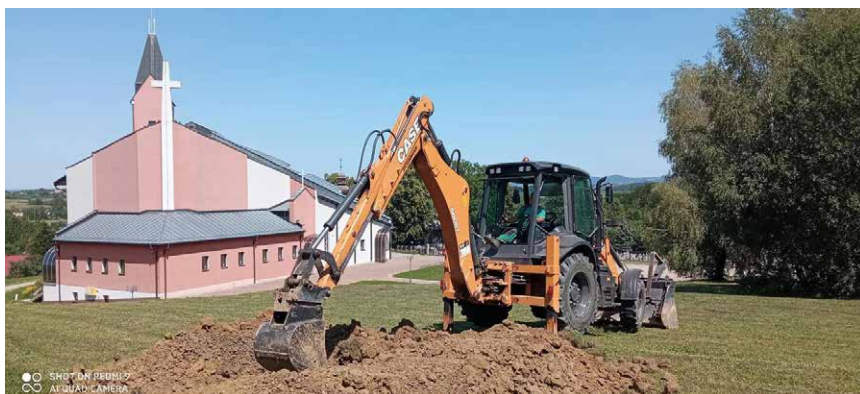
Przygotowania do rekonstrukcji bitwy na Klarowcu

ZGK realizuje swoje zadania, współpracując także z innymi jednostkami gminy Miejsce Piastowe. Pracownicy angażują się w przygotowania do wydarzeń oraz imprez kulturalnych, jak np. „Wiele Kultur – Jedno Miejsce. Od Kłajpedy po Saloniki”. Przykładem wspólnych działań było przygotowanie pola przed rekonstrukcją bitwy na Klarowcu – wykonano zasieki oraz okopy. Oprócz tych prac – i wielu innych związanych z utrzymaniem czystości i porządku – wykonali szereg prac remontowych oraz naprawczych.