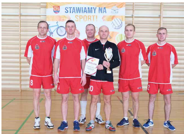
3. miejsce – PSP Krosno