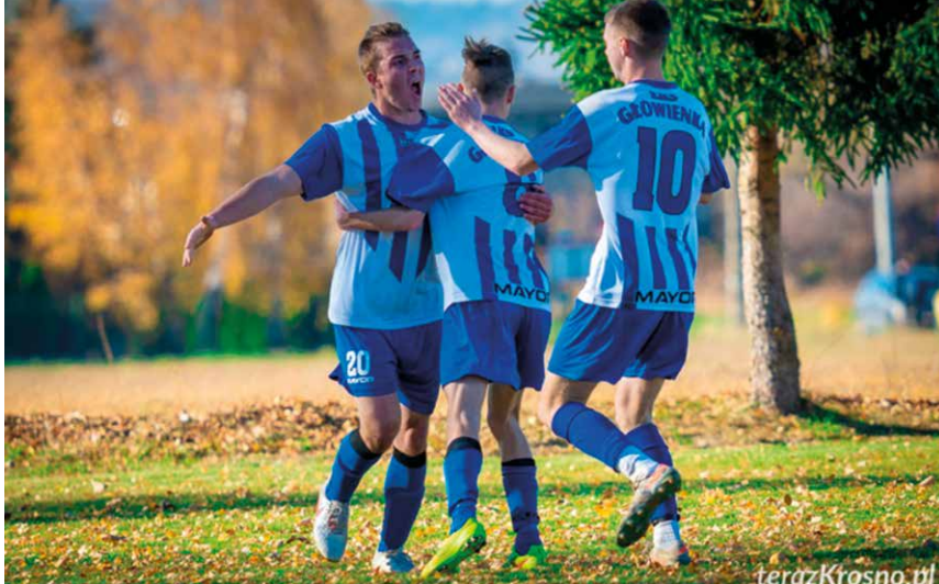
Zawodnicy LKS Głowienka w niedawno zakończonej rundzie jesiennej mieli sporo powodów do radości