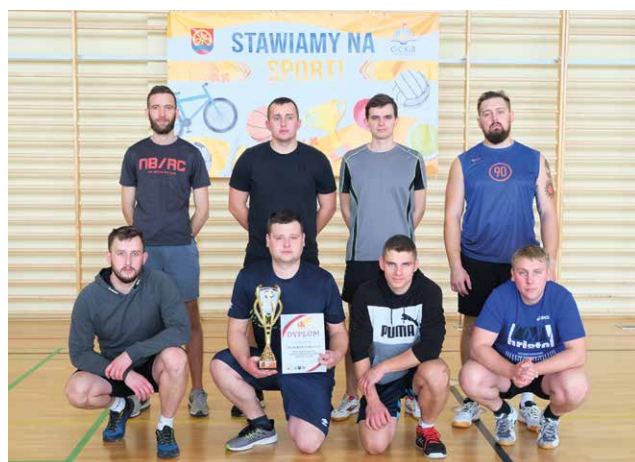
2. miejsce – OSP Bratkówka