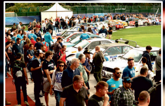
Tłumy z całej Europy na stadionie w Serravalle podczas rajdu