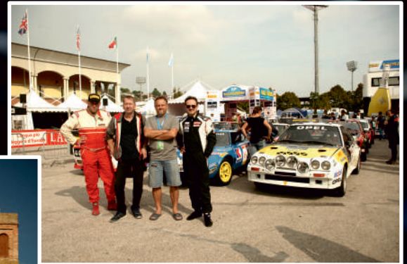
Męska część Zespołu Rajdowego Hoffman na mecie rajdu