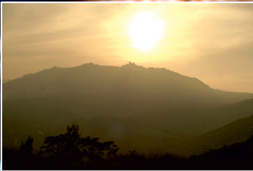
San Marino - zachód słońca nad Monte Titano