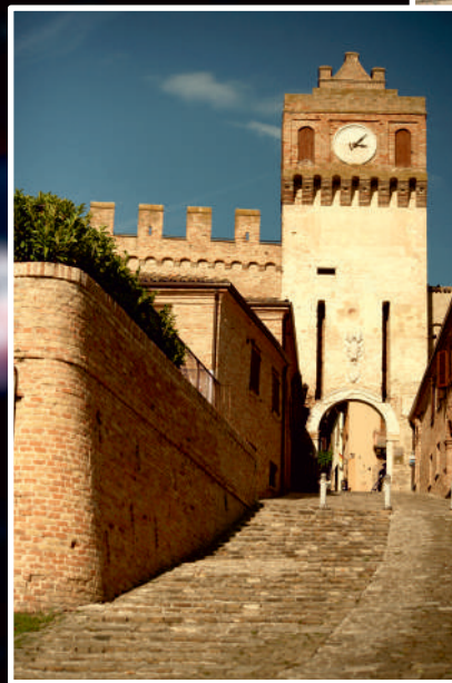
Wieża z bramą wejściową na zamek Gradara