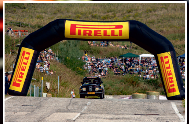
Saab 96 z barwami Boguchwały na ostatnim odcinku „The Legend”