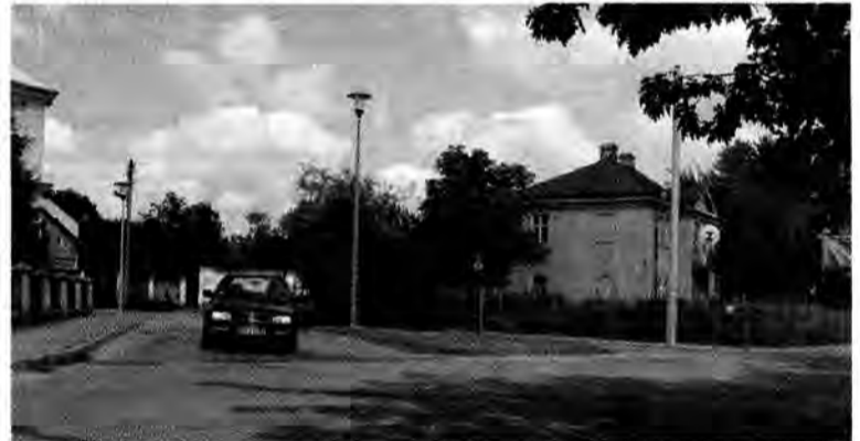
Brak znaku drogowego w tym miejscu może kiedyś doprowadzić do czołowego zderzenia.