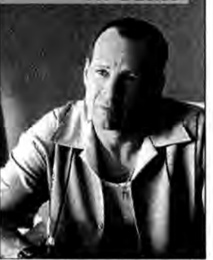
Jak ugryźć 10 milionów - komedia kryminalna, USA 2000, reż. Jonathan Lynn.

Nicholas mieszka wraz z żoną na przedmieściach Montrealu. W nowym sąsiedzie z przeciwka rozpoznaje chicagowskiego gangstera Jimmy'ego Tudeskiego. Ma nadzieję zarobić na tej wiedzy.