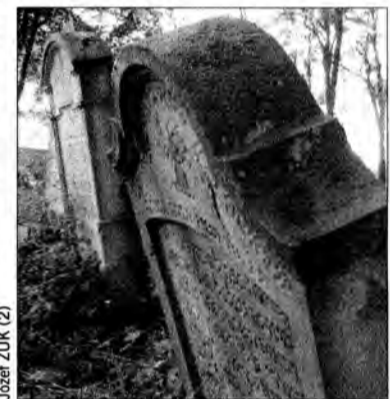
Tablice pamiątkowe na cmentarzu żydowskim w Siedleczce.