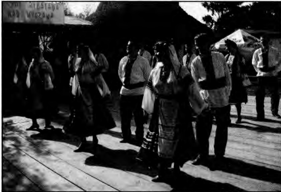
Zespół „Radist” ze Lwowa.

Jak co roku nad Wiązownicką Wycząwą stoły uginały się od przepysznych wiejskich potraw i wspaniałych aromatycznych nalewek. Można było skosztować zupy „szabaga”, zupy „wszystko”, krugiel pieczony, maczki z grzybów czy paluchów orzechowych. I choć konkursowi przewodziło staropolskie przysłowie „Gdzie kucharek sześć tam nie ma co jeść”, to nijak nie można było się do niego odnieść. Koła gospodyń wiejskich i zespoły śpiewacze z dawnego województwa podkarpackiego do konkursu przygotowały się wyśmienicie, przedstawiając dwie potrawy – jedną gotowaną, drugą pieczoną oraz piosenki o tematyce kulinarnej. Jury miało nie lada orzech do zgryzienia w wyborze tegorocznych zwycięzców. Jednak w ostatecznej ocenie przyznało dwie równorzędne I nagrody zespołowi „Jawor” z Jawornika Polskiego i zespołowi „Piwodzianie” z Piwo-