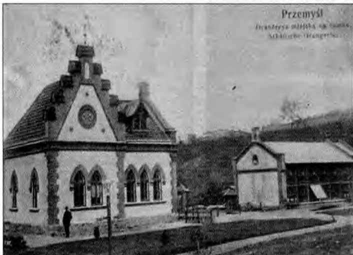
Domek ogrodnika i Zwierzyniec na starych pocztówkach.

Wybudowany w 1901 roku domek ogrodnika, a wraz z nim szklarnia i oranżeria, idą do generalnego remontu. Ma to być remont tzw. konserwatorski, a to oznacza, że za rok, półtora zabudunek będzie wyglądał jak drzewiej, a nie jak np. kosmodrom. Zgodnie z wytycznymi konserwatora odтворzone zostaną najdrobniejsze detale, tyczy się to jednak bryły i elewacji zewnętrznych, natomiast wnętrza urządzone zostaną już z większą swobodą i spełniać ma inne niż niegdyś funkcje. Kiedyś, zgodnie z nazwą, w domku mieszkał ogrodnik, który zajmował się parkiem. Teraz w domku ogrodnika siedzibę ma znaleźć Związek Gmin Fortecznych Twierdzy Przemysł, zostanie tam też urządzona sala wystaw, a na poddaszu – pokoje noclegowe lub pracownie. Pomieszczenia szklarni i oranżerii zaadaptowane zostaną na kawiarenkę z ogródkiem letnim i miejscem dla orkiestry, tak by w lecie można się było wybrać do parku na potańcówkę. Tak zresztą niegdyś w parku bywało. Powrót do przeszłości nie będzie jednak całkowity: projekt nie przewiduje minizoo, a żyją jeszcze przemysłanie, którzy pamiętają, że coś takiego też w parku funkcjonowało.