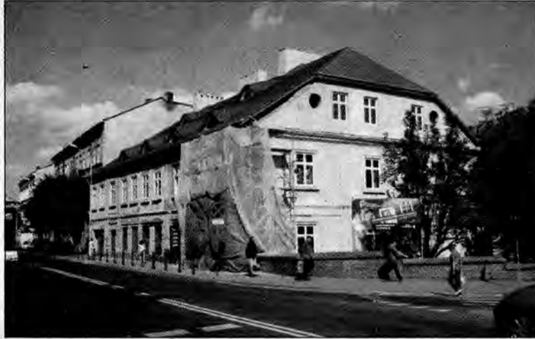
Najstarsza zasańska kamienica, obok której znaleziono szczątki ludzkie.

19 sierpnia pracownicy firmy remontowo-budowlanej kopali rów wzdłuż ściany budynku od strony podwórka. W pewnym momencie, podczas odstawiania fundamentów jeden z nich na głębokości około pół metra znalazł kilka kości. Będąc przekonany, że są to kości zwierzęce, odrzucił je na przyzmię ziemi. Po kilku sztychach pod łopatą znowu coś zobaczył. Tym razem był to fragment ludzkiej czaszki. Wtedy wstrzymał się z dalszym kopaniem, a kierownik budowy bezzwłocznie zawiadomił dyżurnego Komendy Miejskiej Policji w Przemyślu. Na miejsce przyjechała ekipa dochodzeniowo-śledcza, która zabezpieczyła wykopane kości. Zgodnie z procedurą w każdym takim przypadku należy sprawdzić, czy ludzkie szczątki nie są śladem przestępstwa, dlatego też prokurator rejonowy w Przemyślu polecił zabezpieczyć je w prosektorium szpitala wojewódzkiego w celu przeprowadzenia badań przez biegłego sądowego.