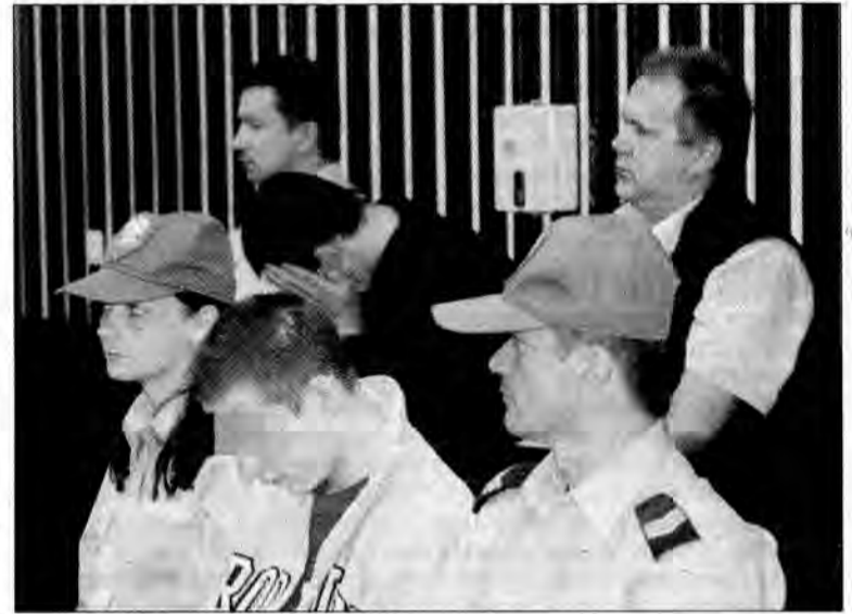
Na sali rozpraw było już spokojnie.