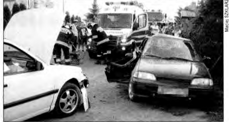
Droga w Wyszatycach przez dwie godziny była nieprzejezdna. Uwolnienie kierowcy i pasażerki samochodu suzuki zajęło najwięcej czasu.

Przypuszczalną przyczyną wypadku, w którym ucierpiały dwie osoby, było wymuszenie pierwszeństwa przejazdu. Kierowcy i pasażerki samochodu marki Suzuki Swift (sprawcy zdarzenia) musieli pomagać strażacy.