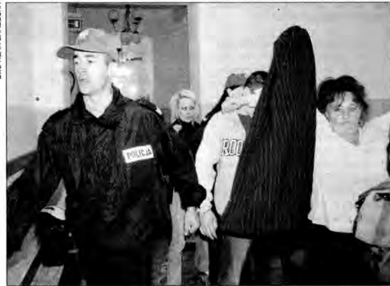
Zanim rozpoczęła się rozprawa, przed salą doszło do gorszących scen. Rodzina jednego z oskarżonych zaatakowała dziennikarzy.