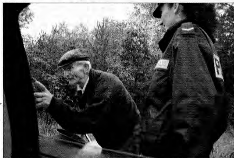
Zawsze tędy chodzę, jeszcze wypadku nie spowodowałem.