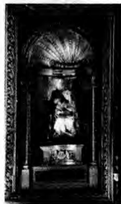
Jedno ze zdjęć pokazanych na wystawie.