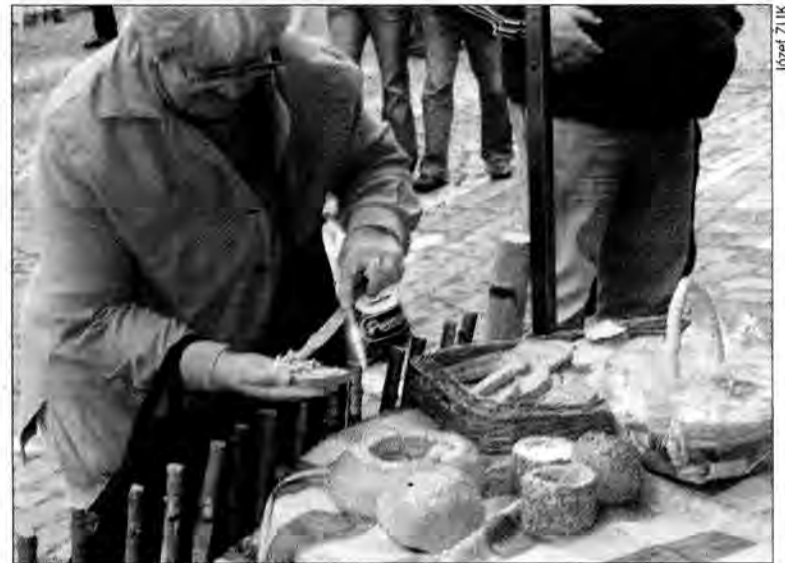
Każdy mógł obejrzeć przygotowane z wielką starannością wystawy oraz skosztować chleba ze smalcem.

Ciasta o niepowtarzalnym smaku, chleby i bułki pieczone według starych, jeszcze „babczyńskich” przepisów, wreszcie nalewki, które były najlepszym specyfikiem na przenikliwe zimno.