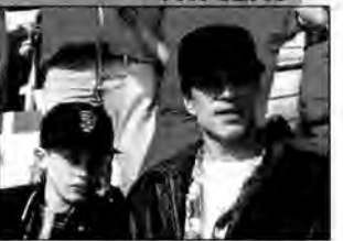
Parachunki z tatą - komedia, USA 1994, reż. Howard Deutch. Miłość synowska zmienia ojca z zatwardziałego przestępcy w Kochającego tatę. Jednak zanim ta przemiana nastąpi, Timmy'ego czeka niejedna trudna chwila z niesformym tatą.