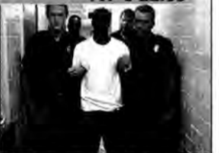
Czekając na wyrok - dramat psychologiczny, USA 2001, reż. Marc Forster.

Hank Grotowski pracuje jako strażnik w stanowym więzieniu. Jest rasistą. Przypadkiem poznaje czarnoskórą Leticię, wdowę po Lawrence, przy egzekucji którego asystował.