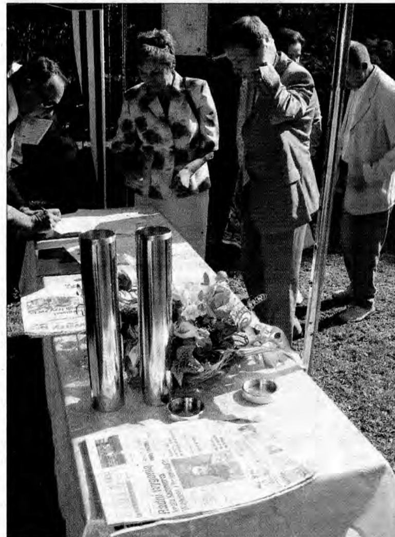
Do wielkich metalowych tub, w które włożono akt erekcyjny z podpisanymi wszystkimi VIP-ów, trafiły też lokalne gazety, w tym numer ŻP z datą 10 września 2008 r.