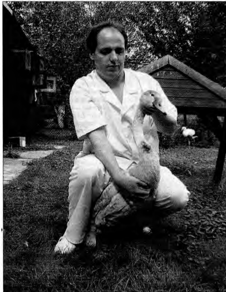
Po kilku godzinach od zabiegu łabędź doszedł do siebie. Teraz przechodzić będzie rehabilitację.

– Na początku myśleliśmy, że haczyk z żyłką wbił się w podniebienie lub w dziób. Niestety, okazało się, że żyłka wychodzi z przełyku. To znaczyło, że łabędź, szukając pokarmu, połknął szczątki jakiejś rośliny z dna zbiornika razem ze splawikiem – opowiada R. Fedaczyński. – Decydując się na ten zabieg, wiele ryzykowaliśmy. To bardzo skomplikowana operacja. Podobne na świecie wykonuje się bardzo rzadko. Te ptaki są bardzo wrażliwe na narkozę. Musieliśmy bardzo delikatnie ją dozować. Minimalne przekroczenie dawki sprawia, że łabędź się nie wybudzi. Problemem była oczywiście długa łabędziaszyja – musieliśmy naciąć przełyk. Potem niezwykle delikatnie wyciągnęliśmy tę żyłkę, bo zbyt gwałtowne ruchy spowodowałyby przecięcie przez żyłkę wszystkich struktur jelit. Cały zabieg trwał dwie i pół godziny. Gdyby w tym akwenu przebywał jeszcze kilka godzin, skończyłoby się to dla niego tragicznie – powiedział.