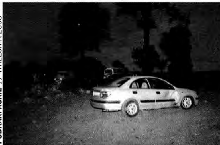
Po zderzeniu nissan zatrzymał się 30 metrów w polu.

go próbował rozmawiać z nimi w ich ojczystym języku, którego, jak się okazało, zupełnie nie rozumieli. Wtedy wydało się, że są to obywatele Mołdawii a nie Gruzji. Informacje tę potwierdzono też dzięki pomocy służb granicznych z Ukrainy. Historię o gruzińskim obywatelstwie wymyślili, aby wykorzystać sytuację polityczną w Gruzji do zalegalizowania swojego pobytu na terenie Polski. Przyznali się też, że chcieli dostać się przez Polskę do Austrii, gdzie mieszka rodzina jednego z nich i tam zamierzali podjąć pracę. W tej sytuacji całą trójkę nielegalnych imigrantów w ramach umowy o readmisji przekazano służbom granicznym Ukrainy.