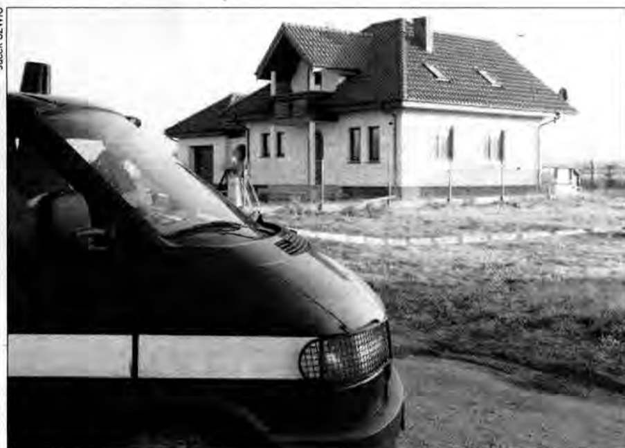
2 grudnia 2006 roku. Policjanci z przeworska zabezpieczają teren posesji przy ul. Pogodnej gdzie znaleziono zwłoki właścicieli kantoru.

Hipotezy były różne, ale przeważał pogląd, że mogły to być porachunki półświatka. Wyśuwano teorie, że mogli to być zabójcy zza wschodniej granicy albo członkowie jakiegoś nowego bezwzględniego gangu. W zimie 2007 r. byli najbardziej poszukiwanymi ludźmi w naszym kraju. Komenda Główna Policji powołała specjalną grupę śledczą, złożoną z policjantów z kilku województw. Uruchomiono agentów, wtyczki w półświatku, szukano kogoś, kto kupował broń i amunicję, kto interesował się kantorami. I kogoś, kto nie zaważałby się strzelać.