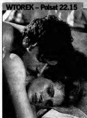
Sypiając z wrogiem – dramat obyczajowy, USA 1991, reż. Joseph Ruben. Laura i Martin są małżeństwem od 4 lat. Pozornie udany związek w istocie jest dla Laury udręką. Zazdrosny Martin znęca się nad nią. Pewnego dnia Laura ucieka z domu.

Materiał informacyjny, internetowy oraz zdjęcia zostały dostarczone przez A plus C. Oprac. MŻ.