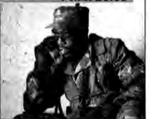
Strzelec wyborowy - film sensacyjny, Rumunia/USA 2005, reż. Marcus Adams.

Terrorysti planują uruchomienie reaktora czeszczeńskiej elektrowni jądrowej. Na miejsce zostaje wysłany amerykański agent specjalny, który musi uprzecz ich działania. Odkrywa, że padł ofiarą spisku.