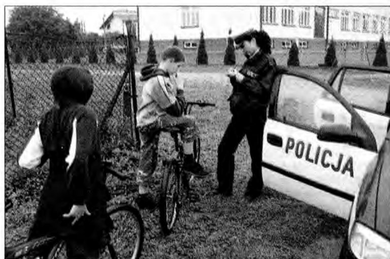
Chłopcy martwili się, czy będzie mandat za brak światełek.

mieszkanca Przeworska. Była pijana. Miała prawie 1,5 promila alkoholu. Ale tym wydarzeniem zajmowali się już inni policjanci. Jacek SZWIC