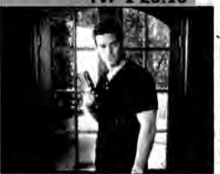
Wojna Logana: Kwestia honoru - film sensacyjny, USA 1998, reż. Michael Prece.

W dzieciństwie Logan przeżył koszmarny, na jego oczach wymordowano mu rodzinę. Po latach jako tajny agent przenika w sferę mafii, by pomóc śmierć bliskich.