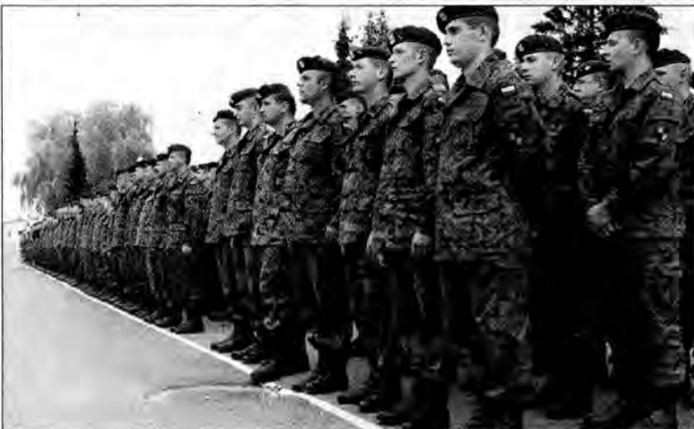
Żołnierze z Żurawicy do misji przygotowywali się między innymi na poligonie w Nowej Dębie.

Zgodnie z tradycją, podczas pożegnalnych uroczystości doszło do przekazania podhalańskich symboli dowodzenia przez dowódcę 21. BSP gen. bryg. Tomasz Bąka, dowódcę XIX zmiany. – Dzień, w którym was żegnamy jest szczególny. Wyróżnia się na całym świecie słownikiem symbolem 0911. Wszyscy pamiętamy