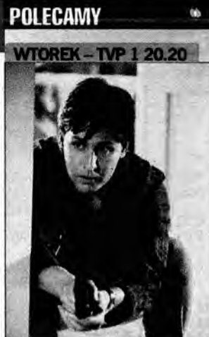
Nowa zasadzka – komedia kryminalna, USA 1993, reż. John Badham. Lu Delano jest głównym świadkiem oskarżenia w procesie jednego z przywódców mafii. Po zamachu na nią zniknęła bez śladu. Dwa detektywi, Chris Lecce i Bill Reimers, muszą ją odnaleźć.