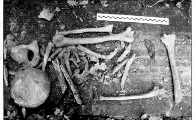
Fragmety kości, których pochodzenie należy wyjaśnić.