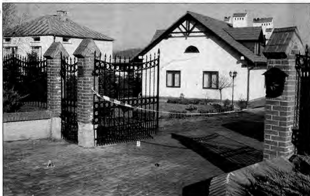
16 listopada 2006 roku. Ostrow pod Przemyslem. To przy tej posesji rozegrała się tragedia. Zdjęcie wykonano kilka godzin po napadzie.

Seria przestępstw zaczęła się 7 grudnia 2005 r. od napadu na kantor w Kraśniku. Potem były kolejne: Sosnowiec, Tarnów, Piotrków Trybunalski i Myślenice. Bandyty zastrzelili pięć osób, dwie bardzo ciężko ranili. Ich ofiary nie miały szans, bo zabójcy najpierw strzelali, a potem rabowali. Z kantorów w południowej i środkowej Polsce ukradli ok. 230 tys. zł. Kim byli?