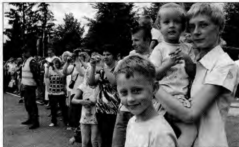
Wyjeżdżających żegnali najbliżsi.