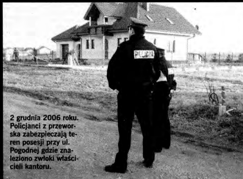
2 grudnia 2006 roku. Policjanci z przeworska zabezpieczają teren posesji przy ul. Pogodnej gdzie znaleziono zwłoki właścicieli kantoru.