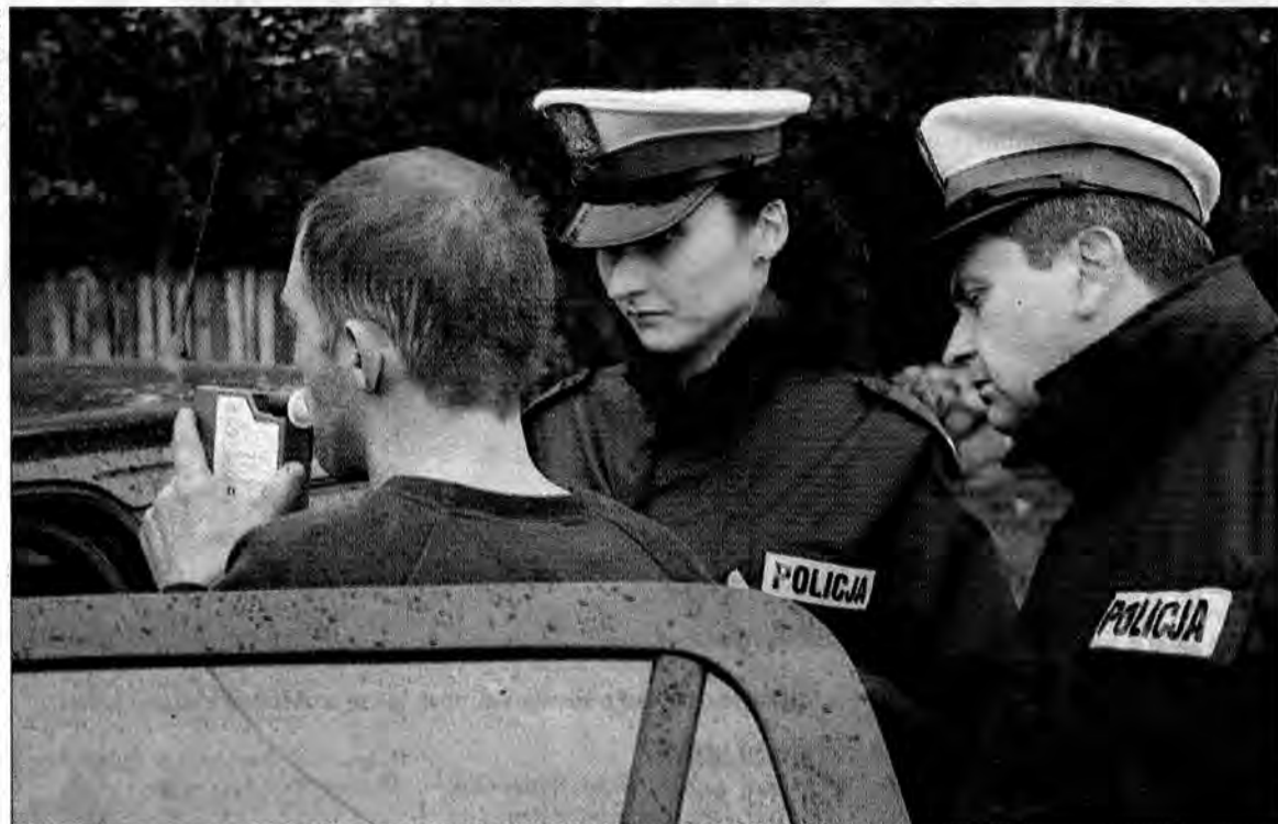
Na alkoście 0, 0, ale mandat za przekroczenie prędkości będzie.'

W Ubieszynie ustawiamy się koło remizy OSP. Policjanci wyciągają radar, bo tutejsi mieszkańcy skarżyli się na kierowców pędzących przez wioskę. Faktycznie, już po kilku minutach radar wskazuje 72 kilometry. Kierowca spuszcza głowę. – No jechałem trochę za szybko – mówi. Trochę to 22 km, więc należy się mandat i cztery punkty karne. Pytany, czy coś pił, znowu spuszcza głowę. – Jedno piwo, ale jeszcze przed południem. Na