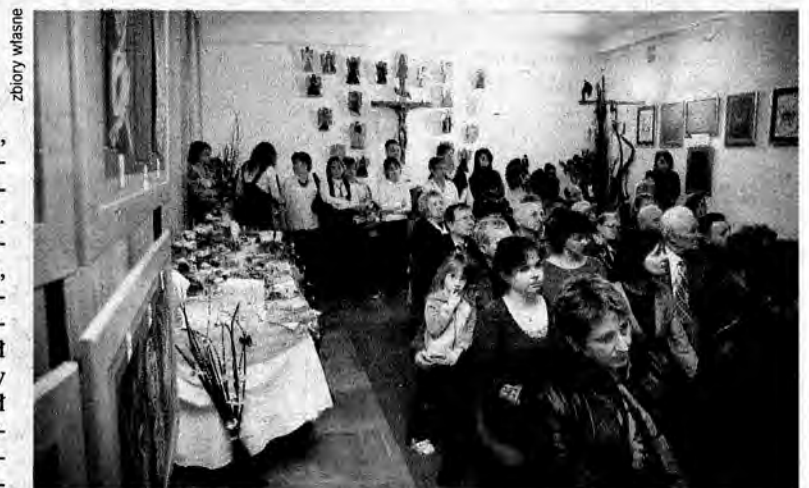
W charytatywnej inicjatywie wzięło udział liczne grono mieszkańców Medyki oraz sympatyków twórczości wystawiających prace artystów.

W charytatywnej inicjatywie wzięło udział liczne grono mieszkańców oraz sympatyków twórczości wystawiających prace ar-