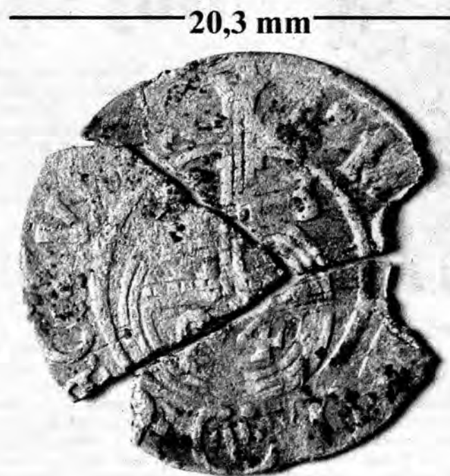
Srebrny półtorak z 1614 roku znaleziony niedaleko Przemysła.

rewersie dobrze widoczne jabłko królewskie, a w nim cyfra oznaczająca 1/24 część talara. Wyżej pod krzyżem skrócona data (16)14. Do-