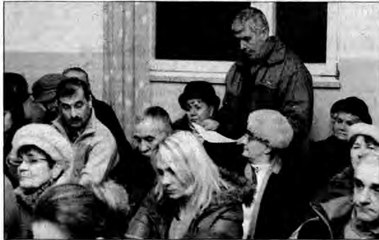
Jedno ze spotkań władz Przemyśla z mieszkańcami Krównik na temat zmiany granic.

W ubiegłym tygodniu mieszkańcy wsi Krówniki (gmina Przemyśl) złożyli u wojewody podkarpackiego pismo, w którym opowiadają się za odłączeniem swojego sołectwa od gminy i przyłączeniem do miasta.