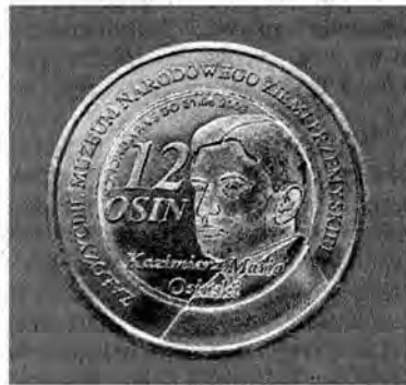
12 osin – awers i rewers.

Są to dwie monety poświęcone założycielowi muzeum, przemyslaninowi Kazimierzowi Marii Osiniemu i od jego nazwiska noszące nazwę osin . Pierwsza o nominale 8 osin (równowartość ośmiu złotych), średnicy 27 mm, wybita w mosiądzu. Druga tej samej średnicy dwukolorowa, wybita w mosiądzu i alpacy ozdobiona syntetycznym rubinem ma nominal 12 osin (równowartość dwunastu złotych). Monety wybite zostały w Mennicy Łebskiej w nakładzie 2500 sztuk każda. Zapro-