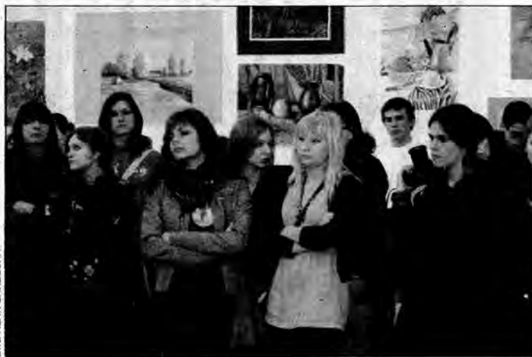
W wernisażu wystawy uczestniczyli uczniowie szkół plastycznych z całej Polski.

„Wyspiański i jemu podobni” to 2. Ogólnopolskie Biennale Pasteli, którego finał odbył się 2 kwietnia w jarosławskiej Synagodze, w sali wystawowej Zespołu Szkół Plastycznych im. Stanisława Wyspiańskiego.