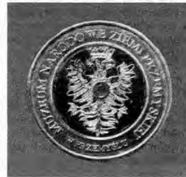
8 osin – awers i rewers.

– Emisja dukatów lokalnych cieszy się bardzo dużym powodze-