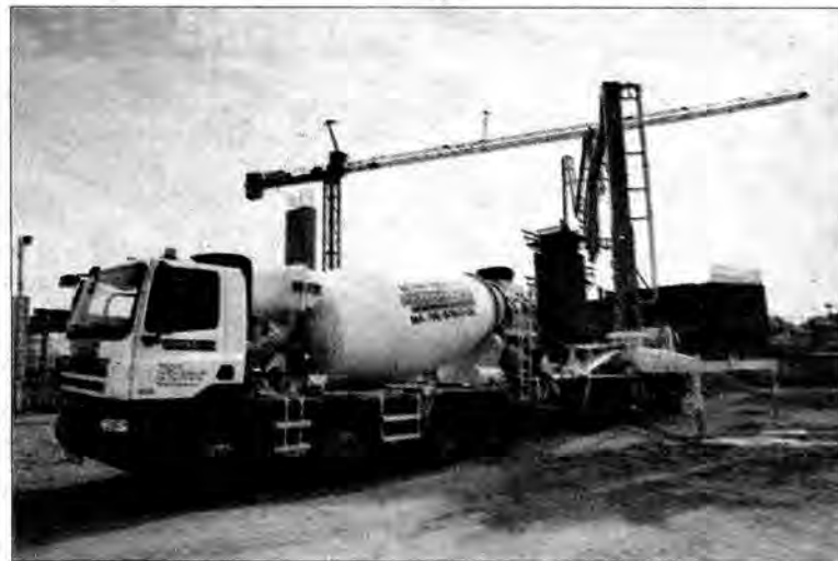
Na placu budowy Galerii „Sanowej” prace prowadzone są niemal przez 24 godziny na dobę.

Kilka miesięcy temu w Przemysłu głośno było o planach budowy trzech wielkopowierzchniowych obiektów: największego z nich – Centrum Handlowego „Cegielnia” oraz Galerii Handlowej „Przemysł” i Galerii „Sanowa”. Obecnie prace budowlane trwają przy tej ostatniej. Centrum zlokalizowane jest na terenie byłych zakładów mięsnych, u zbiegu ulic Sanowej, Brudzewskiego, Rzeźniczej i Kopernika. Potężny obiekt liczyć będzie ponad 30 tys. metrów kwadratowych powierzchni handlowej, około 100 punktów handlowych, usługowych i gastronomicznych usytuowanych na jednej kondygnacji, multikino z 5 salami oraz restaurację. Inwestorem i deweloperem galerii jest spółka San Development, spółka celowa powołana na potrzeby realizacji galerii. Stworzona została przez konsorcjum, w skład którego wchodzi firmy: PA Nova SA z Gliwic oraz Beef San SA. Projekt