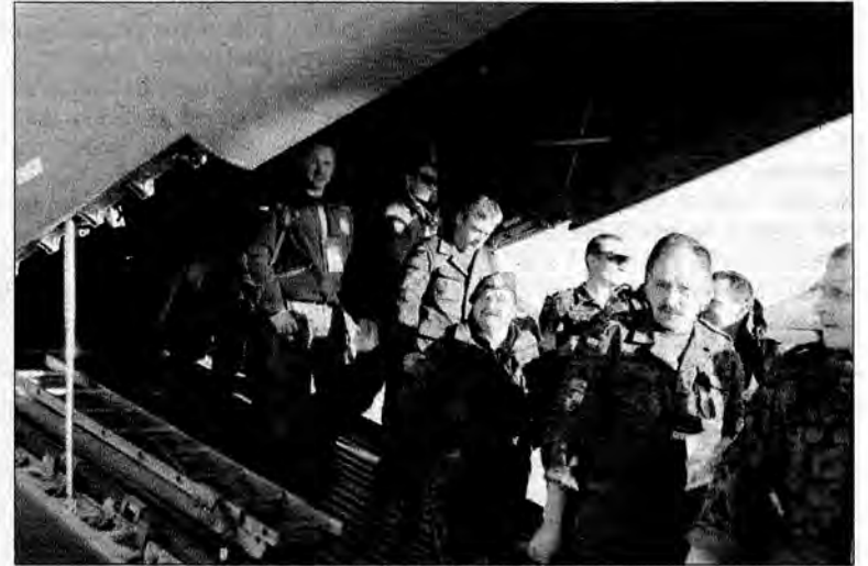
Żołnierze wrócili cali i zdrowi.

XIX zmiana sformowana została na bazie 1. batalionu czołgów stacjonującego w podprzemyskiej Żurawicy, wchodzącego w skład 21. Brygady Strzelców Podhalańskich. Była to już druga ich misja w Kosowie. Ogółem udział w niej wzięło 287 żołnierzy, którzy stacjonowali w bazie „Camp Bondsteel”. Batalion wchodził w skład Wielonarodowej