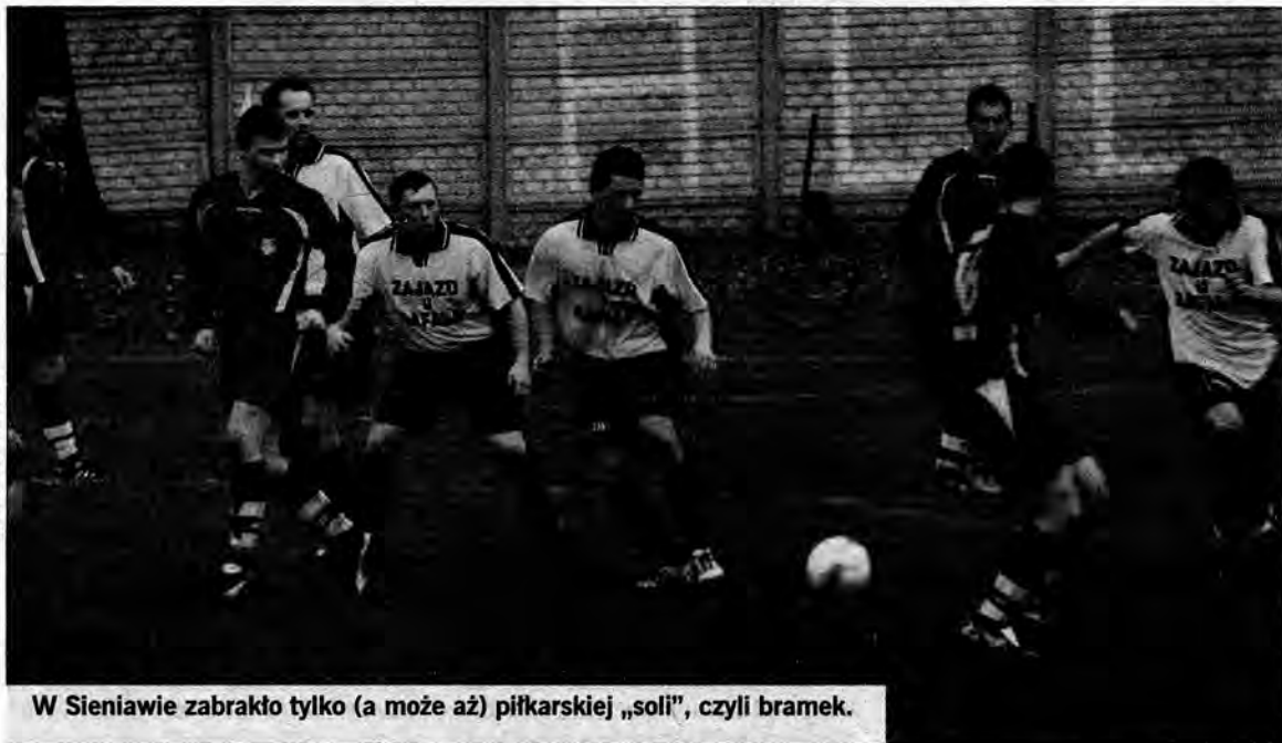
W Sieniawie zabrakło tylko (a może aż) piłkarskiej „sol”, czyli bramek.