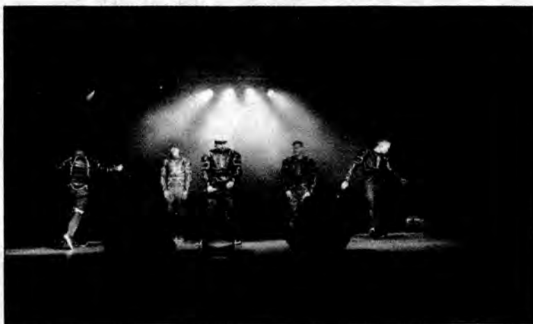
Zespół Boys bawił na scenie publiczność.