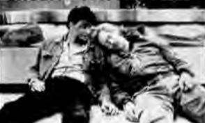
Żółtodziób – film sensacyjny, USA 1990, reż. Clint Eastwood.

Doświadczony detektyw Pulowski usiłuje odnaleźć morderców swojego partnera. Jego nowym współpracownikiem zostaje młody, opanowany David Ackerman, przeciwieństwo porywczego Pulowskiego.