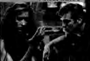
Solaris – film SF, USA 2002, reż. Steven Soderbergh.

Psycholog, dr Chris Kelvin, zostaje wysłany na stację kosmiczną, która utraciła kontakt z Ziemią. Na miejscu okazuje się, że jej dowódca nie żyje, a załoga zdradza objawy choroby psychicznej.