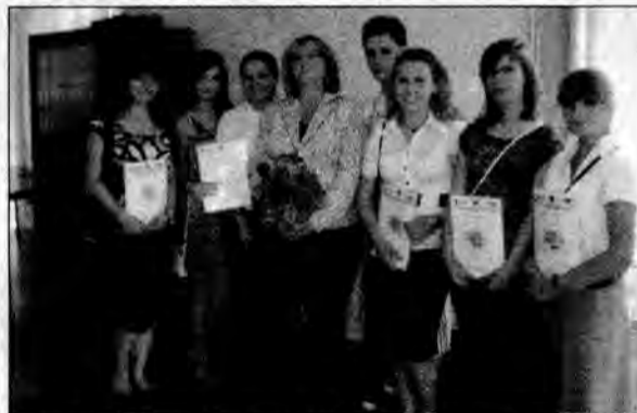
Z zaświadczeniami w dłoni – próba generalna przed odbiorem certyfikatów TELC.

ludzki. Wymierne i policzalne efekty to jedna strona przedsięwzięcia. Drugą są te wartości i umiejętności, do których nie da się przyłożyć żadnej miarki, a które procentują przez lata, implikują kolejne działania i wpływają na przyszłe decyzje. W październiku 2009 roku 70 uczestników naszego projektu rozpoczęło na nowo organizować swój popołudniowy czas. Wielu z nich zostało niejako zmuszonych do zmiany w sposobie uczenia się języka obcego. Uświadomili sobie, jak ważne są w tym procesie nie tylko systematyczna praca, ale otwartość na inną kulturę, tolerancja, umiejętność wsłuchiwanie się w słowa drugiego człowieka. Język obcy bowiem to nie tylko zespół reguł gramatycznych, strukturalnych czy wykaz słówek. To sprawność, której już