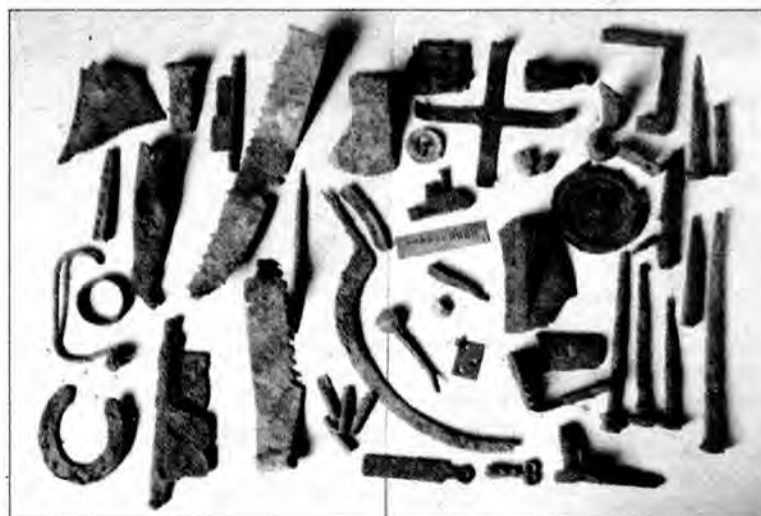
Ostatnie materialne ślady po Terebniu trafią do Mołodycza, gdzie w szkole powstaje lokalne muzeum tych ziem.