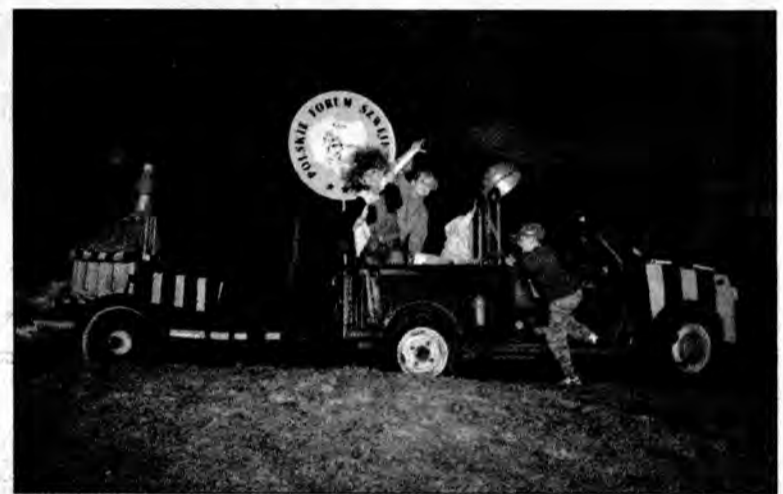
Forteczny pojazd bojowy zarówno w dzień, jak i w nocy bardzo interesował najmłodszych uczestników manewrów.

ŁĘTOWNIA: Fort VIII. Co tam się nie działo!