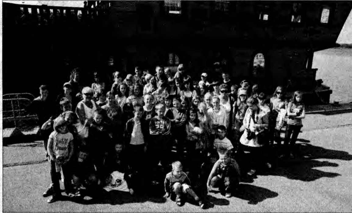
W tym roku na wakacyjny wypoczynek do Pobierowa, który trwał od 27 czerwca do 10 lipca, pojechali 48 dzieci.

Każdego dnia po śniadaniu koloniści mogli liczyć na różne atrakcje. Ponieważ przez cały czas pogoda dopisywała, stąd zdecydowanie największą z nich była kąpiel w morzu. A na złocistym piasku powstawały piękne budowle z pia-