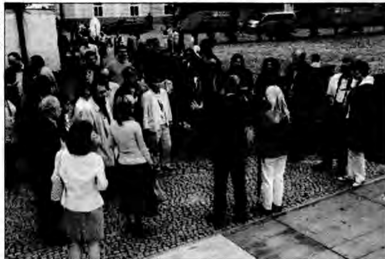
Goście z zainteresowaniem słuchali o historii tysiącletniego Przemyśla.

Był to jeden z punktów programu, który dla dyplomatów i ich żon przygotował urząd wojewódzki.