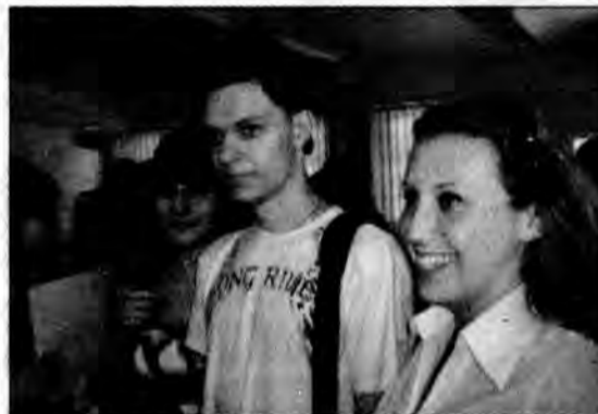
Takie uśmiechy są najlepszą ankietą oceniającą projekt.

Taka wysoka ocena obciąża i mobilizuje. Dzisiaj za nami prawie 1000 godzin zajęć z języków angielskiego i niemieckiego, 88 godzin egzaminów TELC, 490 zakupionych podręczników i 840 materiałów edukacyjnych i biurowych, które stały się własnością słuchaczy, setki ćwiczeń, testów, rozmów, prac pisemnych. Są już pierwsze efekty: świetne wyniki matur wśród naszych słuchaczy: na 36 maturzystów 20 zdało maturę pisemną z języka obcego powyżej 70%. Są wśród nich też takie perełki jak 95%, 88% z matury rozszerzonej z języka niemieckiego, 94% z matury podstawowej z języka niemieckiego, 92%, 90%, 88%, 84% z matury podstawowej z języka angielskiego, czy 94% z matury rozszerzonej z j. angielskiego. Ogromnym sukcesem jednak są wyniki matur wśród osób, które rokowały niewielkie nadzieje na opanowanie materiału szkolenia na poziomie B1. Przez lata zmagali się one z problemami języka angielskiego czy niemieckie-