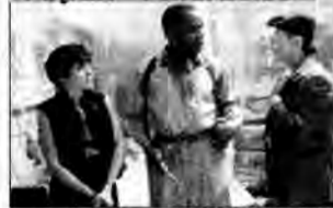
Predator II - Starcie w miejskiej dżungli - film sensacyjny, USA 1990, reż. Stephen Hopkins.

Były komandos, Mike Harrigan, podjął służbę w policji w Los Angeles. Mężczyzna nie podejrzewa, że ponownie będzie musiał zmierzyć się z niewidzialnym przybyszem z kosmosu, który zabija ludzi.