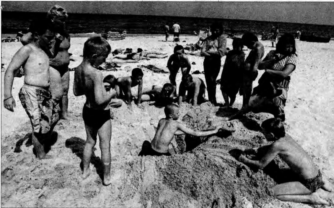
A na złocistym piasku powstawały piękne budowle z piasku, najczęściej było zamków i żółwi.

W tym roku na dwutygodniowy wypoczynek do Pobierowa pojechało 48 dzieci. Ich wyjazd był możliwy dzięki inicjatywie naszej redakcji, Fundacji Życia Podkarpackiego „Podaruj Dzieciom Radość” oraz służbom mundurowym i tym wszystkim, którzy pomagali w organizacji „VIII Wielkiego Pikniku Charytatywnego – Spotkanie Gwiazd”.