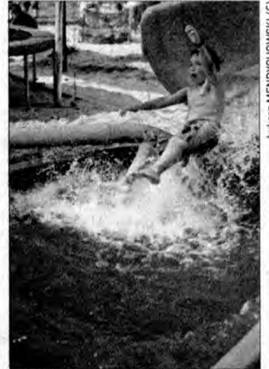
Co odważniejsi zmierzyli się z megazjeżdźalnią i ujeżdżaniem wściekłego byka.

„Błędny rycerz”. Jej uczestnicy zostali podzieleni na kilka drużyn. Każdy z członków drużyny, z zasłoniętymi oczyma i dzidą w rękę musiał przejść kilkumetrowy odcinek i przewrócić stojące