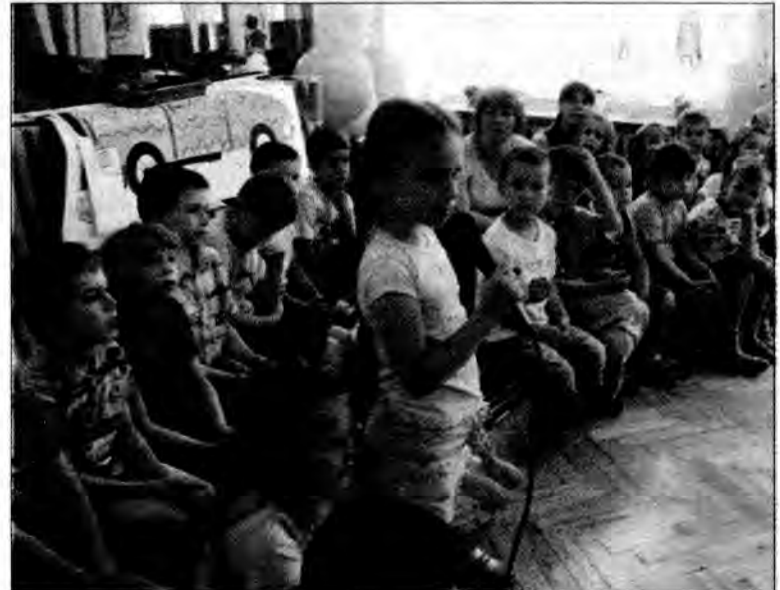
Przedszkolaki egzamin na kartę pieszego uczestnika ruchu drogowego zdały śpiewająco.

Choć brzmi to niezwykle poważnie, dzieci, przyswajając sobie informacje o bezpiecznym poruszaniu się po drodze i znakach drogowych, doskonale się bawią, bo wiedza podana jest w formie zabawy. Na przykład zanim maluchy uzyskały kartę pieszego, która potwierdza, że zostały pełnoprawnym uczestnikiem ruchu drogowego, musiały wskazać Koziołkowi Matołkowi właściwą drogę do Pacanowa. Miały też do wykonania kilka niełatwych zadań. Między innymi musiały nazwać elementy drogi przedstawionej na ilustracji, odpowiedzieć na pytania dotyczące zasad poruszania się po chodniku, drodze i podać zasady bezpieczne-