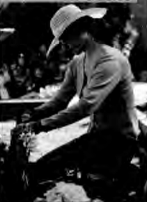
Mroczne tajemnice – dramat kryminalny, Kanada 2005, reż. George Mendeluk.

Jill, wdowa od 10 lat, dowiadyuje się, że jej mąż nie zginął w pożarze, lecz sfingował własną śmierć. Naprawdę zmarł przed kilkoma dniami. Kobieta postanawia dowiedzieć się prawdy o mężu.