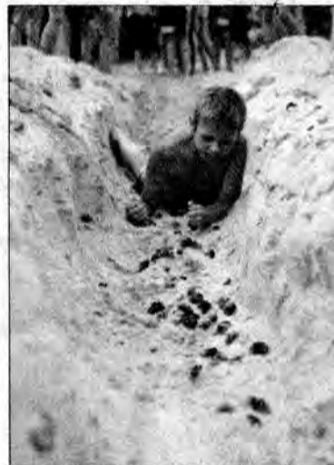
Na zakończenie kolonii odbył się chrzest na kolonistę. Choć zadania były trudne, każdy je wykonał.

Organizatorzy wypoczynku starali się, aby również w ośrodku nie zabrakło atrakcji. Jedną z nich była „Zgadywanka terenowa”. W specjalnie przygotowanej części lasu, na drzewach, zostały umocowane czerwone i żółte wstążki. Czerwone wskazywały trasę, po której należy się przemieszczać, żółte oznaczały, że w ich pobliżu ukryte jest pytanie, na które należy odpowiedzieć. W sumie wszystkich pytań było 12, a trasa zgadywanki liczyła około 1,5 kilometra. Z lepszym lub gorszym wynikiem, ale wszystkim udało się ją pokonać. Konkurencją, która wzbudziła wiele emocji był tzw.