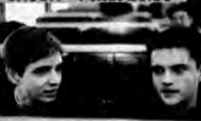
Debiutant – komedia romantyczna, USA 2002, reż. Gary Winick.

15-letni i nad wiek dojrzały Oscar Grubman gustuje w towarzystwie pięknych, inteligentnych i starszych od siebie kobiet. Jego ambicją jest zdobyć serce macochy.