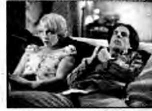
Już nadchodzi - komedia romantyczna, USA 1999, reż. Colette Burson.

Trzy nastolatki rozpoczynają studia. Od momentu zamieszkania w akademiku większym zainteresowaniem darzą chłopców niż naukę. Chcą zdobyć jak największą ilość miłosnych doświadczeń.