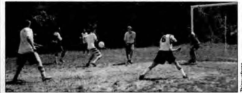
Rozgrywki w piłkę nożną zapewniły sympakom tej dyscypliny sporą dawkę sportowych emocji.

Podczas Młodzieżowej Imprezy Kazanów – Lipowica, zorganizowanej w ostatni weekend czerwca przez SKF Kazanów, Radę Osiedla Kazanów i Radę Osiedla Lipowica, nie brakowało atrakcji dla dużych i małych oraz wspaniałych sportowych emocji.