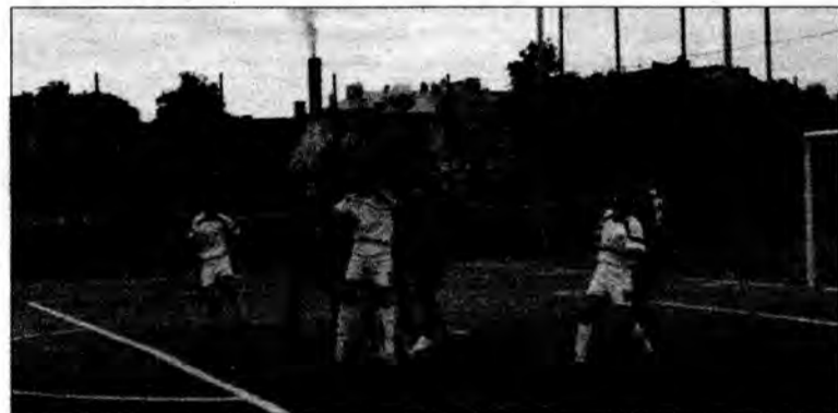
Walka bez odstawiania nogi - tak wyglądało spotkanie finałowe mistrzostw.