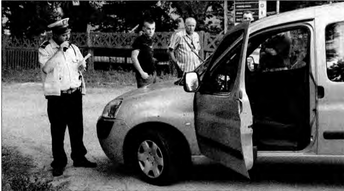
Czwartek, 9 lipca, g. 19.20. Ulica Ofiar Katynia. W tym przypadku chodziło o potrącenie pieszego, więc interwencja policji była potrzebna.

Czwartek, 14.45. Mężczyzna wzywa policję, bo trwa awantura domowa. Dyżurny kieruje patrol na ulicę Chopina. Na miejscu okazuje się, że żona nie pozwala mężowi oglądać telewizji. Ona trzeźwa, on najwyżej po kilku piwach. Z rozmów ze stronami wynika, że nie układają się między nimi. Oboje starają się przekonać policjantów do swoich racji, ale Bóg raczy wiedzieć, po czyjej stronie jest prawda. Policjant informuje małżonków o procedurach rozwiązywania rodzinnych konfliktów i tłumaczy mężowi, że wezwanie policji było w tym przypadku nieuzasadnione, za co powinno się sporządzić wniosek do sądu. – Tym razem został pan pouczony, ale następnym razem skończy się to wnioskiem do sądu. Interwencja razem z dojazdem na miejsce trwała pół godziny. – Takie sytuacje zdarzają się bardzo często – mówi policjant. – Parę godzin wcześniej wezwano nas, bo kłócił się brat z siostrą. Młodzi ludzie. Nawrzucaли sobie, nawrzucaли i nie mogąc dojść do