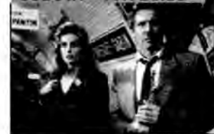
Frantic - thriller, USA 1988, reż. Roman Polański.

Podróż do Paryża staje się dla Walkerów koszmarem. Gdy Richard brat przysięgnik, jego żona zniknęła. Zdany tylko na siebie, musi odkryć, kto i dlaczego ją uprowadził, nim porywacze stracą cierpliwość.