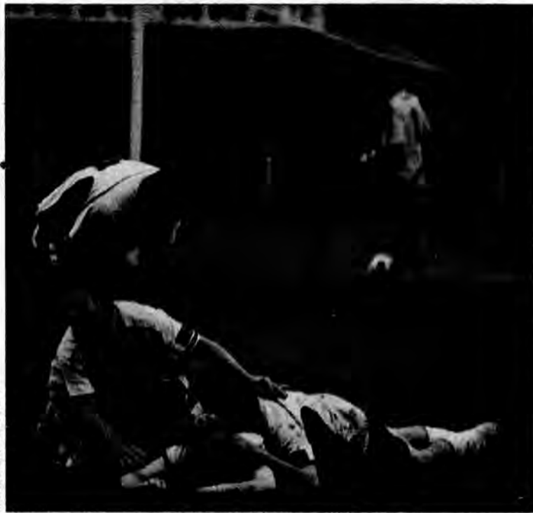
Radość piłkarzy z Kańczugi po wywalczeniu awansu była ogromna.