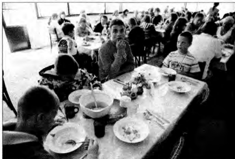
Obiad był o godzinie 13, zawsze dwudaniowy. Wśród zup królował barszcz, różne jarzynowe czy rosół.