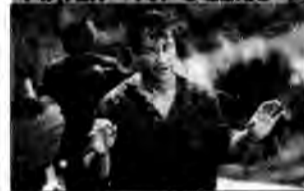
Air America - film sensacyjny, USA 1990, reż. Roger Spottiswoode.

Do jednostki CIA w Laosie, o nazwie Air America, przybywa nowy pilot, Billy Covington. Zaprzyjaźnia się z jednym z weteranów, szalonym Genem Ryackiem. Obaj wpadają na trop handlarzy narkotyków.