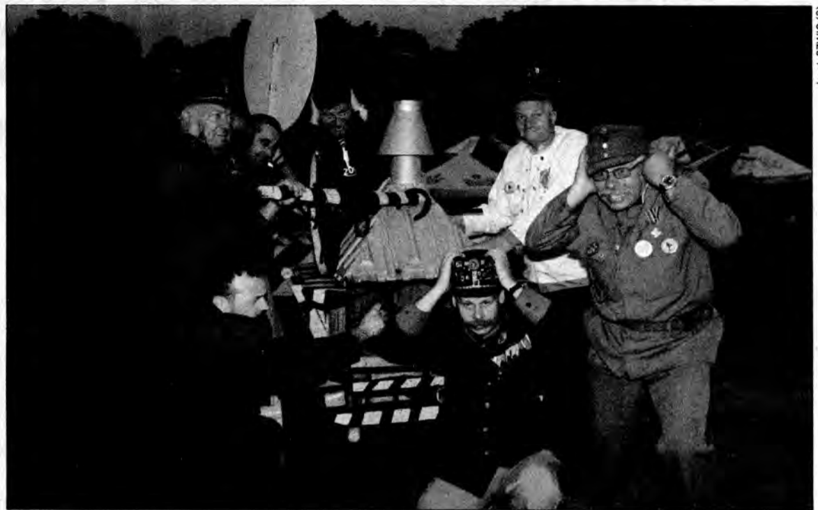
Rozległ się straszliwy huk. Generalicja złapała się za głowy i zatykała uszy. Twierdza została wysadzona.

W niedzielę, pewnie dlatego żeby odreagować, dowództwo Twierdzy przywitało ambasadorów, którzy tego dnia gościli w Przemyślu groźnym: – Halt! Papieren! Wszystko skończyło się dobrze i dyplomaci po otrzymaniu przepustek zostali dopuszczeni do figury Szwejka, przy której robili sobie pamiątkowe zdjęcia. Tradycyjnie już