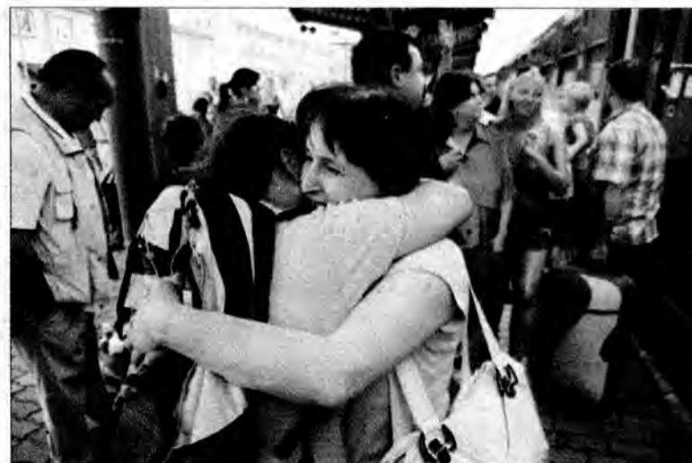
Witajcie w domu