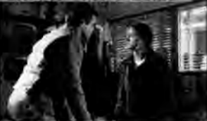
Zapisane w sercu – dramat obyczajowy, USA 1999, reż. Harry Winer.

Rebecca mieszka wraz ze świeżo poślubionym mężem w San Pedro. Ciępi na amnezję. Przypadkowe spotkanie w supermarkecie pozwala jej odkryć klucz do przeszłości.