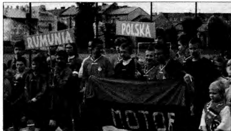
W mistrzostwach udział wzięły ekipy z Polski, Ukrainy, Słowacji, Mołdawii i Rumunii.