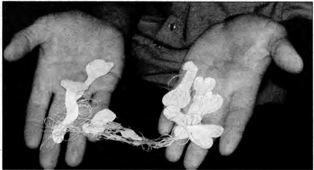
Zabezpieczone przez policję papierowe narządy, którymi 17-latek udekorował drzwi.

W ubiegłym tygodniu 67-letnia mieszkanka jednego z jarosławskich osiedli zadzwoniła na policję z prośbą o pomoc, bo jak tłumaczyła, ktoś ozdobił jej drzwi świństwami, co bardzo ją niepokoi i napawa strachem, że sprawca może mieć wobec niej złe zamiary. Policjanci, którzy przyjechali na miejsce, potwierdzili, że na drzwiach wejściowych do mieszkania kobiety ktoś na nitkach zawiesił wycinanki z papieru, przypominające kształtem męski narząd. Ponadto prawdopodobnie ten sam sprawca nakleił na jej domofon skrawek papieru z obraźliwym napisem. Policjanci zabezpieczyli wszelkie ślady, rozpytali pokrzywdzoną, pokrę-