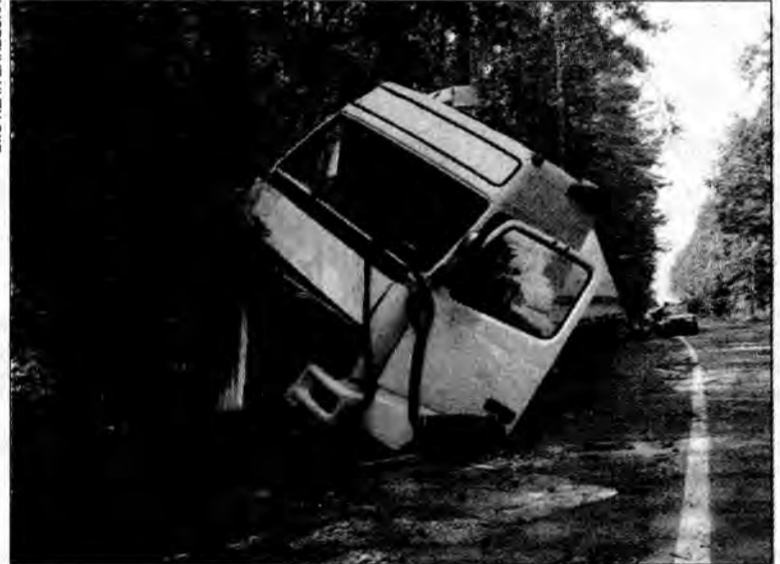
Rozładunek zapakowanego 24-tonami chemii tira trwał do późnych godzin wieczornych.

PRZEMYŚL: Maluchy pełnoprawnymi uczestnikami ruchu drogowego