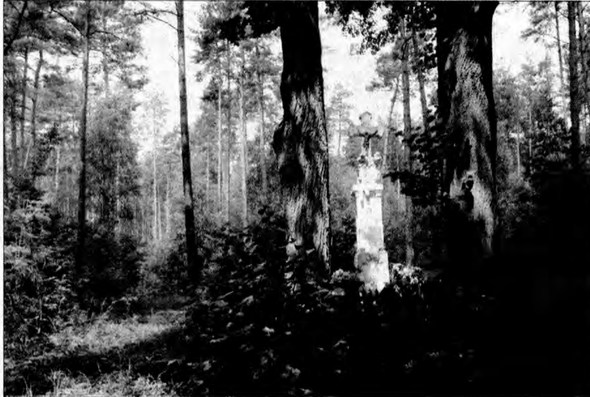
Ponadstuletnia kapliczka pomiędzy równie starymi lipami, w miejscu gdzie kończyła się wioska.