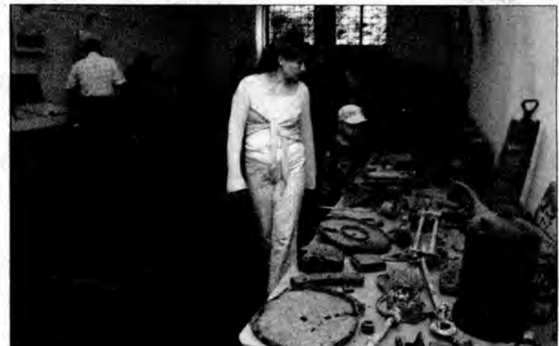
Wszystkich interesowały zbiory militariów.