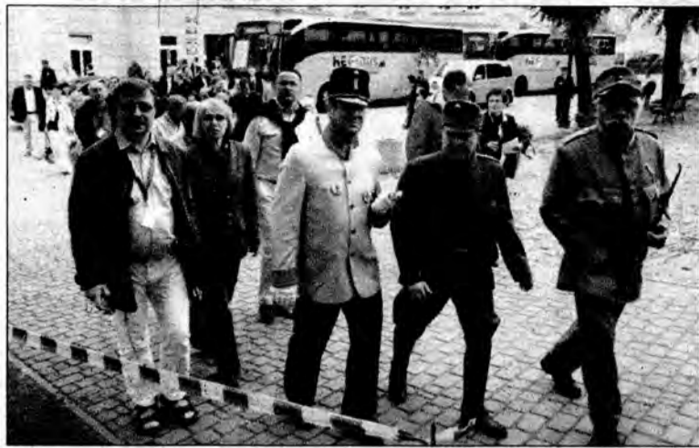
– Halt! Papieren!, i ambasadorzy po otrzymaniu specjalnych przepustek pod przewodnictwem sztabu Twierdzy udali się pod figurę Szwejka.

„Jak tam było, tak tam było, ale jeszcze tak nie było, żeby jakoś nie było” – ta wiekopomna myśl Józefa Szwejka potwierdziła się podczas 12. „nietuzinkowych” Wielkich Manewrów Szwejkowskich, które odbyły się w Przemyślu w czasie ostatniego weekendu.