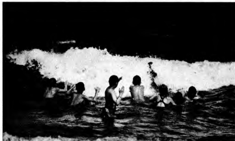
Nad morzem pogoda cały czas dopisywała, stąd zdecydowanie największą atrakcją była kąpiel w morzu.