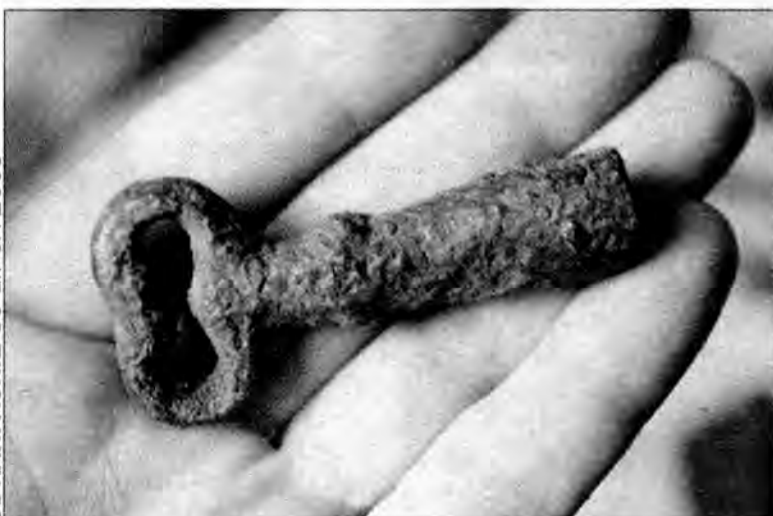
Kto w Terebniu mógł mieć zegar ścienny, który nakręcało się tym kluczem?