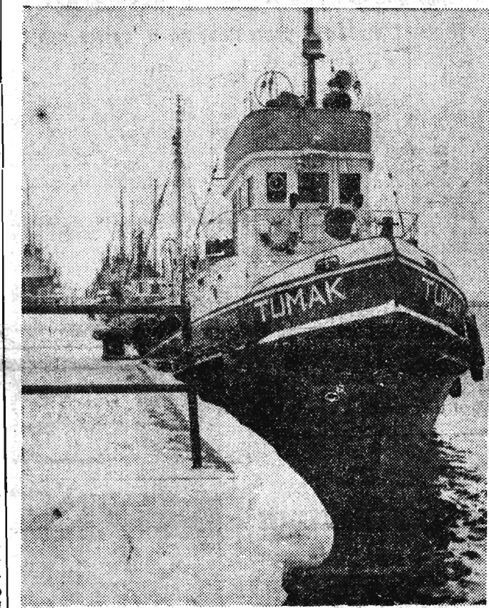
W całym kraju jest mroźno. Na Wybrzeżu przez kilka dni panowała sztormowa pogoda. Jednostki rybackie schroniły się do portów. Na zdjęciu: Holownik „Tumak” przy ośnieżonym nabrzeżu portu gdańskiego.

Postanowiono zwrócić się do rządów krajów Układu Warszawskiego z prośbą o zatwierdzenie powyższych decyzji na najbliższym posiedzeniu Politycznego Komitetu Doradczego.