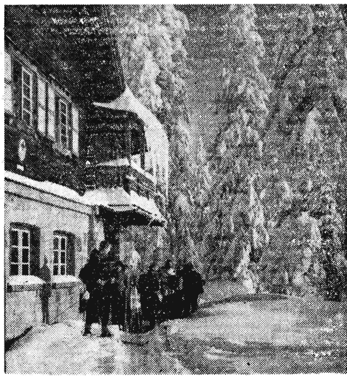
Przed schroniskiem na Hali Lipowskiej CAF—fot. Seko