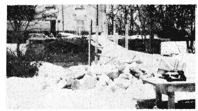
Ha, trudno brakowało takich „obiektyw” i już. Budowano nowe piękne osiedla, uzupełniano luki w starym budownictwie, moze i zapomniano o szalech? Teraz to się nazywa, że „były pilniejsze potrzeby”. Zresztą tych, którzy upominają się o szalety przyjmowano ze zmiennym przywruczeniem oka.

Uroczystym akordem zakończyło się szkolenie pierwszego kursu wiedzy praktycznej zorganizowane na Uniwersytecie Powszechnym w Zakładowym Domu Kultury WSK w Rzeszowie. Kurs ukończyło 17 kobiet. Wszystkie otrzymały dyplomy ukończenia kursu, a ich prace, wykonane w czasie trwania szkolenia, zostały eksponowane na otwarciu w foyer ZDK wystawie.