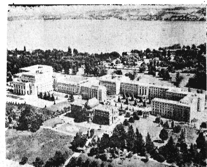
Na zdjęciu: Pałac Narodów nad jeziorem Lemaniańskim w Genewie, w którym odbywają się obrady Komitetu Rozbrojeniowego 18 Państw. Gmach ten, zbudowany w 1936 roku, był początkowo siedzibą Ligi Narodów — dziś mieści Europejskie Biura ONZ.

Obrady rozpoczęły się o godzinie 18 minut 12 czasu miejscowego (godz. 15.12 GMT) — w kilka godzin po naradzie ministrów spraw zagranicznych „wielkiej trójki” (sekretarz stanu USA D. Rusk, minister spraw zagranicznych ZSRR A. Gromyko i minister spraw zagranicznych W. Brytanii lord Home), którzy — jak podkreśla korespondent Agencji Reutera — „starali się utworzyć drogę do osiągnięcia przez Komitet 18 istotnego postępu w rokowaniach”.