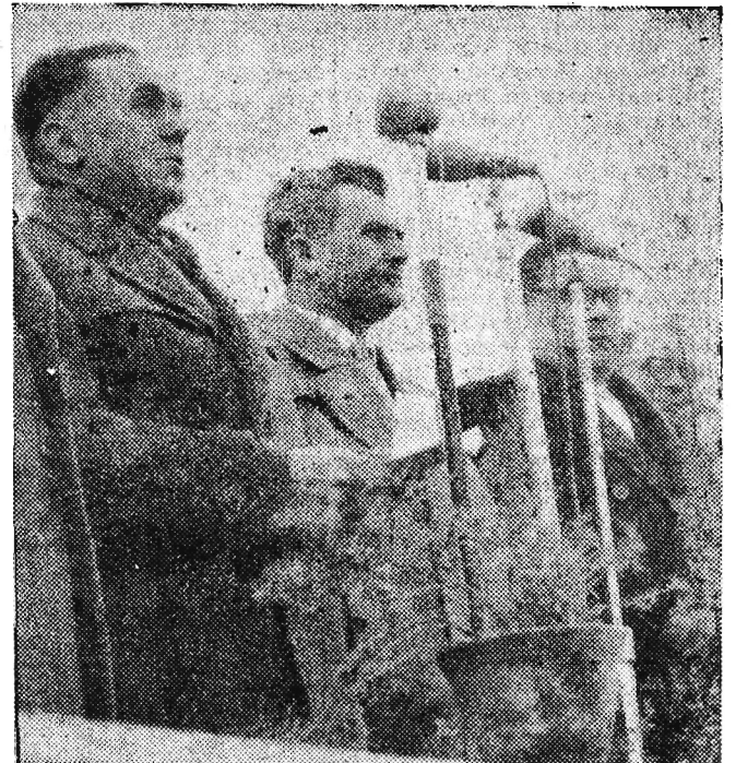
Przemawia I sekretarz KW PZPR tow. Władysław Kruczek

W chwili, gdy nad miastem przetacza się loskot 24 salw artyleryjskich, przy dźwiękach „Międzynarodówki” rusza pochód ludności stolicy.