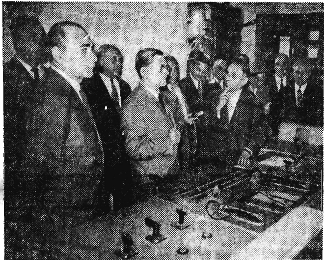
Uczestniczący w centralnych uroczystościach z okazji „Dnia Hutnika” przewodniczący Rady Państwa Aleksander Zawadzki odwiedził hutę „Jedność” w Siemianowicach.