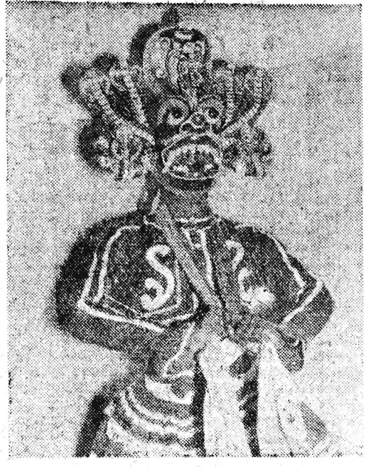
Jeden z solistów cejlońskiego zespołu tańca w stroju z maską do tańca religijnego.

Odrębna dedykacja dyrektora cejlońskiego zespołu tanecznego dla czytelników „Nowin Rzeszowskich” z pozdrowieniami i podziękowaniem za przyjacielskie przyjęcie.