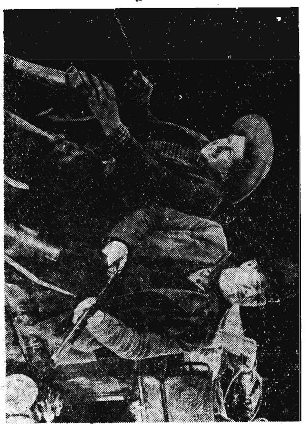
Scena z filmu „Dylizans”.

Voitech Jasný nalezy do najbardziej obiecujacych czeskoslowackich tworcow filmowych i kazdy nowy jego utwór jest u naszych szkolach duzym wydarze- niem artystycznym. Po „Teshkocie” wyzlamanej w 1959 roku na festiwalu w Cannes (nagrada dla CSRS za najlepszy zestaw filmo- wy: „Teshkota” V. Jasného, „Sen nocny letniej” J. Trnki) zobaczyamy drugi je- go film fabularny „PRZE- ZYTIEM SWOJA SMIERC”. Jest to jesczaz jedno spoj- rzanie na obóz koncentracy- ny, tym razem jednak oczyrna czlowieka, ktorego wielokrotnie nie laczy ze wspoltowarzysami, niedoli Mlody bokser, daleki od wszelkiej polityki, utny w sile swoich miesni, sadzi, ze uda mu sie przetrwac obóz „na wasnq rękę” dzieki fizycznej odporno- ci.