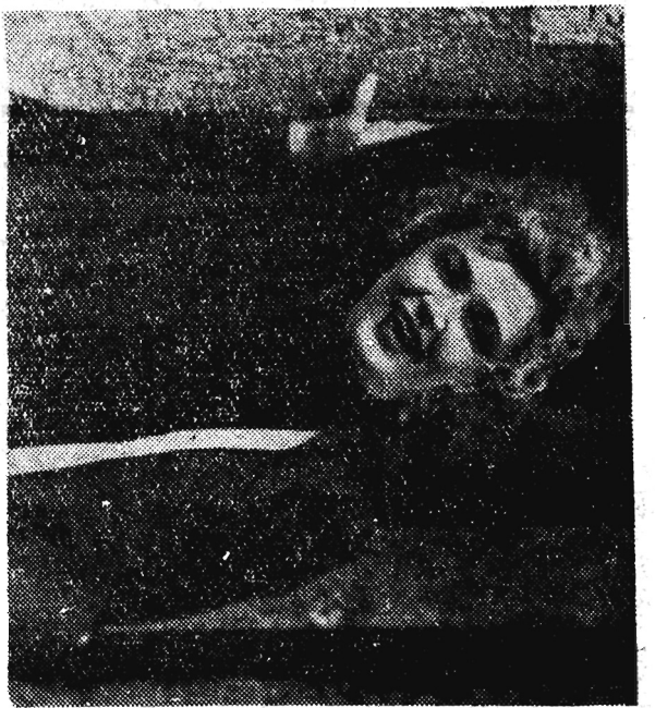
Kadr z filmu „Ten który wrócił”.

Niesiety brak mlejaca nie pozwala nam omowic szerszej wazystkich filmow wchodzacych na ekran w przyszlym tygodniu. Zano- kujemy więc tylko, że o- prócz dwóch powyższych, zobaczymy jesczaz radziec- ki obraz „Ten który wró- cił” rez. L. Wagarszajna.