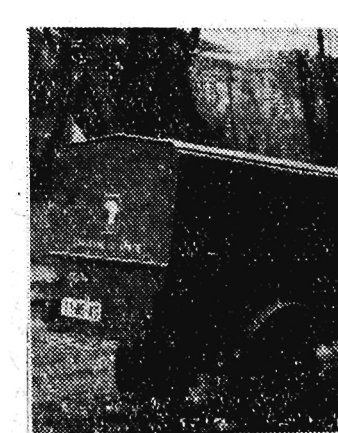
Przed wyruszeniem na wyprawę afrykańską.

Po dwutygodniowym pobycie czujemy się tu już jak w domu i jak stali mieszkańcy Belgradu.