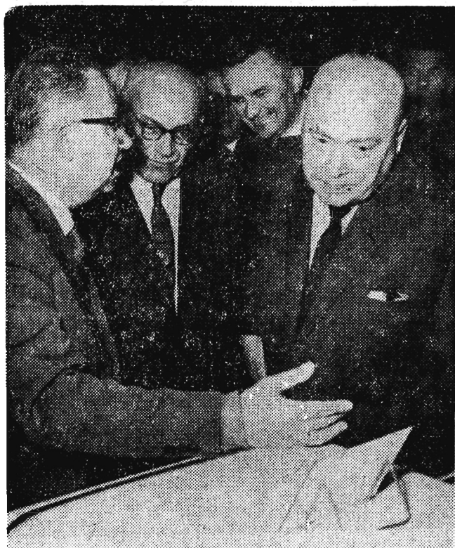
Z okazji jubileuszu — dziesięciolecia działalności Polskiej Akademii Nauk — w Pałacu Kultury i Nauki w Warszawie otwarta została wystawa, którą dnia 18. V. 1962 r. zwiedzili członkowie kierownictwa partii i rządu.