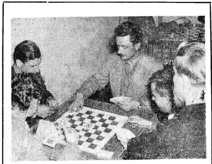
Klub „Azalia” prowadzony przez KZ ZMS w Sarzynie codziennie odwiedzany jest przez stałych bywalców.

Otwarcie ofert nastąpi w dniu 8 czerwca 1962 r. o godz. 12 w PDWdz. K-1014/1