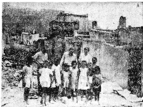
Kapsztadt — jedno z ważniejszych miast portowych Republiki Południowo-Afrykańskiej.

Ponadto dokonano 19 zamachów bombowych, w wyniku których jedna osoba została zabita, a jedna ranna. 16 eksplozji nastąpiło w okręgu Algieru.