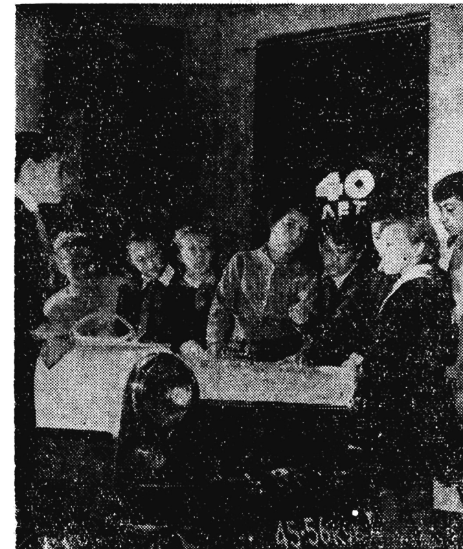
Małolitrażowy samochód „Sputnik”, wykonany przez pionierów z Kurska wzbudza zainteresowanie u młodzieży moskiewskiej zwiedzającej ekspozycję Pałacu Pionierów w Kursku na Wystawie Osiągnięć Gospodarki ZSRR.