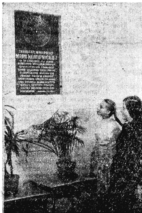
Tablica pamiątkowa w szkole im. M. Konopnickiej w Żarnowcu.

Oprócz lirycznych o najrozmaitszej treści wierszy, nowel, utworów dla dzieci, pozostawiła po sobie epos ludowy „Pan Balcer w