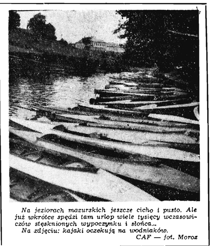
Na jeziorach mazurskich jeszcze cicho i pusto. Ale już wkrótce spędzi tam urlop wiele tysięcy wczasowiczów stęsknionych wypoczynku i słońca... Na zdjęciu: kajaki oczekują na wodniaków.

Co postanowiono? Prezydium PRN na budowę drogi wyasygnuje w tym roku 150 tys. złotych. Sumę tę przeznacza się głównie na materiał, a więc kamień i żwir. Postanowiono wykorzystać miejscowe surowce w przeciwnym razie transport materiałów pochłonąłby większość środków finansowych. Prezydium PRN wydzieliło zwirowisko. Wydział Komunikacji tego Pre-