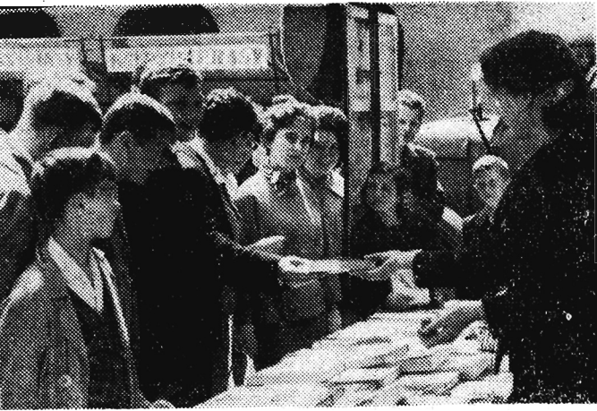
Najwięcej czyta młodzież. Młodzi czytelnicy stanowili też rekordową grupę nabywców na książkowych kiermaszach organizowanych w „Dniach Oświaty, Książki i Prasy”.

I tak rośnie sobie Antos, psując nerwy sąsiadom i nauczycielom, mamusi na pociechę. (zar)