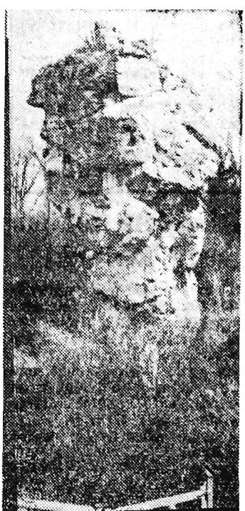
Srebrna Skala w Lives-sur-Meuse (Belgia) — nazwana tak od refleksów, jakie dają na niej promienie zachodzącego słońca — stanowi ciekawy przykład naturalnej równowagi. Olbrzymi głaz opiera się na prawie okrągłej podstawie o średnicy 3 m.