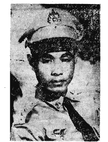
gen. dyw. Kong Le

Program pobytu przewiduje także odwiedzenie przez wojskową delegację Laosu licznych uczelni i jednostek wojskowych na terenie kraju.