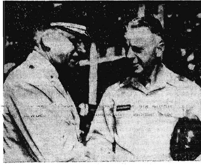
Stany Zjednoczone przerycają coraz to nowe transporty wojsk na pogranicze...